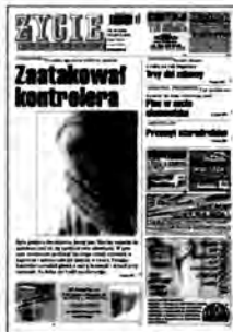
Dwa tygodnie temu pisaliśmy o zaatakowanym kontrolerze MZK.