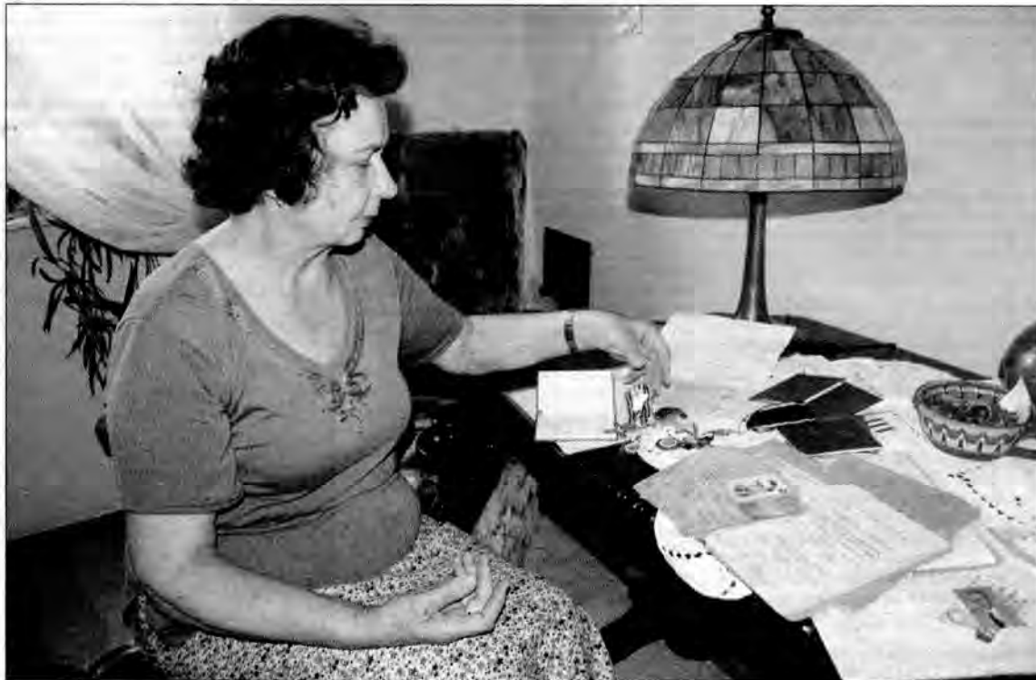
EWB KŁAK-ZARZECKA (2)

Po wojnie o powstaniu warszawskim, o Akcji Burza, ruchu oporu w domu państwa Sobczyńskich mówiło się rzadko. – W swoich ży-