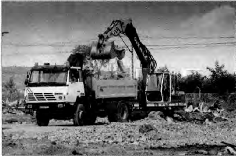
Na terenach należących niegdyś do FAE „Fanina” trwają bardzo intensywne prace rozbiórkowo-porządkowe.

Prace rozbiórkowo-porządkowe rozpoczęły się w połowie czerwca. Ich tempo jest imponujące. Trudno się dziwić, po 10 sierpnia bowiem ma rozpocząć się budowa hipermarketu sieci Castorama.