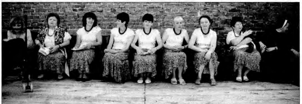
(o) Członkinie pikulickiego koła gospodyń wiejskich – tak energiczne i żywotne, że młódź może pozazdrościć.