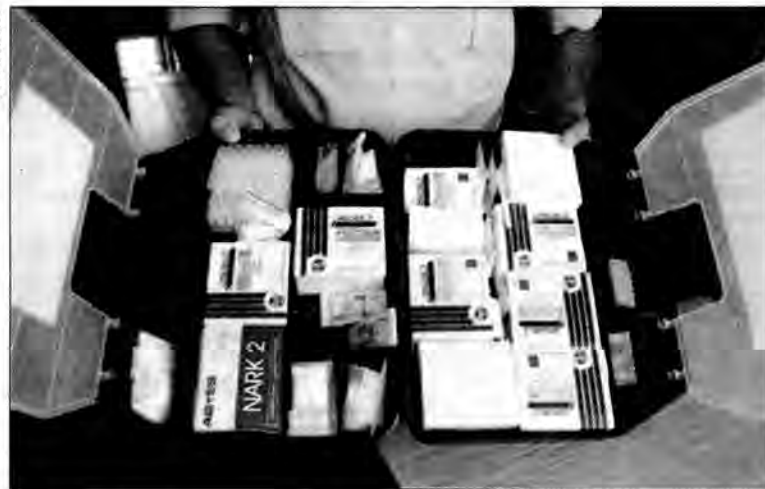
Zestaw testów do wykrywania narkotyków używanych przez Policję oraz prosty tester będący w wyposażeniu funkcjonariuszy Ruchu Drogowego.