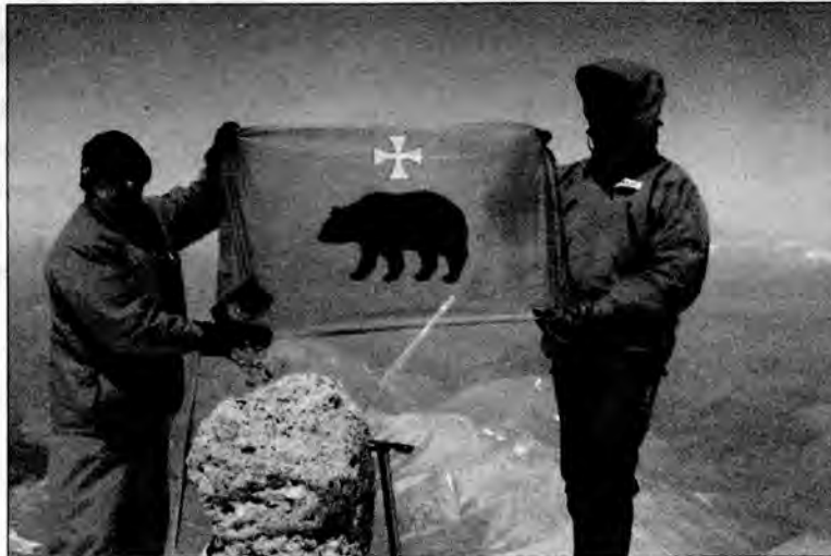
Na wysokości ponad 5 tys. metrów zatrzepotała flaga Przemysła.

Teoretycznie, ale i praktycznie przygotowawaliście się do tej wyprawy długo, lecz wszystko to było na odległość. Czy było coś, co zupełnie Was zaskoczyło na miejscu?