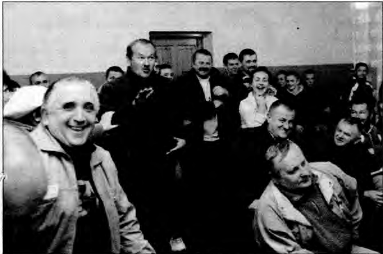
Mieszkańcy miejscowości, które nie zostały przyłączone do miasta, nie ukrywają swojej radości. Na zdjęciu mieszkańcy Hurka.

Mimo negatywnej opinii MSWiA w sprawie poszerzenia Przemyśla, władze miasta do końca wierzyły, że wicepremier Schetyna poprze przemyski wniosek. Tak się nie stało.