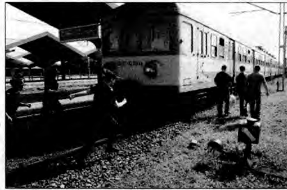
– Trzej dobrze zbudowani mężczyźni zbiegają z peronu na tory. Jak spod ziemi pojawiają się trzy funkcjonariuszki SOK.