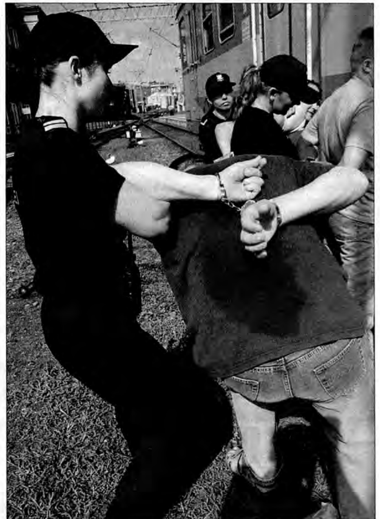
Unieszkodliwionych odprowadzają w kierunku dworca.