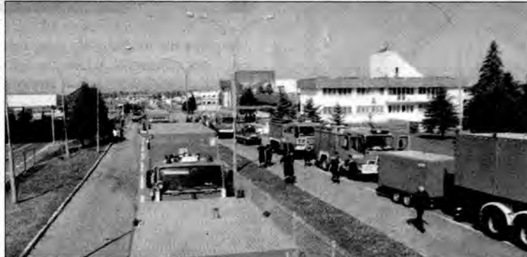
Strażacki konwój w drodze na Ukrainę.

Jak podało ukraińskie ministerstwo ds. sytuacji nadzwyczajnych, wskutek powodzi życie straciło ponad 30 osób. Ewakuowano około 15 tysięcy ludzi. Straty materialne są ogromne. Klęska nawiedziła 767 miejscowości w obwodach: iwano-frankowskim, lwowskim, zakarpackim, tarnopolskim i czerniowieckim.