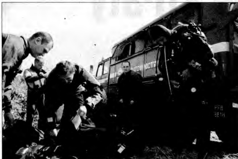
W akcji poszukiwawczej wzięli udział pletwonurkowie z Przemyśla, Sanoka i Brzozowa.