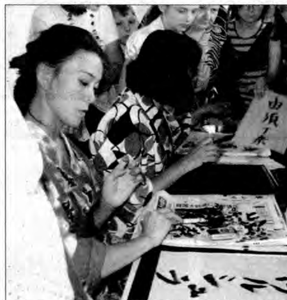
Pokaz sztuki kaligrafii.

Festiwal odbył się 3 sierpnia na dziedzińcu Zamku w Krasiczynie. Był okazją do zapoznania się z bogatą tradycją mieszkańców Kraju Wschodzącego Słońca. Dla melomanów przygotowano występy muzyków grających na tradycyj-