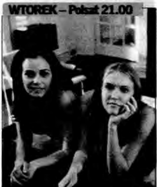
Przyjaciółka na śmierć i życie - thriller, USA 2002, reż. Zoe Clarke-Williams. Młody szeryf ma przeprowadzić śledztwo na prestiżowym uniwersytecie w Północnej Karolinie. Jedną ze studentek w niejasnych okolicznościach przedawkowała narkotyki i nieprzytomna leży w szpitalu.

Materiał informacyjny, internetowy oraz zdjęcia zostały dostarczone przez A plus C. Oprac. MZ.