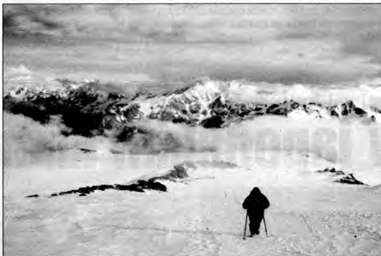
Droga na Elbrus była niezwykle ciężka. atak szczytowy trwał 7 godzin.

plecakami szliśmy niemal non stop przez trzy dni. Nie korzystaliśmy z opcji, jak niektórzy wygodni, aby wyjechać ratnikami na pewną wysokość i dopiero stamtąd atakować szczyt. Pierwszy nocleg w namiotach mieliśmy obok tak zwanych bezek. To takie niby schroniska zrobione z wielkich cystern po paliwie, w których wycięte są tylko małe otwory na okno i drzwi. Następnego dnia nocowaliśmy już na Prijucie, na wysokości 4100 metrów. Popsuła się nam pogoda. W nocy była burza z piorunami, śnieżycą. Ostatni dzień to podejście na Skały Pastuchowa na wysokości 4600 metrów i atak szczytowy. Zaczęliśmy go o godzinie 3 w nocy tamtejszego czasu. W Polsce była wówczas 1 w nocy. Okazało się, że dwóch naszych kolegów czuje się bardzo kiep-