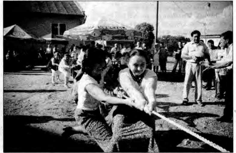
Zawody w przeciąganiu liny. Waleczne pikuliczanki w przeciwstawie do mężczyzn mocowały się długo i zawzięcie.