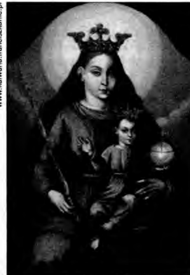
Sanktuarium kalwaryjskie to także miejsce w którym, wraz z kultem Męki Pańskiej w klasztornej kościele odbiera swój kult cudowny obraz Matki Bożej Kalwaryjskiej.

W czasie odpustu całonocny dyżur pełnić będzie załoga karetki