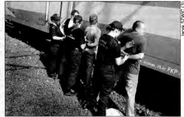
Chwila szamotaniny. Funkcjonariuszki obezwładniają podejrzanych i zakuwają ich w kajdanki.

Uwaga podróżujący pociągami. Nie zdziwcie się, jeżeli w czasie podróży, w wagonie lub na peronie zobaczycie dziewczynę w czarnym mundurze Straży Ochrony Kolei, uzbrojoną w pistolet, pałkę, gaz i kajdanki. Niech nie zwiedzie Was staranny makijaż i promienny uśmiech. Kiedy trzeba, funkcjonariuszka potrafi kilkoma chwytami obezwładnić awanturującego się pasażera, a w razie konieczności wie, jak użyć pałki albo nawet pistoletu.