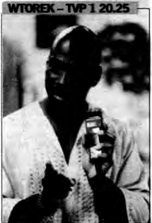
Cudotwórca - komedia, USA 1998, reż. Stephen Herek. Dyrektor telewizyjnego supermarketu Ricky Hayman jest w opałach. Ogłębłość jego programu spada, jeśli sytuacja nie poprawi się, straci pracę. W roli sprzedawcy zatrudnia czarnoskórego kandydata.