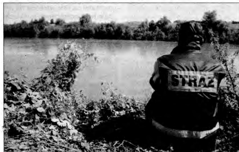
Strażacy mają nadzieję, że uda im się odnaleźć dwójkę młodych ludzi.