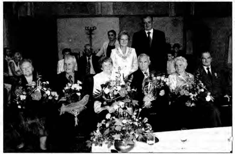
Pięć jarosławskich par małżeńskich obchodziło Złote Gody.

Pięć jarosławskich małżeństw obchodziło Złote Gody. Z tej okazji otrzymali medale przyznane przez prezydenta RP Lecha Kaczyńskiego.