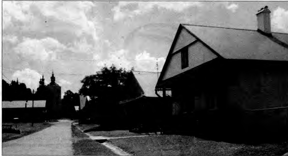
Na czas odpustu na drodze dojazdowej do klasztoru obowiązują ograniczenia w ruchu.

Na pełne wyżywienie można liczyć w stołówce Domu Pielgrzyma. Czynnym też będzie kilkadziesiąt