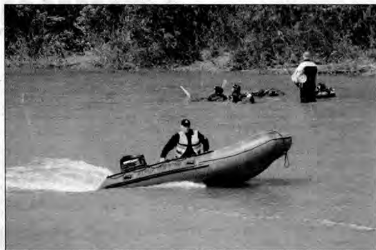
Poszukiwania zaginionych mężczyzn prowadzone są także przy użyciu pontonu i specjalnej kamery. Akcję wspierają strażacy z OSP z Ostrowa.

Poniedziałkowa akcja poszukiwawcza prowadzona przez strażaków i policjantów trwała do późnych godzin nocnych. Po kilku godzinach od zgłoszenia na wysokości Jarosławia udało się znaleźć jedynie kajak, którym płynęli młodzi mężczyźni. Gdy zapadł zmrok,