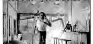
Con-Air – Lot skazańców – film sensacyjny, USA 1997, reż. Simon West.

Cameron Poe, były żołnierz zwolniony warunkowo z więzienia, wraca do domu. Niestety, ponownie wpada w tarapaty, gdy wsiada do samolotu pełnego przestępców, którzy opanowują maszynę.