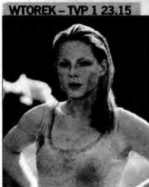
WTOREK – TVP 1 23.15 Ogień – film sensacyjny, Kanada/Rumunia/W. Brytania 2004, reż. Allan A. Goldstein.

Początkujący ratownik otrzymuje pierwsze zadanie. Musi pomóc grupie turystów, którzy podczas wycieczki rowerowej zapuścili się zbyt daleko w kalifornijskie lasy.