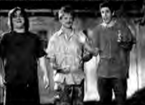
Twarda laska – komedia, USA/Australia 2001, reż. Dennis Dugan.

Darrena, Wayne'a i J.D. łączą przyjaźń, trudne dzieciństwo i miłość do piosenek Neila Diamonda. Wydawać by się mogło, że takiej więzi nie niszczy – nic prócz kobiety.