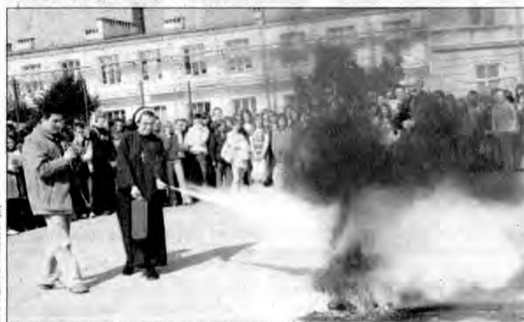
Po udanej akcji uczniowie i nauczyciele uczyli się obsługiwać gaśnicę, znajdującą się w ich szkole.

Dym wydobywający się z okien szkoły, uczniowie wyciągani z płonącego budynku przez okno, zablokowany przez wozy strażackie wjazd na ulicę Lisińskiego i policja pilnująca bezpieczeństwa ruchu – taki obrazek przechodzący w pobliżu Zespołu Szkół Licealnych i Technicznych im. Juliusza Słowackiego z przerażeniem obserwowali w miniony poniedziałek, 7 kwietnia.