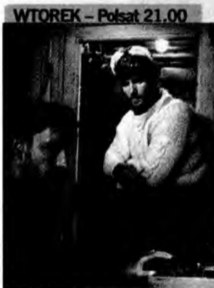
WTOREK – Polsat 21.00 U-571 – film wojenny, USA/Francja 2000, reż. Jonathan Mostow.

Początkujący ratownik otrzymuje pierwsze zadanie. Musi pomóc grupie turystów, którzy podczas wycieczki rowerowej zapuścili się zbyt daleko w kalifornijskie lasy.