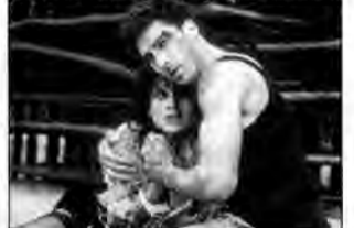
13. dzielnica – komedia sensacyjna, Francja 2004, reż. Pierre Morel

Paryż, 2013 r. Agent Damien Tomaso zostaje wysłany do odgrodzonej murem 13. dzielnicy. W getcie rządzonej przez gangsterów ma odzyskać sprawców kradzieży należących do rządu broni masowego rażenia.