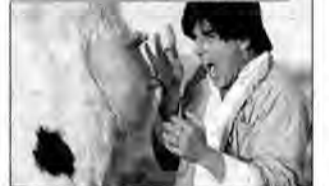
Kung Pow – Wejście Wybrańca – komedia sensacyjna, USA/Hongkong 2002, reż. Steve Oedeker.

Wykorzystująca cyfrowe efekty specjalne parodia azjatyckiego kina sensacyjnego o mistrzu wschodnich sztuk walki, który postanawia wymierzyć sprawiedliwość zabójcom rodziców.