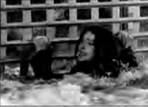
Morderca w deszczu – thriller, USA/Niemcy 1998, reż. Norberto Barba.

Padający od kilku dni ulewny deszcz powoduje zerwanie tamy. Sześcioro ludzi uwieczonych w zalany centrum handlowym walczy o życie nie tylko z rozszalałym żywiołem. Wśród nich jest morderca.