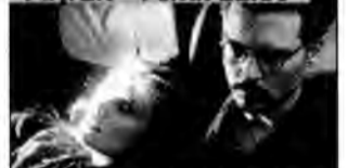
Dziwne wrota – thriller, Francja/USA/Hiszpania 1999, reż. Roman Polański.

Dean Corso jest nowojorskim bibliofilem i specjalizuje się w odnajdywaniu bezcennych starodruków. Pewnego dnia otrzymuje niezwykle złeczenie. Musi odnaleźć pewną tajemniczą księgę.