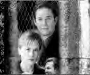
W imię sprawiedliwości – film obyczajowy, USA 1999, reż. Peter Levin.

Na kilka dni przed wykonaniem wyroku śmierci skazaniec prosi Connie i Jacka Murphych, rodziców ofiary, by wzięli pod opiekę jego nieletnią córkę, która niebawem zostanie sierotą.