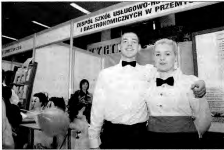
Stoisko Zespołu Szkół Usługowo-Hotelarskich i Gastronomicznych w Przemyślu.

Szkoły ponadgimnazjalne, poma-turalne, uczelnie wyższe oraz instytucje i pracodawcy wystawili swoje stoiska podczas Tagów Przemyskich „Edukacja. Praca. Kariera”, które odbyły się 4 kwietnia w hali POSiR.