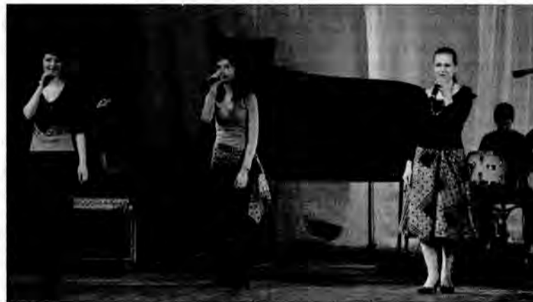
Zespół Ficco z Klubu Garnizonowego w Przemyślu.