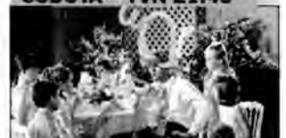
Polowanie na druhny – komedia, USA 2005, reż. David Dobkin.

Dwóch kolegów wolnego stanu zalicza w sezonie wszystkie okoliczne wesela, traktując to nie tylko jako świetną zabawę, ale także jako okazję do uwodzenia co ładniejszych panien.