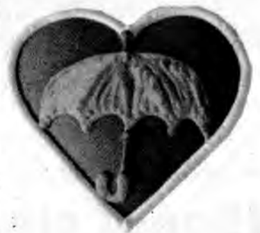
Serce z piernika z logo programu „Bezpieczny Jarosław” trafi do każdego przedszkolaka, który będzie uczestniczył w szkoleniu z zakresu pierwszej pomocy.

Na zakończenie szkolenia każde dziecko otrzyma pamiątkowe ser-