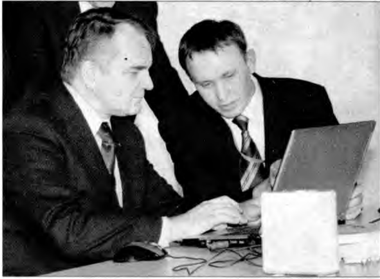
Wicepremier Waldemar Pawlak zalogował się na stronie www.lubaczow.pl, dokonując symbolicznego otwarcia sieci.

W ubiegły piątek (4 marca) w Lubaczowie wicepremier Waldemar Pawlak dokonał symbolicznego otwarcia bezpłatnej, szerokopasmowej sieci internetowej dostępnej dla mieszkańców powiatu lubaczowskiego.