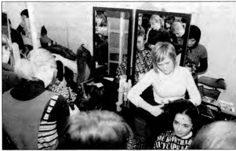
Uczennice szkoły fryzjerskiej i kosmetycznej Centrum Edukacji Baza prezentowały swoje umiejętności.