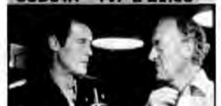
Ucieczka na Atenę – film wojenny, Wielka Brytania 1979, reż. George Pan Cosmatos.

Grupa jeńców próbuje uciec z niemieckiego obozu znajdującego się na jednej z greckich wysp. Ich celem jest nie tylko odzyskanie wolności, ale zdobycie bezcennych dzieł sztuki ukrytych w klasztorze.