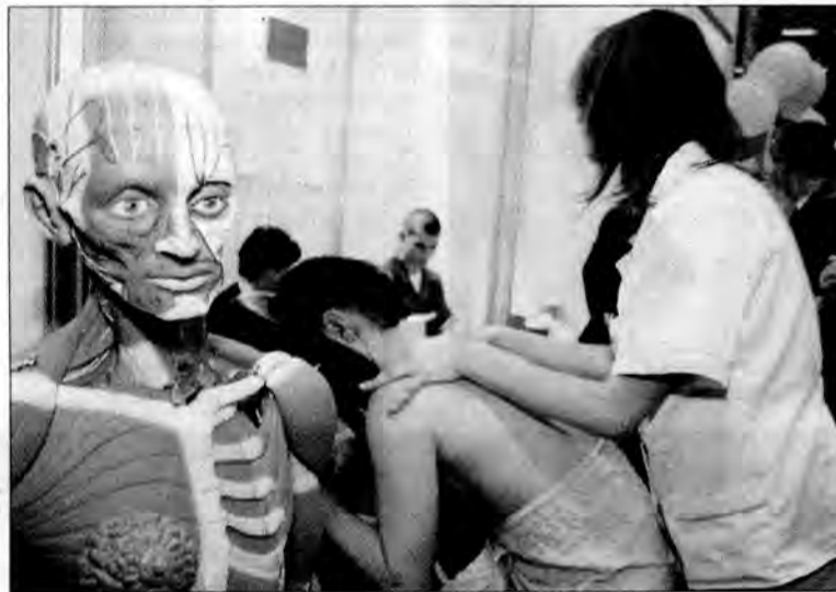
Sztuka masażu w wykonaniu słuchaczy Policealnego Studium Medycznego.