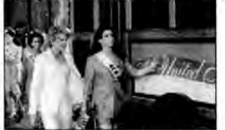
Miss Agent – komedia sensacyjna, USA 2000, reż. Donald Petrie.

Przed finałem konkursu Miss Ameryki morderca, ukrywający się pod pseudonimem Obywatel, informuje organizatorów, że podłożył bombę. Agentka FBI ma wziąć udział w konkursie i udaremnić zamach.