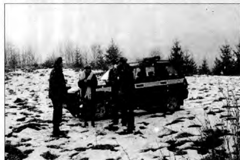
Tuż po zatrzymaniu pierwszej grupy Mołdawian.