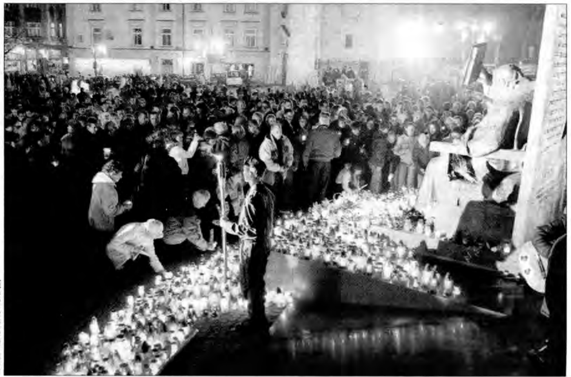
Pod pomnikiem Jana Pawła II na placu Niepodległości zgromadziło się około 3 tys. osób.

– Pytanie „A kaj ta Polska?” dzisiaj wydaje się jak najbardziej zasadne. Wczoraj (1 kwietnia) przedstawiciele narodu, także Podkarpacia, do których 11 lat temu Jan Paweł II wołał w Krośnie o pielegnowanie chrześcijańskiego pozdrowienia „Niech będzie pochwalony Jezus Chrystus”, omamieni blichtrzem karocy, wsiadli do niej i ruszyli w drogę. Przez lasy, jakieś betonowe, bezduszne miasta ku nieznanej przyszłości. Podobno ten pierwszy (w domyśle prezydent RP) podpisywał traktat, nie wiedząc, o czym on jest. A jeszcze dzień przed głosowaniem, cze-