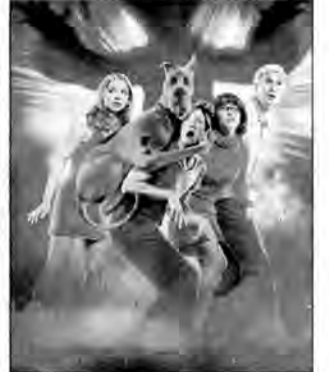
Scooby-Doo – film przygodowy, USA 2002, reż. Raja Gosnell.

Czwórka przyjaciół: Fred, Daphne, Velma i Shaggy oraz ich pies – Scooby-Doo, otrzymują zaproszenie na Wyspę Strachów. Właściciel tego kurortu podejrzewa, że dzieje się tam rzeczy nadprzyrodzone.