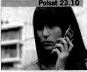
Nieodebrane połączenie – horror, Japonia 2003, reż. Takashi Miike.

Yoko otrzymuje dziwną wiadomość głosową wysłaną z jej własnego telefonu w niedalekiej przyszłości. Nagranie stanowi dźwiękowy zapis tragicznej śmierci Yoko.