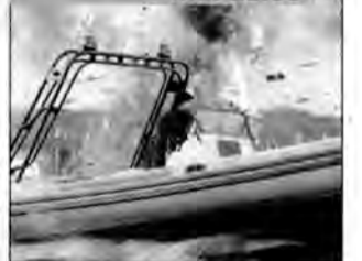
XXX II: Następny poziom – film sensacyjny, USA 2005, reż. Lee Tamahori.

Tylko dwóch ludzi może ocalić życie prezydenta Ameryki. Jednym z nich jest rządowy agent, drugim – odsiadujący wyrok żołnierz jednostki specjalnej.