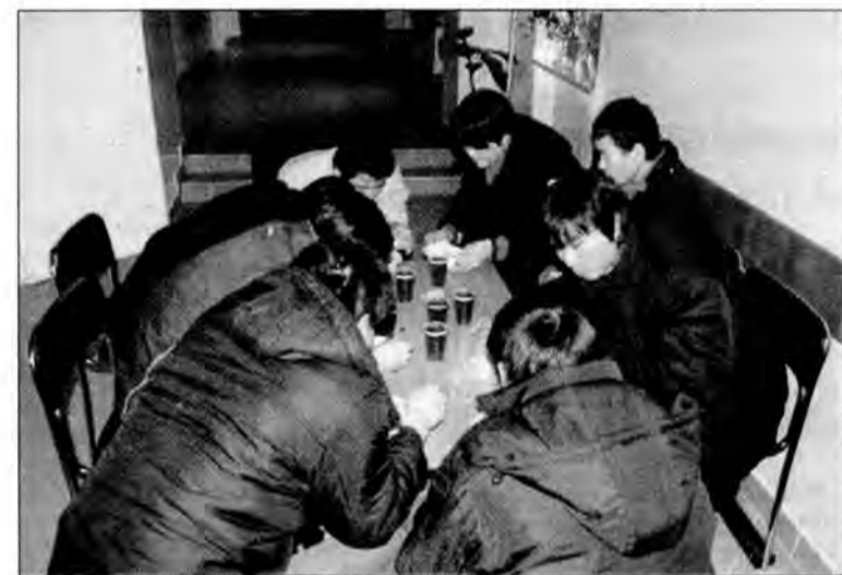
Wietnamczycy po zatrzymaniu posilają się na strażnicy.

JAROSŁAW: Przez telefon możesz zarejestrować się w wydziale komunikacji