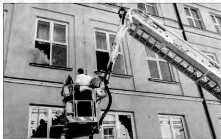
Ewakuacja uczniów, którzy nie zdążyli wyjść z klasy na drugim piętrze, wyglądała naprawdę groźnie.