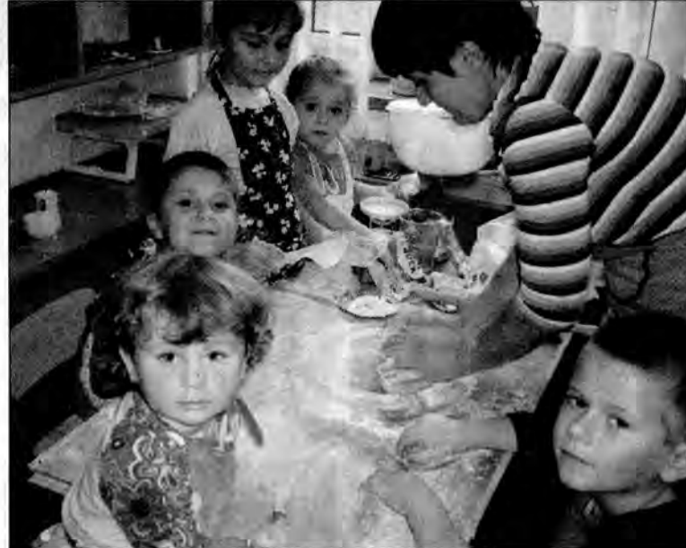
Przedszkolaki z Łopuszki Małej.

Najwięcej, bo trzynaście przedszkoli, jest usytuowanych w gminie Zarzecze. Siedem znajduje