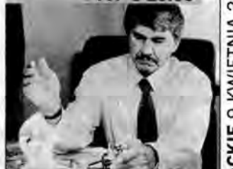
Życzenie śmierci IV – film sensacyjny, USA 1987, reż. Jack Lee Thompson.

Dalsze losy architekta Kerseya, który wypowiedział wojnę światu przestępczemu. Kiedy córka przyjaciół umiera po przedawkowaniu narkotyków, Kersey rusza samotnie w bój z handlarzami.