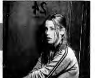
Moja najgorsza przyjaciółka – komedia romantyczna, USA 2000, reż. Irene Turner.

Casey i Grace są współlokatorkami w akademiku. Kiedy wskutek zachowania Casey zagrożony zostaje ślub Grace, ta poprzysięga przyjaciółce zemstę. Zaczyna spotykać się z chłopakiem Casey, Joeyem.