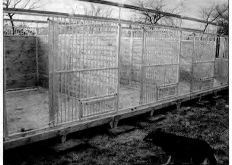
Schronisko w Orzechowcach wciąż zarządzane jest przez „Sarę”, ale czy „Sara” jeszcze istnieje?

SMS-y. Też bym chciała, żeby stowarzyszenie się odrodziło i działało dalej, a wiary w to za wiele nie