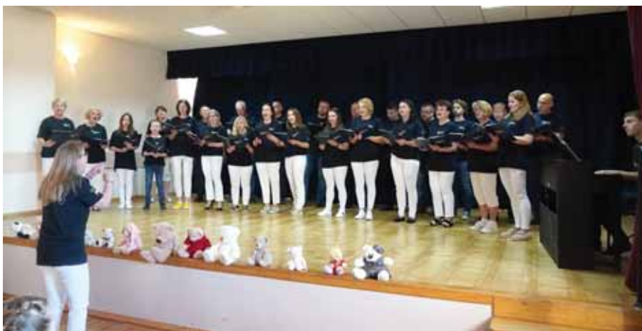
Chór „Gaudeamus” z Dąbrowy.