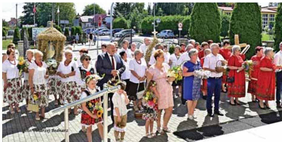
Delegacje z wieńcami dożynkowymi przed wejściem do kościoła.

Wzorem lat ubiegłych, trzy misternie wykonane wieńce dożynkowe, zawierające symbole religijne, przygotowali: Akcja Katolicka, Koło Gospodyń Wiejskich oraz mieszkańcy przysiółka Czekaj. Tradycyjnie przed wejściem głównym do kościoła, delegacje z wieńcami, zostały powitane przez