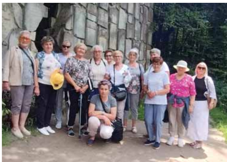
Uczestnicy Gminnego Klubu Seniora w Trzcie w Muzeum Etnograficznym – Guciów oraz Ściana Płacz.