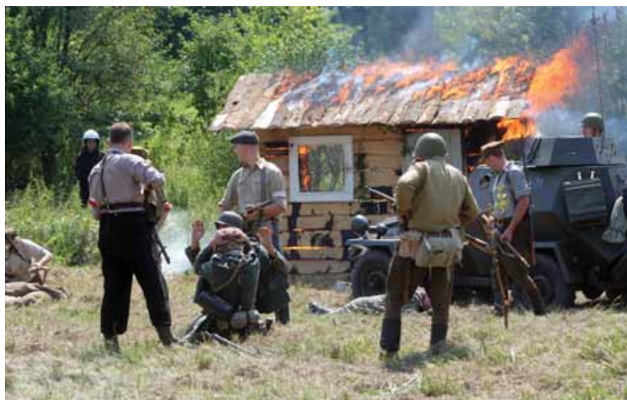
2014 Rekonstrukcja Akcji Burza w Bratkowicach.