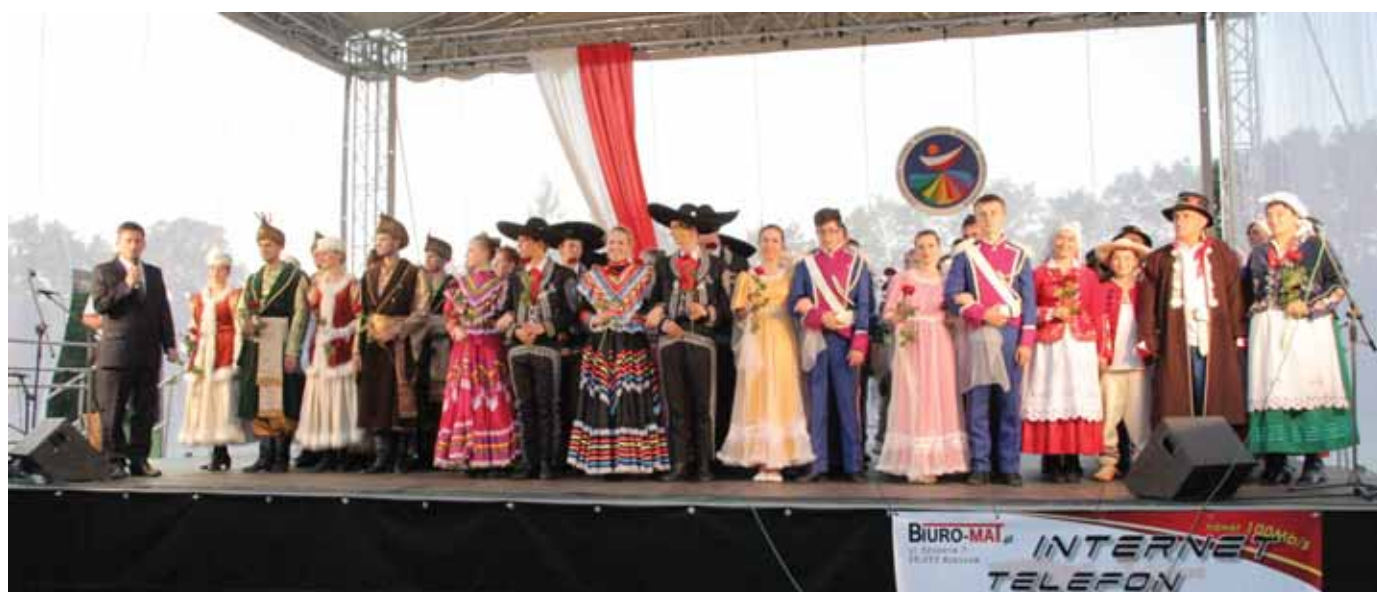
2014 Światowy Festiwal Polonijnych Zespołów Folklorystycznych – koncert w Szwajcarii.