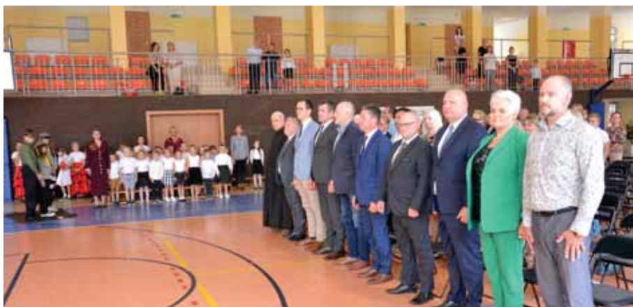
Podczas odśpiewania Hymnu Państwowego.

Dyrektor krótko przypomniał historię września 1939r. Wrzesień to miesiąc cudownego babiego lata, kwitnących wrzosów, dojrzewających kasztanów i spotkań z przyjaciółmi po wakacyjnej rozłące. Pierwszy września to także ważna data z innego względu. Tego dnia, w 1939 roku, atakiem hitlerowskich Niemiec na polską placówkę na Westerplatte rozpoczęła się II wojna światowa. Najstraszniejsza wojna w historii Polski i całego świata trwała 6 lat i pochłonęła ponad 50 milionów istnień ludzkich. Należy pamiętać, że w tych ciężkich czasach polska młodzież nie przerwała nauki, chociaż groziła im za to kara śmierci. W wyniku hitlerowskiego terroru zamordowano w latach 1939-1945 ponad dwa miliony dzieci i młodzieży w wieku do 18 lat. Około 20 tysięcy okupant wywiózł z Polski w celach germanizacyjnych na obszar Trzeciej Rzeszy. Druga wojna światowa zakończyła się w Europie 8 maja 1945 roku. Niemcy zostały pokonane. Polscy żołnierze odbierali kapitulację nieprzyjaciela na jego własnej ziemi. Radość tych, którzy przeżyli była wielka. Towarzyszyły jej jednak