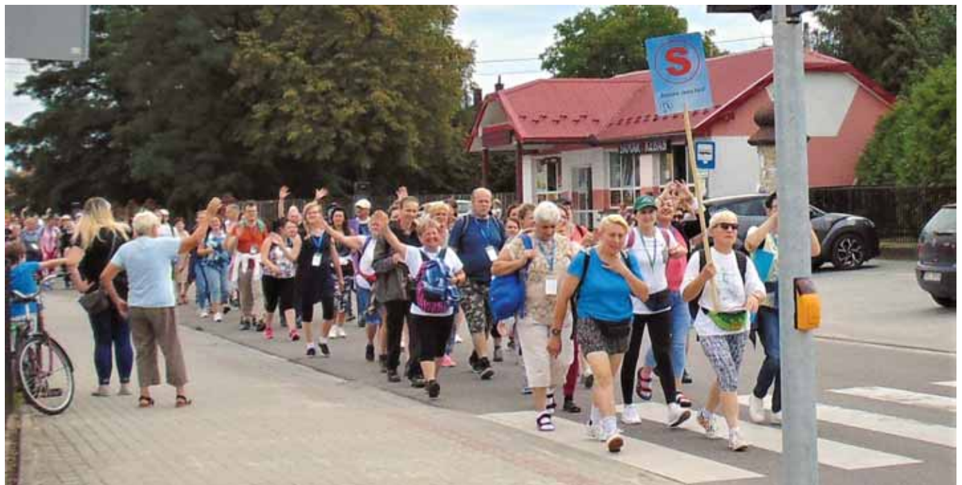
Pielgrzymi byli serdecznie witani i pozdrawiani przez mieszkańców Bratkowic.