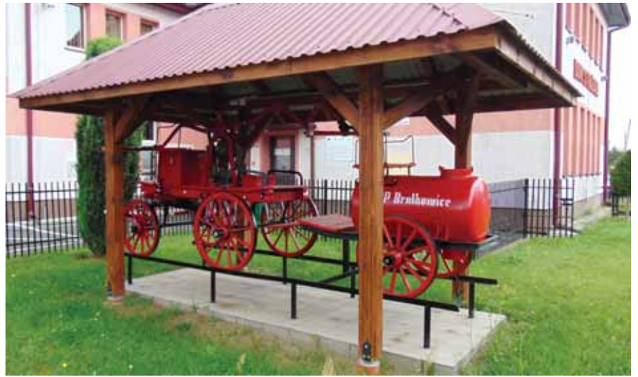
Odnowiona sikawka prezentuje się doskonale na tle Domu Strażaka.

W czerwcu 2023 r. strażacy, wykonali gruntowną renowację zabytkowej sikawki z przełomu XIX/XX wieku, wyprodukowanej przez firmę „Hydropol-Lwów”. Sikawkę tę zamontowaną na czterokołowym podwoziu konnym, wyremontowano i odnowiono po raz pierwszy w lipcu 2010 r. Następnie wyeksponowano ją na placu przed Domem Strażaka od strony zachodniej. W kolejnych latach w miarę potrzeby przeprowadzono renowację sikawki, poprzez jej konserwację i pomalowanie itp. Tak odnawiana co pewien czas zabytkowa sikawka, stała pod gołym niebem przez 12 lat (do lipca 2022 r. Nic więc dziwnego, że przez ten okres zmienne warunki atmosferyczne (deszcz, śnieg, mróz), spowodowały znaczne uszkodzenia niektórych drewnianych elementów sikawki. W lipcu 2022 r. Zarząd OSP, mając na uwadze odpowiednie zabezpieczenie sikawki przed ewentualnym zniszczeniem, podjął decyzję o budowie drewnianej wiaty zadaszonej. Natomiast postanowienie o gruntownej renowacji sikawki wraz z beczkowo-