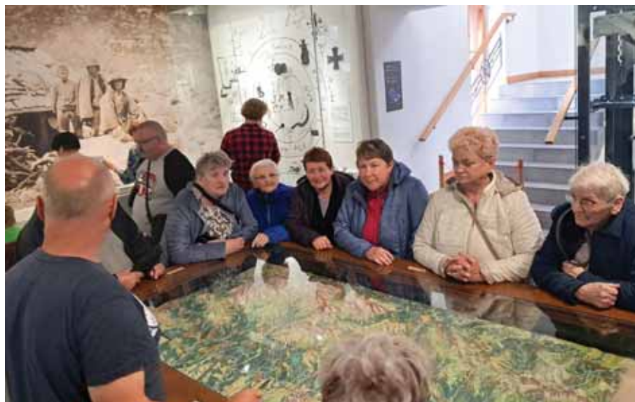
Uczestnicy Dziennego Domu Pomocy w Bratkowicach na Rynku Głównym w Krakowie oraz w Muzeum Tatrzańskim na Krupówkach.