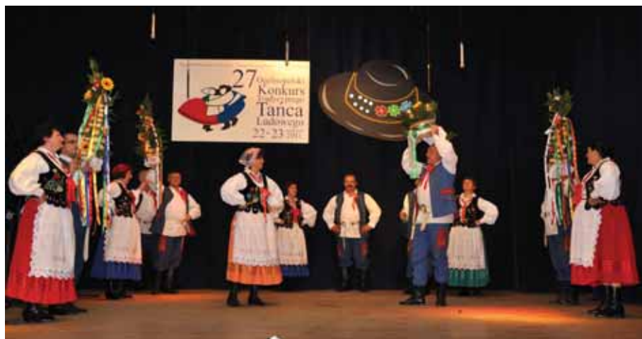
2011 Ogólnopolski Konkurs Tradycyjnego Tańca Ludowego w Trzcianie.

cji Rolnictwa Ekologicznego. Organizowano także konkursy we współpracy z placówkami oświatowymi – ekologiczne, sztuki recytatorskiej, plastyczne. W latach 2011 i 2014 przygotowano rekonstrukcję Akcji Burza, mającej miejsce także na terenie Bratkowic. W latach 2012, 2015 i 2016 przygotowywano w Świlczy Misterium Męki Pańskiej. Poza wydarzenia-