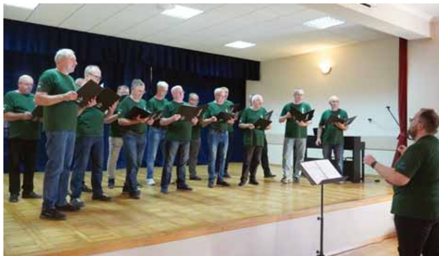
Chór „Resonantae” z Bratkowic.

udział w koncercie. Celem konkursu było przypomnienie i utrwalenie najważniejszych informacji i ciekawostek z życia poszczególnych chórów, a także wspólna zabawa przy zaangażowaniu całej widowni. Pytania