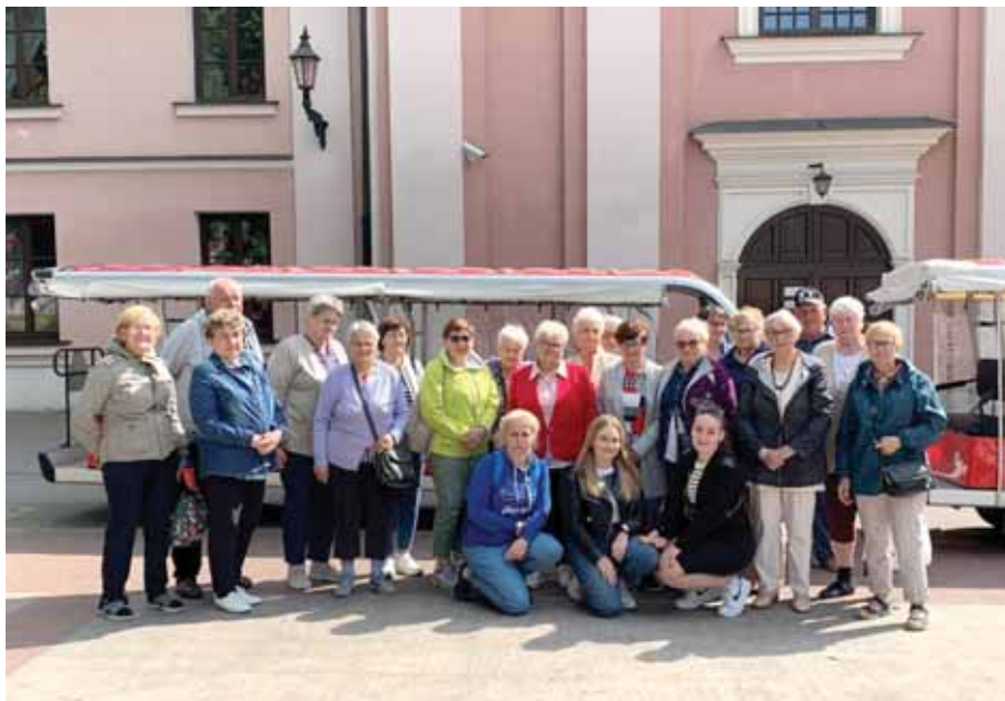
■ Uczestnicy Gminnego Klubu Seniora w Trzcie – wycieczka do Zamościa.

To wszystko jest możliwe dzięki dofinansowaniu Gminnego Ośrodka Pomocy Społecznej w Świlczy środkami z Regionalnego Programu Operacyjnego Województwa Podkarpackiego na lata 2014-2020, współfinansowanego ze środków Europejskiego Funduszu Społecznego, budżetu państwa oraz środków własnych. Warto poszerzać takie działania, aby seniorzy mogli w pełni cieszyć się życiem.