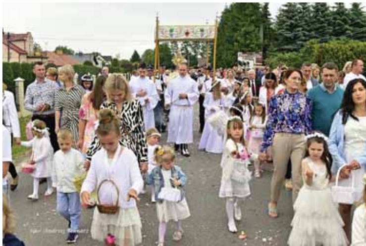
Dziewczynki posypujące drogę płatkami kwiatów.

Na zakończenie procesji przy ostatnim ołtarzu, ks. kan. Józef Książek – proboszcz, pobłogosławił wszystkich uczestników procesji. Podziękował im również za wspólną modlitwę oraz za zaangażowanie w przygotowanie okazałych ołtarzy, dając w ten sposób publiczne świadectwo wiary.