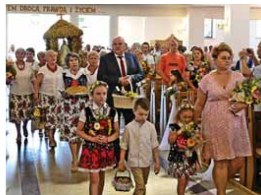
Grupa wieńcowa Akcji Katolickiej.