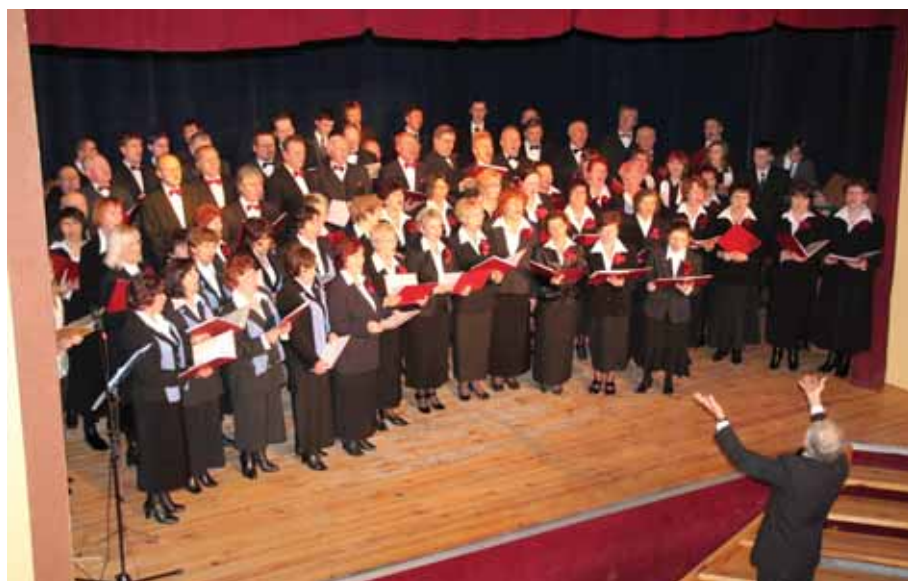
2011 I Międzygminny Przegląd Kolęd i Pastorałek w Trzcianie.

W roku 2011 zapoczątkowano dwa wydarzenia, które później stały się cykliczne – Przegląd Kolęd i Pastorałek, który potem otrzymał nazwę „Dzieciątko się narodziło” oraz Konkurs Pieśni Maryjnej „Matuchnie Pieśń niesiemy”, który od kilku lat rozgrywany jest w formie przeglądu. Kontynuowano także już wcześniej rozpoczęte tradycje – współorganizację Ogólnopolskiego Konkursu Tradycyjnego Tańca Ludowego, Podkarpackiego Forum Lokalnej Prasy Samorządowej czy Podkarpackiej Konferen-