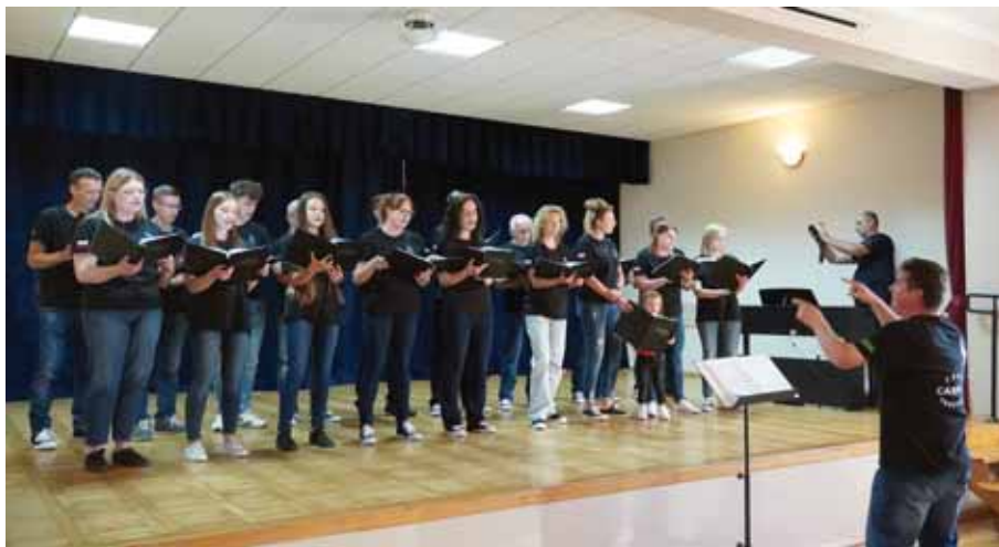
Chór „Cantus” Trzciana.