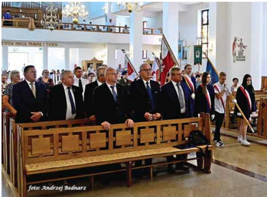
Zaproszeni goście podczas Mszy św.

celebrowana była uroczysta Msza św.: O szczęście wieczne dla poległych w akcji „Burza” i walczących o wolność Polski pochodzących z Bratkowic oraz o pomyślność Ojczyzny.