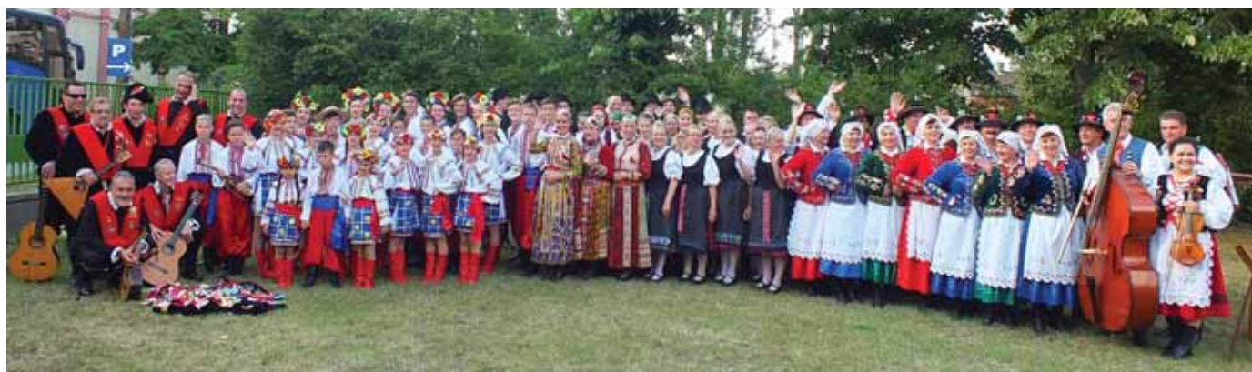
2016 Wyjazd Grupy Obrzędowej na festiwal w Budapeszcie.

go: 25 000 zł, całkowita kwota projektu: 45 657,60 zł.