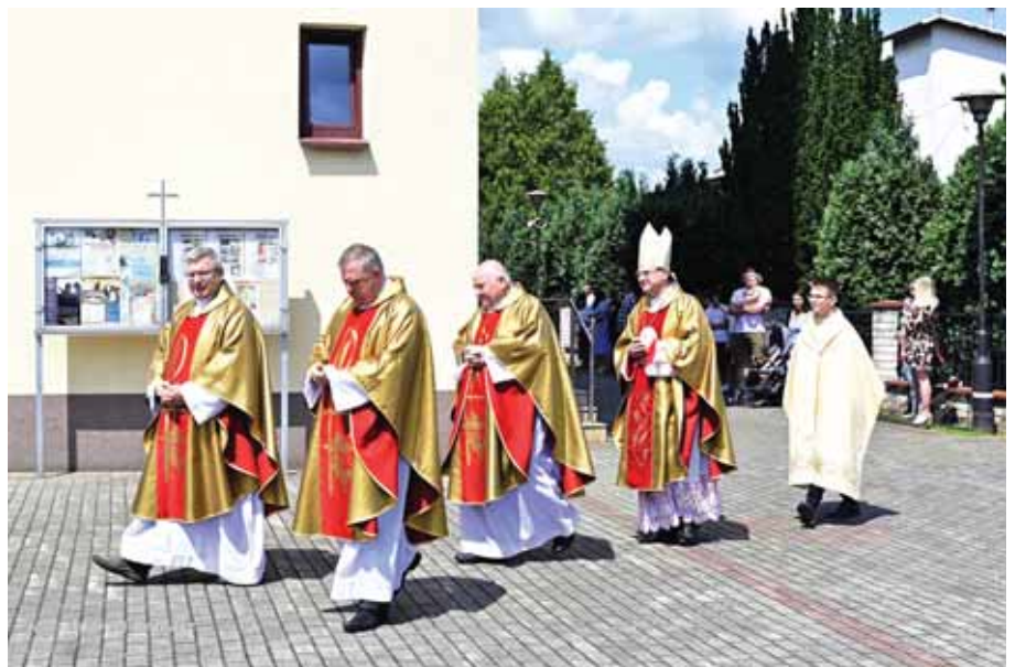
Ks. biskup i księża uczestniczący w procesji odpustowej.

Podczas Mszy św. ks. biskup dokonał uroczystego poświęcenia dwóch nowych konfesjonaliów. We