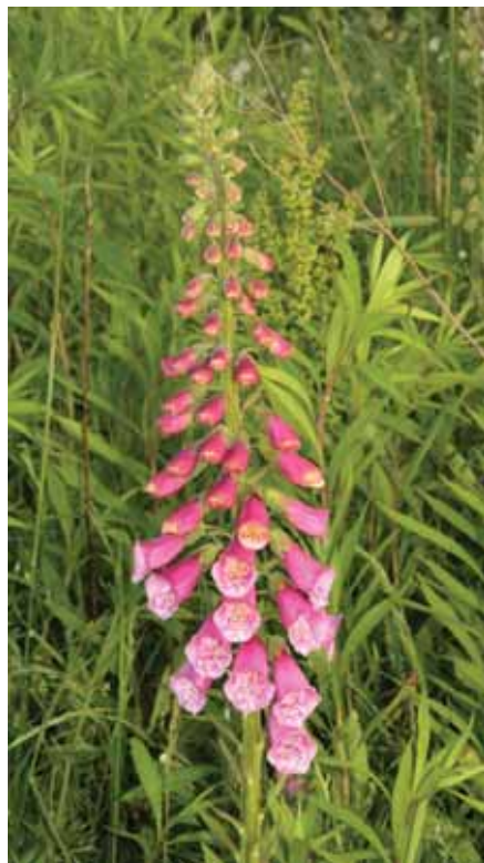
Naparstnica purpurowa – ozdobna roślina uprawna i dziczka. Zawiera alkaloidy nasercowe.

Na koniec zachodzi pytanie czy toksyczne alkaloidy pirolizydynowe wytwarzane przez rośliny mogą znaleźć się w produktach pozyskiwanych od