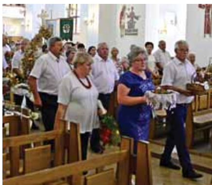
Delegacja mieszkańców Czekała z wieńcem dożynkowym.