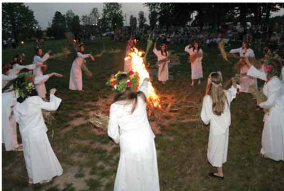
2012 Sobótki w Bratkowicach.