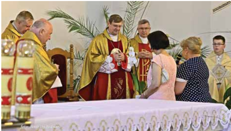
Parafianki podziękowały ks. biskupowi za wspólną modlitwę i poświęcenie konfesonaliów.

Tradycyjnie, jak co roku, podczas uroczystości odpustowej w bratkowickiej parafii, nie zabrakło licznych kramów odpustowych, zlokalizowa-