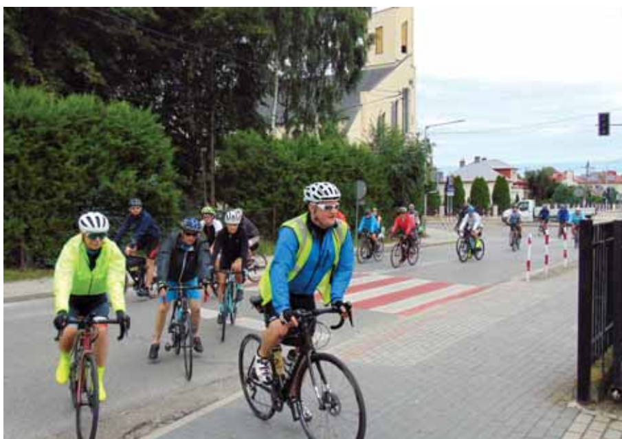
Pierwsza grupa pielgrzymów dotarła do Bratkowic.