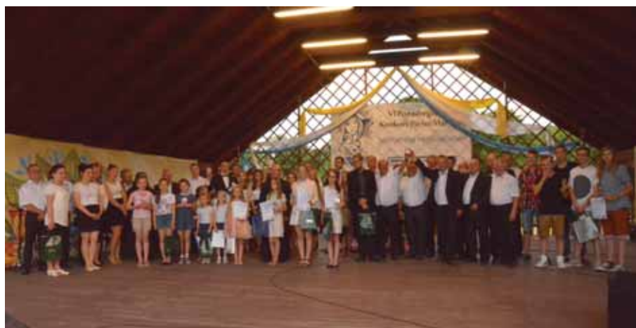
2016 Konkurs Pieśni Maryjnej w Mrowli.