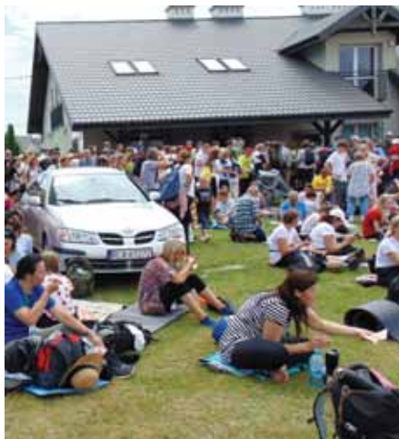
Pielgrzymi podczas posiłku i odpoczynku.