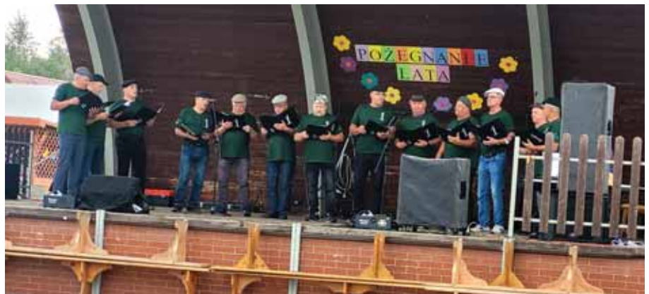
Piknik „Pożegnanie lata”.

W czasie pikniku organizowanego przez Towarzystwo Miłośników Ziemi Bratkowickiej na „Pożegnanie lata” panowie wykonali na scenie stadionu sportowego swoje rozrywkowe utwo-