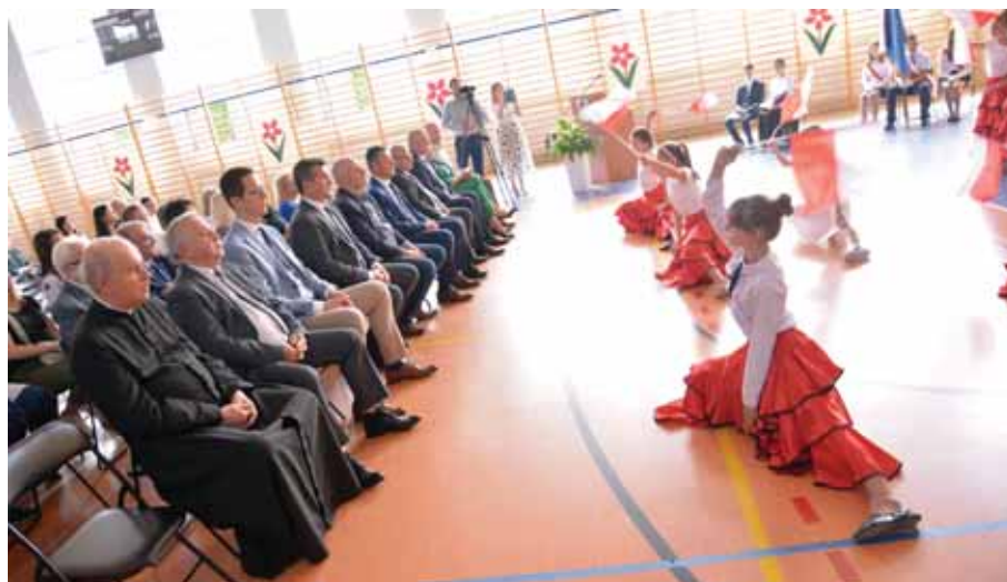
Krótką część artystyczną.

wały zgodnie z planowanym harmonogramem, wszystko po to by 1 września 2023 r. sześciolatki mogli rozpocząć naukę w nowym obiekcie. Kolejne słowa Dyrektor szkoły skierował do najmłodszych uczniów. Wskazał im plany na najbliższy czas – czas nowych wyzwań i nowych celów, bo to szkoła stawia przed nimi różne wyzwania, czasem łatwe, czasem trudniejsze. Ważne by umieć im stawić czoła. Tylko w ten sposób uczy-