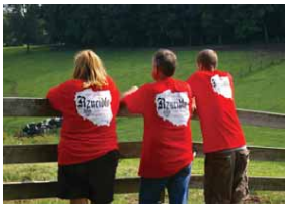
T-shirt z jubileuszowego 25. reunionu w 2014 r.