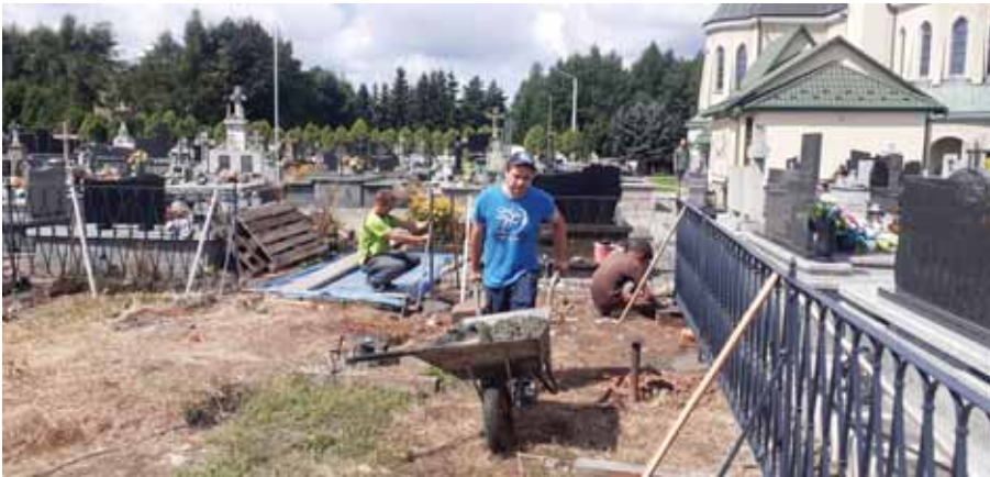
Montowanie odnowionego ogrodzenia grobowca Dąbskich.