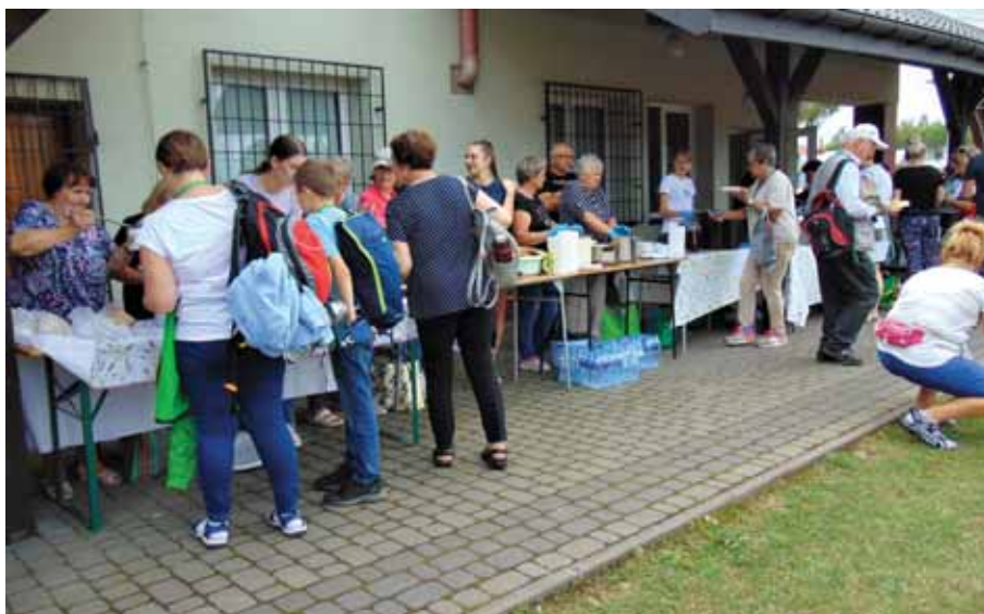
Gospodynie z Bratkowic przygotowały smaczne dania dla pielgrzymów.