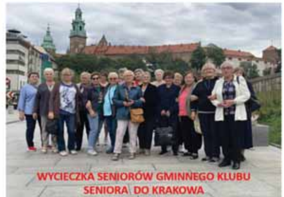
WYCIEZKA SENIORÓW GMINNEGO KLUBU SENIORA DO KRAKOWA