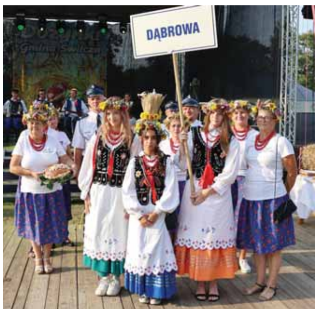
Sołectwo Dąbrowa prezentowało wieniec przygotowany przez KGW.