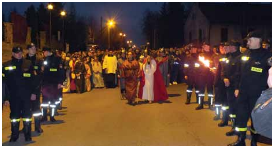
2015 Misterium Męki Pańskiej w Świlczy.