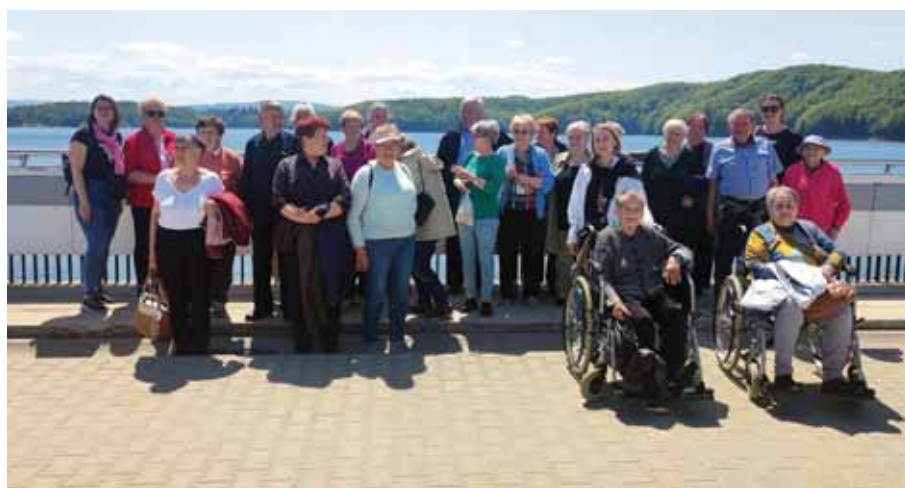
Uczestnicy Dziennego Domu Pomocy w Bratkowicach w Galerii Sztuki Polskiej w Sukiennicach, a także zwiedzają Sanktuarium Bożego Miłosierdzia w Łagiewnikach oraz nad zaporą wodną w Solinie.