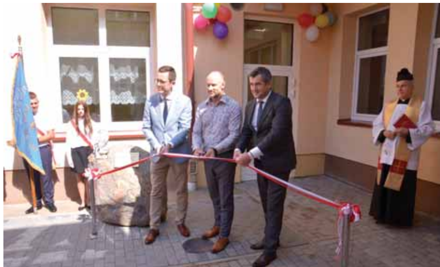
Uroczyste przecięcie wstęgi – otwarcie Oddziału Przedszkolnego.

Po części oficjalnej zaproszeni goście, rodzice, uczniowie zwiedzili sale nowego oddziału w szkole. Po pamiątkowych zdjęciach m.in. przy kamieniu upamiętniającym to wyda-