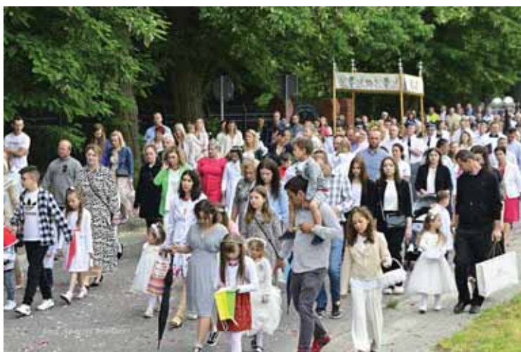
Parafianie podczas procesji Bożego Ciała.