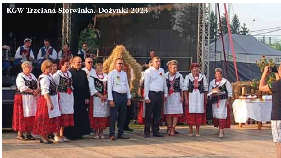
KGW Trzciana-Słotwinka. Dożynki 2023

– Jestem dumna, że zostawiam po sobie ślad mojej działalności i chronię to, co pozostawili po sobie nasi dziadkowie i pradiadkowie i czego uczyli nas nasi nauczyciele w szkołach. Kocham to co robię i w pełni