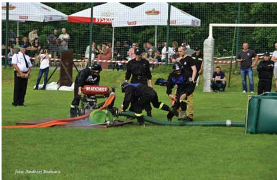
Strażacy z Bratkowic z impetem ruszyli do boju...

Pod czujnym okiem komisji sędziowskiej zawody sportowo-pożarnicze rozgrywały się w 3 konkurencjach: sztafecie pożarniczej 7x50 m, ćwiczeniu bojowym oraz mustrze. Zasady klasyfikacji końcowej sztafety i bojówki niezmiennie są od lat: na końcowy wynik składa się suma punktów uzyskana przez poszczególne jed-