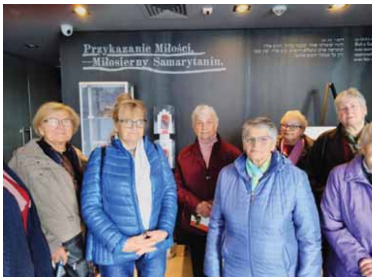
Uczestnicy Gminnego Klubu Seniora w Trzcie podczas rejsu statkiem oraz w Muzeum Ulmów.