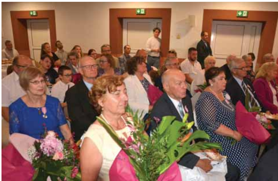
Na twarzach na przemian pojawiało się wzruszenie i uśmiech.

do trwałego, zgodnego i szczęśliwego związku małżeńskiego. Zatem medal trafia do zacnych i szanowanych mieszkańców naszej gminy. Wraz z okrągłym jubileuszem powróciły wspomnienia.