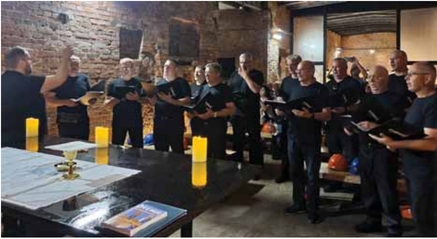
Koncert w kopalni Guido

Po zakończeniu warsztatów grupa udała się do Zabytkowej Kopalni GUIDO. O godzinie 10:00 wzięliśmy udział we mszy świętej w zabytkowej kaplicy św. Barbary na 170 poziomie