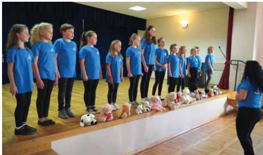
„Kantuski” z Trzciany.

W drugiej części wydarzenia zorganizowany został QUIZ na temat działalności Gminnego Centrum Kultury oraz chórów biorących