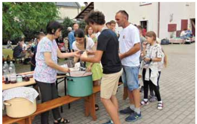
Gospodynie z Czekaja, przygotowały smaczny posiłek dla strudzonych drogą pielgrzymów.