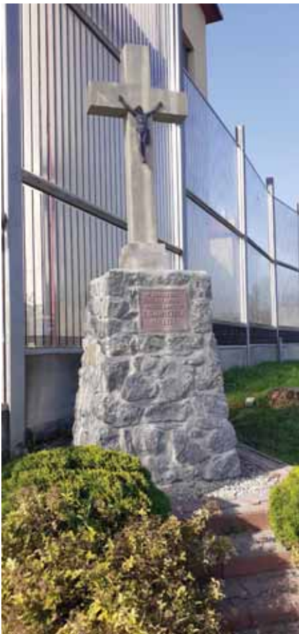
Odnowiony zabytkowy krzyż i pamiątkowa tablica.

tego w Świlczy. Zadanie to zostało wykonane w ramach Podkarpackiego Programu Odnowy Wsi na lata 2021-2025.