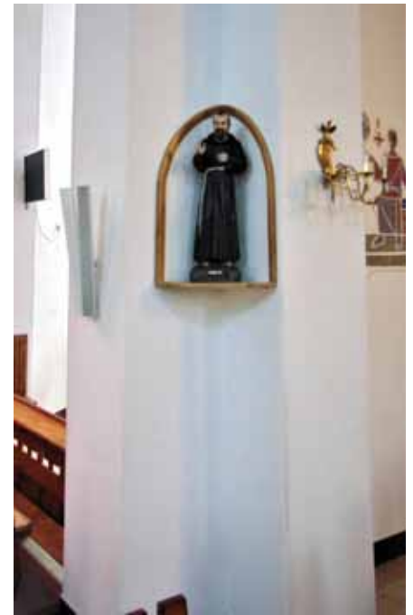
Figurka św. Ojca Pio już na nowej półce.