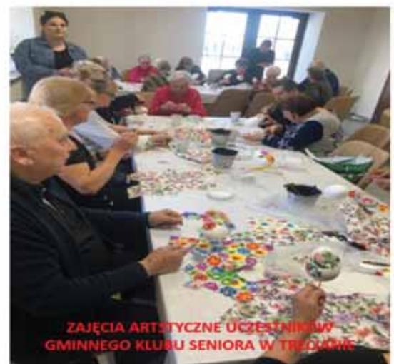
ZAJĘCIA ARTYSTYCZNE UCZESTNIKÓW GMINNEGO KLUBU SENIORA W TRZCIANIE

JEŚLI CZUJESZ SIĘ SAMOTNY LUB PO PROSTU CHCESZ WYJŚĆ Z DOMU I AKTYWNIIE ŻYĆ, TO WSTĄP W NASZE SZEREGI, CZEKAMY NA CIEBIE!!