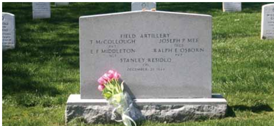
Miejsce wiecznego spoczynku kaprala Stanleja Rzucidło (Residlo) na wojskowym Cmentarzu Narodowym w Arlington.