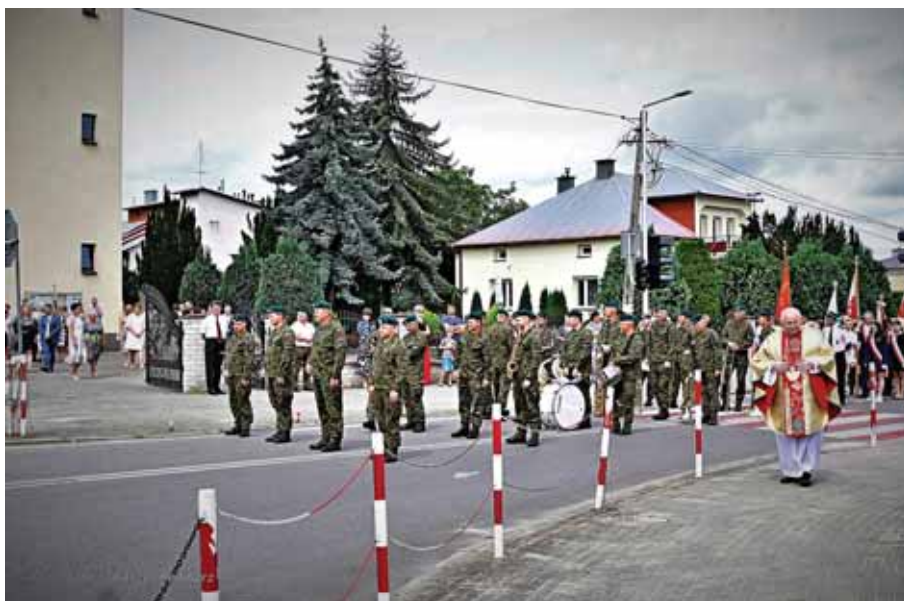
Po Mszy św. wszyscy udali się pod pomnik AK.