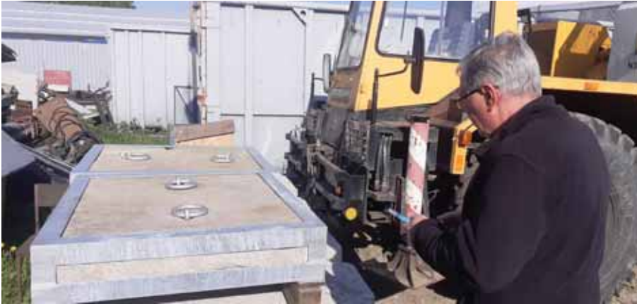
Nowe okucia na włazach do krypt grobowca rodziny Dąbskich.