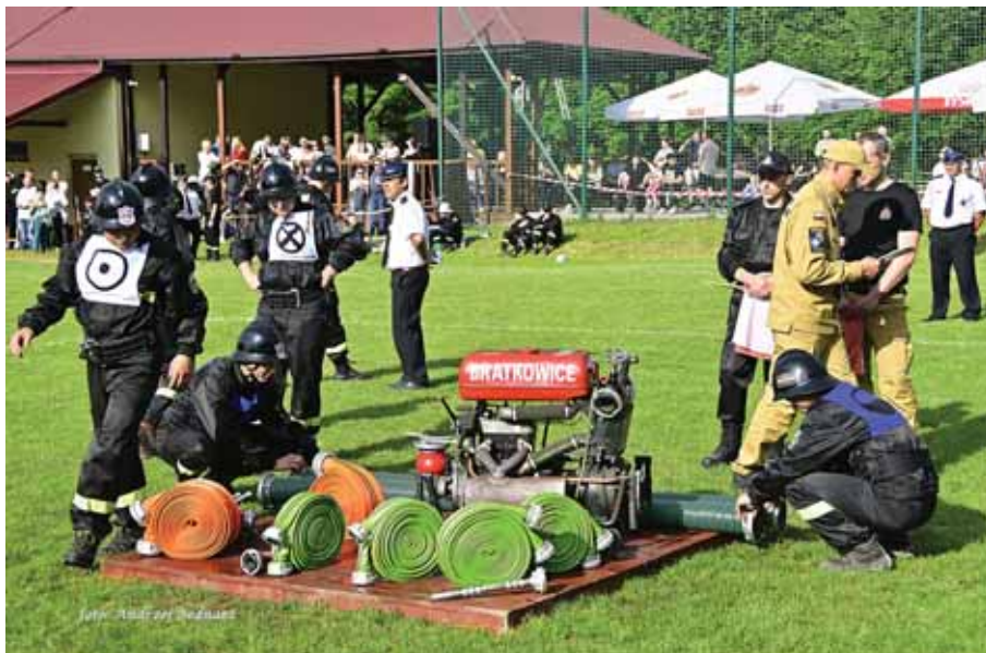
Druhowie bratkowickiej OSP, starannie przygotowali się do konkurencji ćwiczenie bojowe.

Warto podkreślić, że konkurencje wykonywane podczas zawodów są