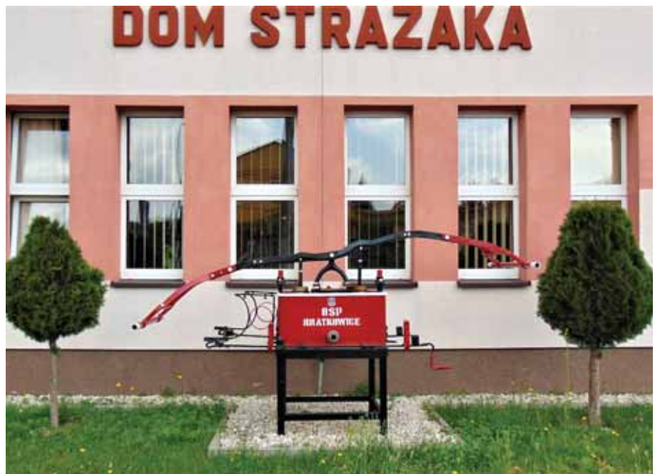
Druga odnowiona sikawka, wyeksponowana jest przed Domem Strażaka od strony południowej.

zentuje się teraz wyjątkowo okazale, wzbudzając zainteresowanie i podziw przechodniów. Po zapadnięciu zmroku, całość jest efektywnie podświetlona oświetleniem LED. Starannie odnowiona zabytkowa sikawka i zabezpieczona zadaszeniem, powinna przetrwać kolejne lata, przypominając o chlubnej historii bratkowickiej OSP.