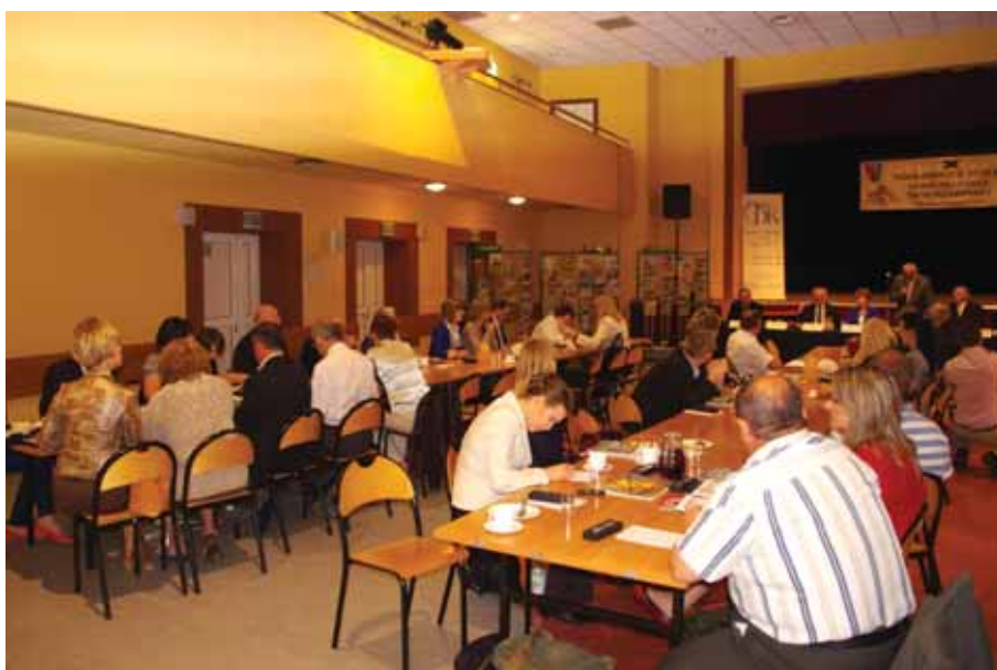
2013 Podkarpackie Forum Lokalnej Prasy Samorządowej w Trzcianie.