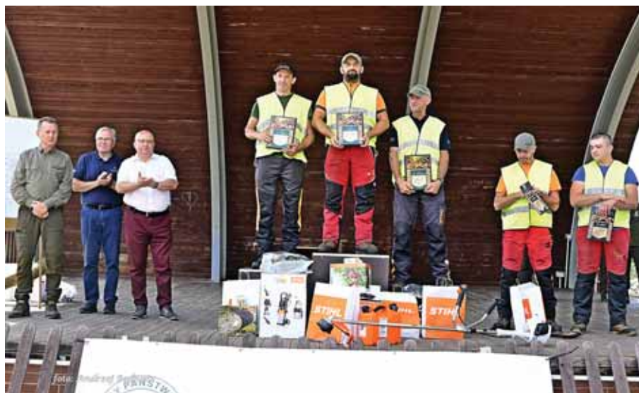
Na podium stanęli najlepsi.