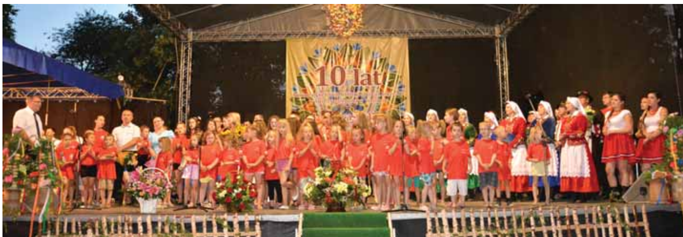
2015 Jubileusz Gminnego Centrum Kultury w Świlczy zs. w Trzcianie