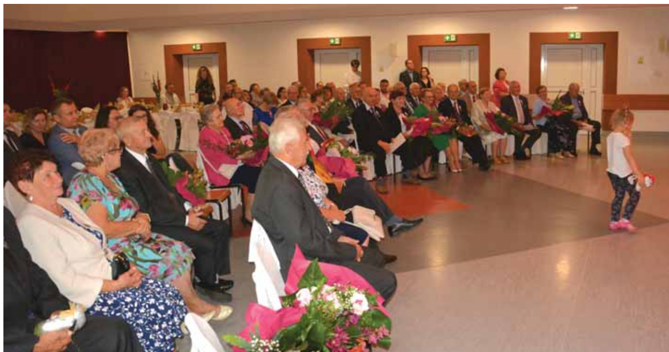
Dostojni Jubilaci w skupieniu słuchali przemawiających.