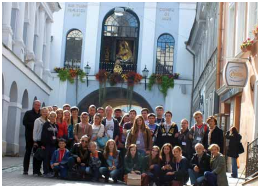
2013 Wyjazd Zespołu Pułanie i Kapeli Młoda Olsza do Wilna.

Był to czas małych podsumowań i snucia planów na przyszłość. Czas podziękowań dla Instruktorów i choreografów grup. Nie mogło też zabraknąć wyrazów wdzięczności darczyńcom, sponsorom i partnerom wydarzenia. Obecność na scenie wszystkich wykonawców podczas finału wywarła ogromne wrażenie, gdyż dała obraz ilości osób zaangażowanych w amatorski ruch artystyczny GCKSiR. W słowie skierowane do publiczności na zakończenie, Wójt Gmi-