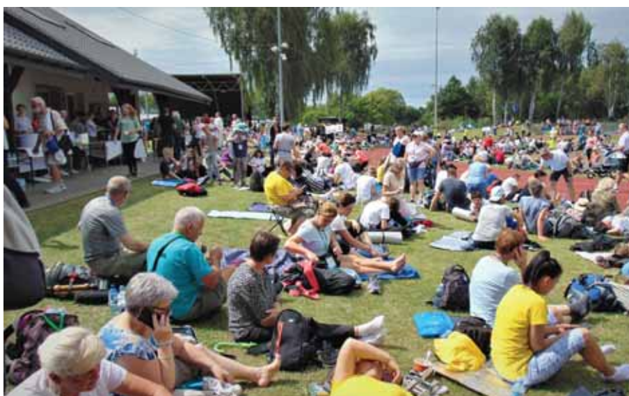
Niemal cały stadion wypełniony był pielgrzymami.