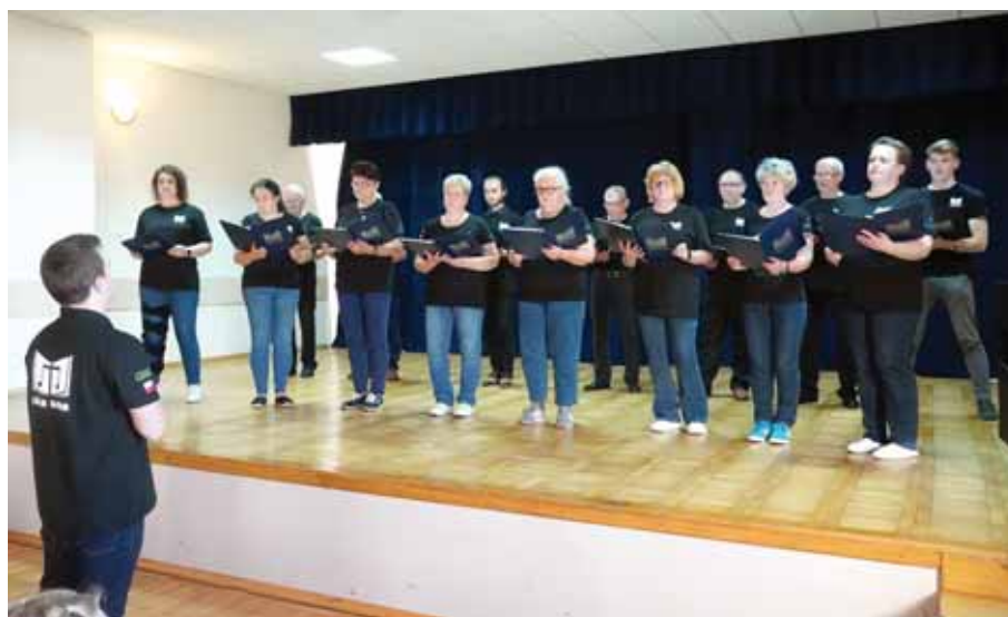
Chór „Gama” ze Świlczy.