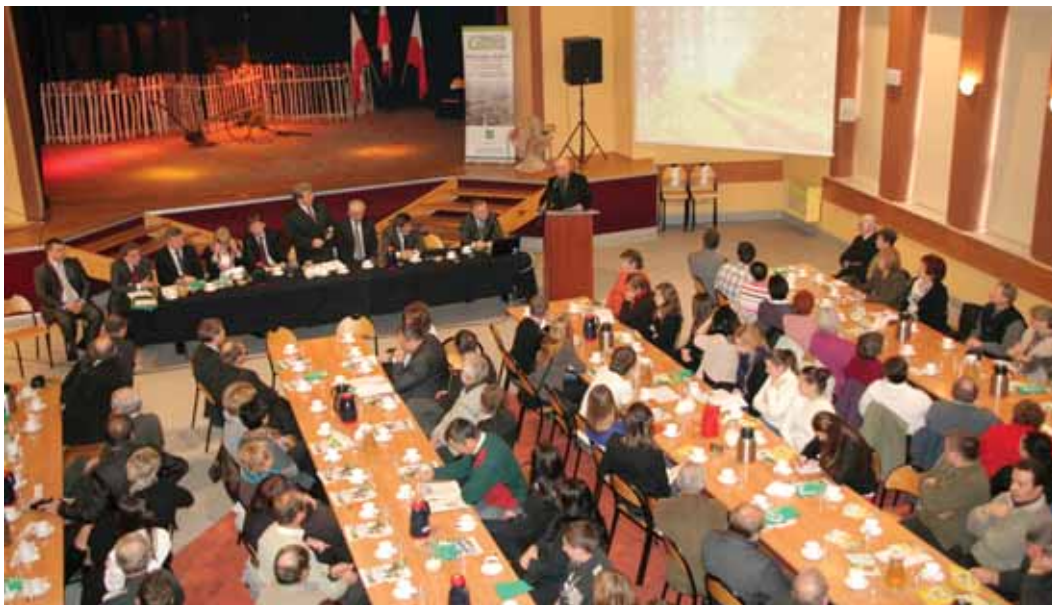
2011 Podkarpacka Konferencja Rolnictwa Ekologicznego w Trzcianie.

Niedzielny koncert galowy poprzedziła Msza Święta w kościele parafialnym w Trzcianie. Brali w niej udział nie tylko członkowie grup amatorskiego ruchu artystycznego GCKSiR, ale i góralskich zespołów: „Ślebodni” oraz „Lipniczanie”. Koncert Galowy miał na celu prezentację dorobku artystycznego GCKSiR, szczególnie ZPiT PUŁANIE. Na scenie zespołom towarzyszyły zaprzyjaźnione zespoły folklorystyczne – Zespół Regionalny „Lipniczanie” z Lipnicy