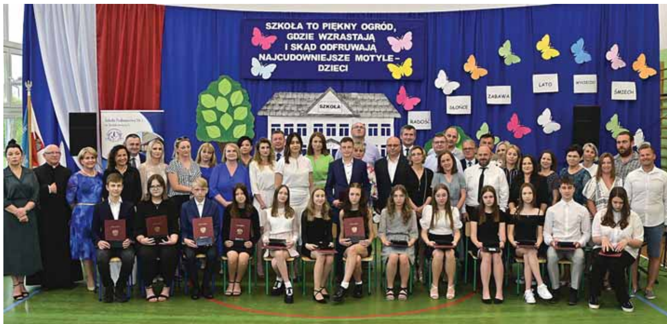
Laureaci „Pióra Wójta”.

Przed absolwentami szkół – wiele dróg, co w świat prowadzą