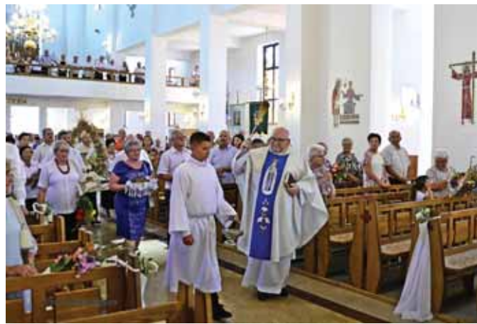
Uroczyste poświęcenie ziół i kwiatów.