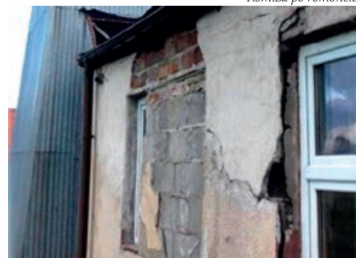
Remiza przed remontem