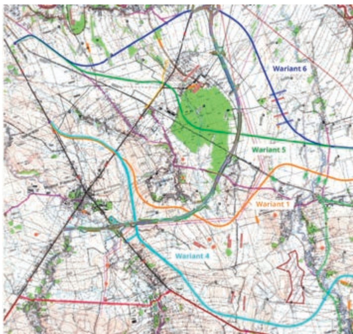
Mapa [1] z akcji informacyjnej z 13 czerwca 2022 r. Popierane przez Gminę warianty przebiegu obwodnicy W4 (kolor niebieski), W1 (kolor pomarańczowy) oraz wariant „podwariant społeczny południowy” (mapa 2)

nieczne jest wyprowadzenie ruchu tranzytowego poza centrum miejscowości na jej obrzeża oraz połączenie obwodnicy z drogą ekspresową S-19 za pomocą