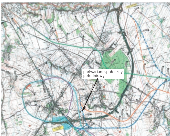
Mapa [2] z raportu po akcji informacyjnej z 4 listopada 2021 r.