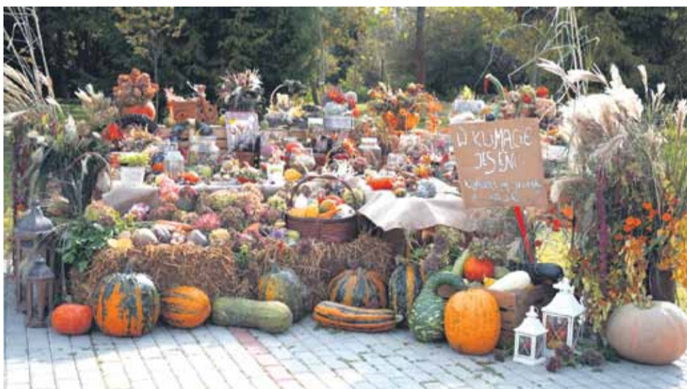
SONINA 7 października na stadionie w Soninie odbył się Piknik Pieczonego Ziemiaka, którego organizatorem był Zespół Szkolno-Przedszkolny w Soninie