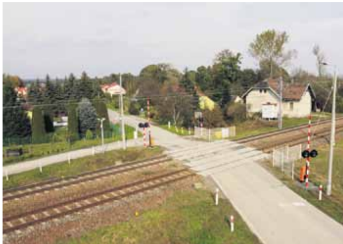
Stanowisko wójta, radnych gminy Łańcut i mieszkańców jest jasne, nie zaakceptujemy żadnych rozwiązań ograniczających dostępność komunikacyjną Głuchowa

Po spotkaniu z przedstawicielami firmy IDOM, wójt