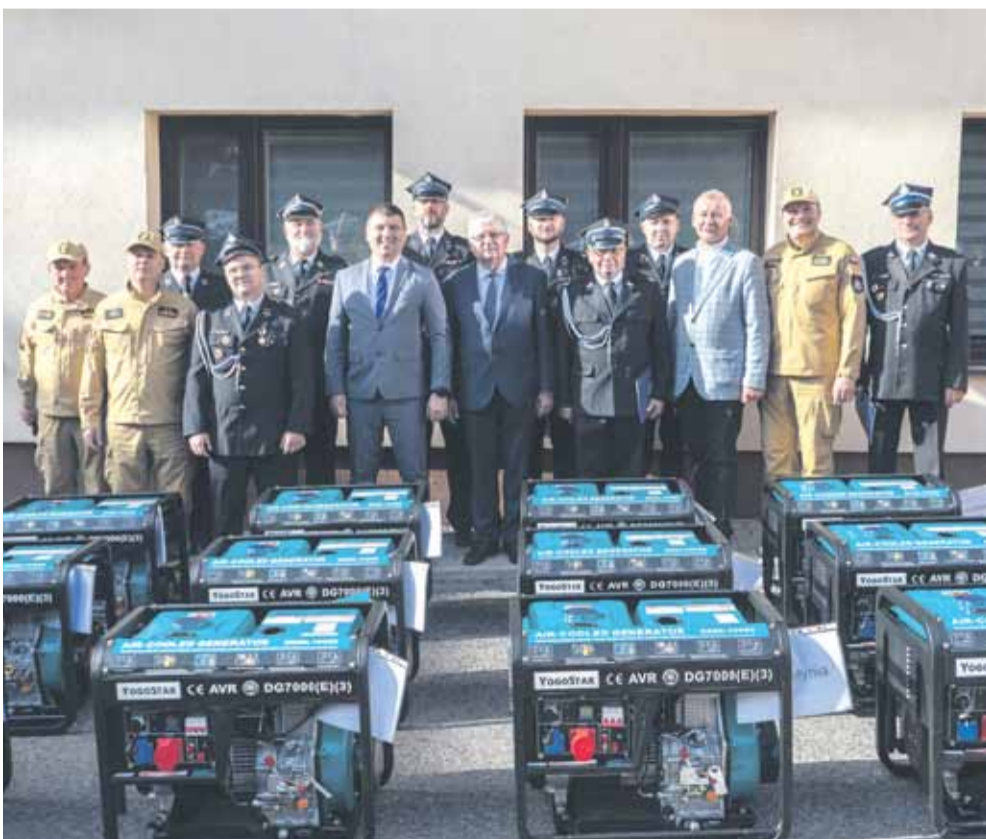
Agregaty dla jednostek z powiatu łańcutckiego i leżajskiego przekazano na placu Komendy Powiatowej Państwowej Straży Pożarnej w Łańcut

Nowe agregaty o mocy 7 kw, trafiły do ponad 200 jednostek z województwa podkarpackiego, które w pierwszych dniach wojny za naszą wschodnią granicą przekazały swoje agregaty na potrzeby Ukrainy. (iw)