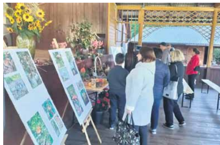
Całkowita wartość zadania to 25 212 zł, z czego 12 tys. zł to dofinansowanie z budżetu Województwa Podkarpackiego