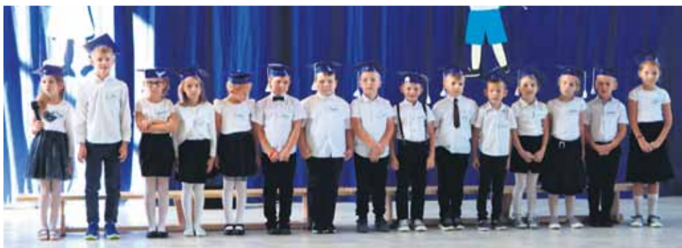
Pasowanie odbyło się na nowej sali gimnastycznej. Udział w uroczystości oprócz wójta, dyrektor szkoły wzięli także rodzice „pierwszaków” oraz drugoklasiści, którzy razem ze swoją wychowawczynią przygotowali krótki program artystyczny i prezenty dla swoich młodszych kolegów