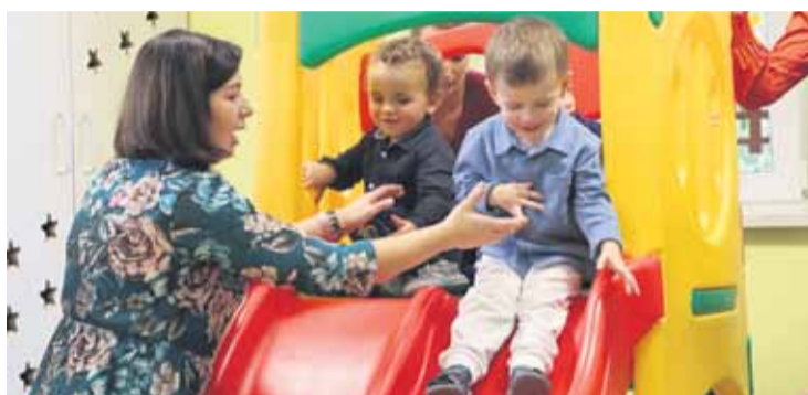
Żłobki funkcjonują w gminie od 2021 roku