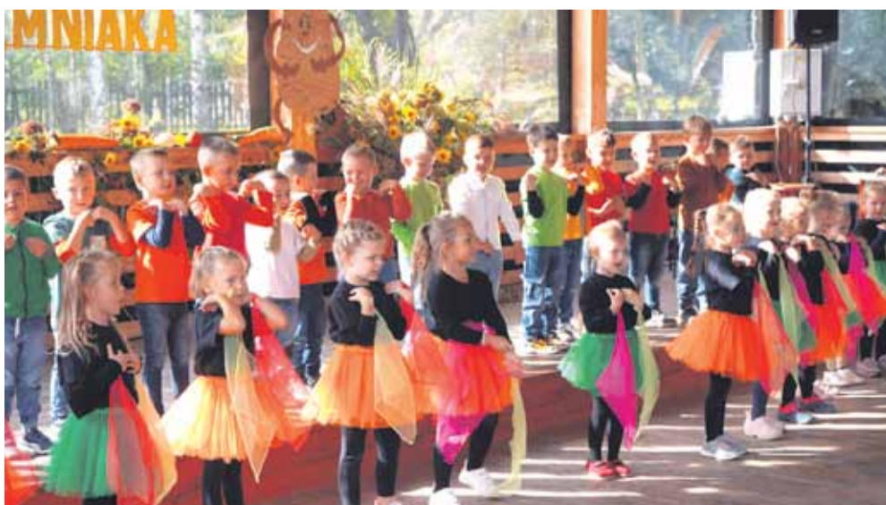
Wydarzenie było okazją do integracji mieszkańców, a szczególnie dzieci i ich rodziców