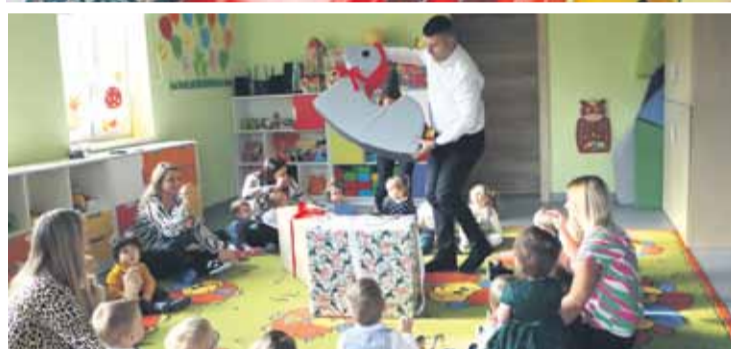
I cieszą się zainteresowaniem wśród mieszkańców