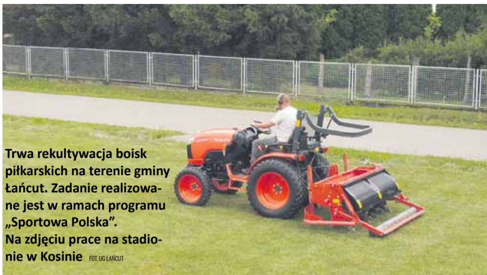
Trwa rekultywacja boisk piłkarskich na terenie gminy Łącut. Zadanie realizowane jest w ramach programu „Sportowa Polska”. Na zdjęciu prace na stadionie w Kosinie FOT. UG ŁĄCUT