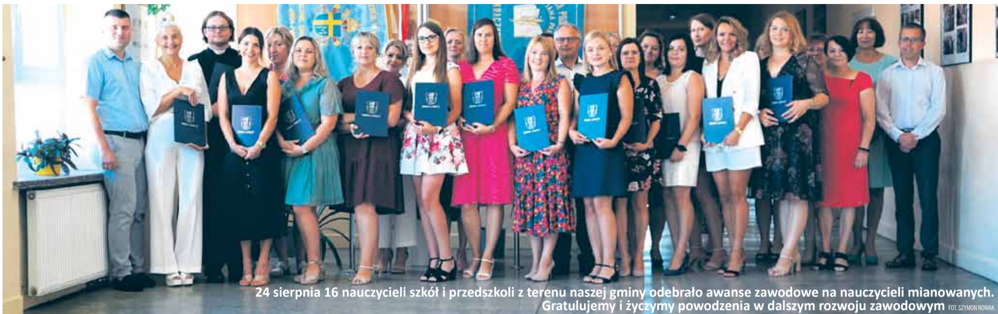
24 sierpnia 16 nauczycieli szkół i przedszkoli z terenu naszej gminy odebrało awanse zawodowe na nauczycieli mianowanych. Gratulujemy i życzymy powodzenia w dalszym rozwoju zawodowym

SONINA Postępy prac także przy budowie sali gimnastycznej przy Zespole Szkolno-Przedszkolnym w Soninie. Poziom zaawansowania robót aktualnie wynosi 30%. Planowany termin zakończenia prac to wiosna 2024 r.