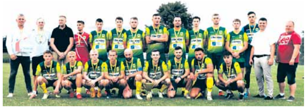
W tym roku najlepszą drużyną okazała się Kosina