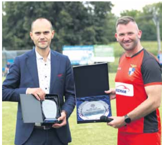
Turniej był połączony z XX-leciem działalności klubu Orzeł Wysoka