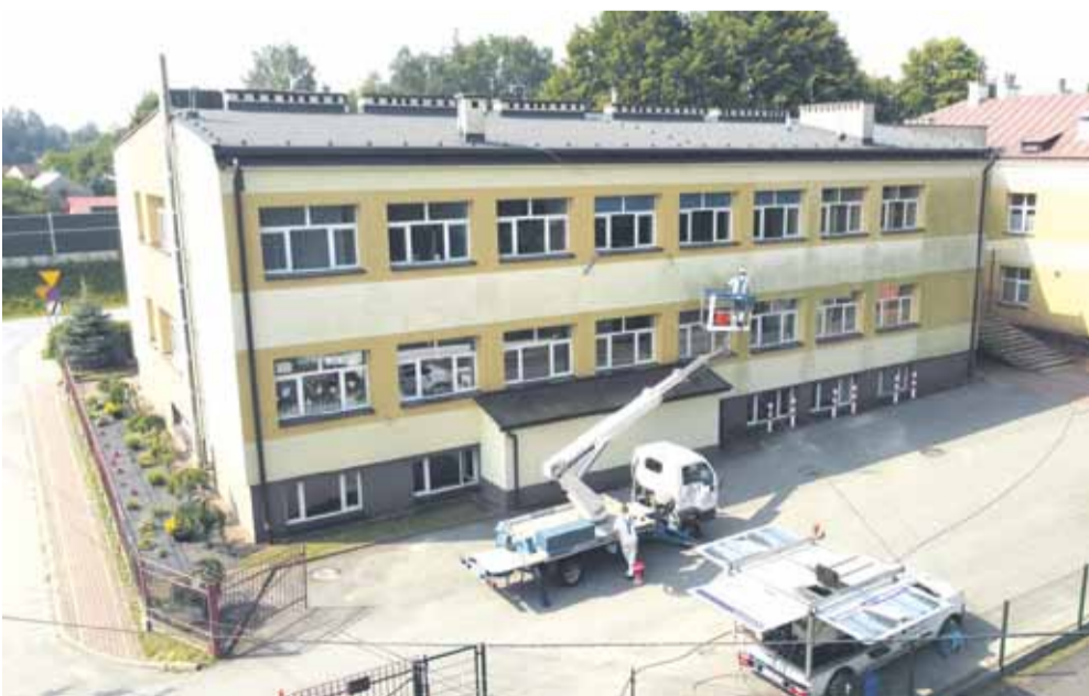
W trakcie prac

Wójt Gminy Łańcut, Zespół Szkolno-Przedszkolny w Albigowej, Centrum Kultury Gminy Łańcut zapraszają na: