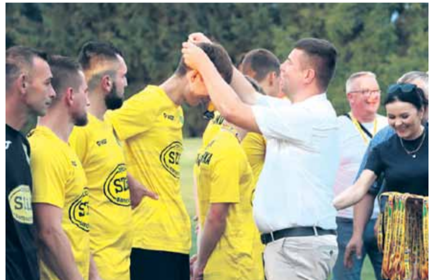
Piłkarze, którzy znaleźli się na podium otrzymali medale od wójta gminy