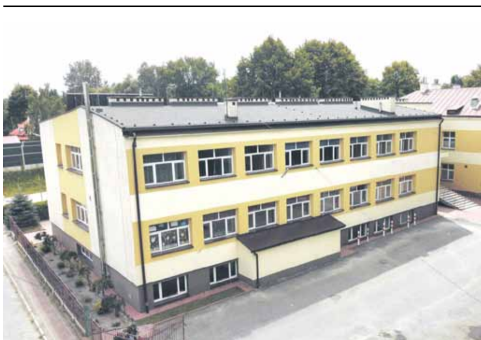
Tak prezentuje się wyczyszczona elewacja Zespołu Szkół w Głuchowie