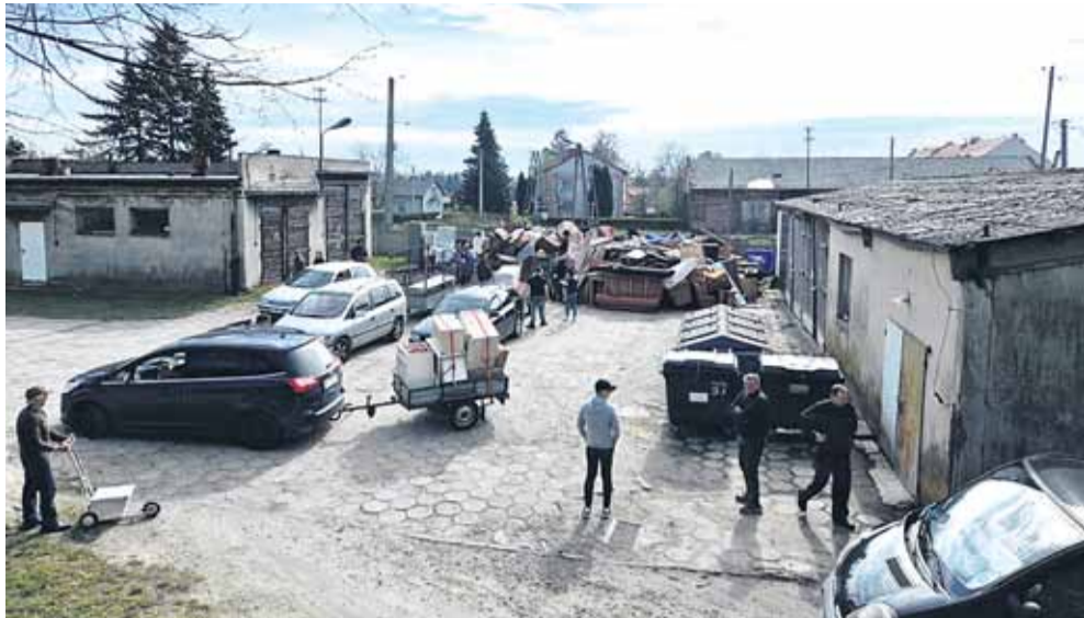
Zakończyła się zbiórka gabarytów oraz elektrośmieci. Mieszkańcy gminy mogli je oddać w kilku miejscowościach naszej gminy w marcu i kwietniu. W pozostałych miejscowościach zbiórka zaplanowana jest na jesień