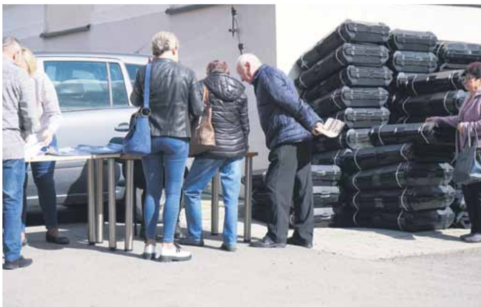
80% gospodarstw domowych gminy Łańcut kompostuje BIO-odpady. Jest to korzystne dla środowiska, obniża koszty systemu zagospodarowywania i odbioru odpadów, a co najważniejsze ma też wpływ na nasze portfele

Szczegółowe informacje można uzyskać w Urzędzie Gminy, Referacie Nieruchomości, Rolnictwa i Środowiska pok. nr 6 lub pod nr tel. 17-225-65-46.