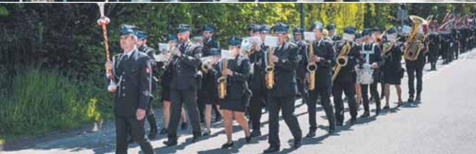
Po mszy św. odbył się uroczysty przemarsz pod Komendę PSP w Łańcutie, na czele z orkiestrą dętą z Husowa