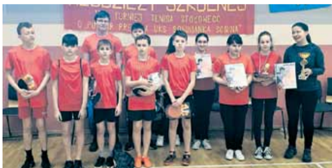
Puchar Prezesa UKS „Soninianka” w klasyfikacji zespołowej wywalczyła Szkoła Podstawowa w Rogóźnie