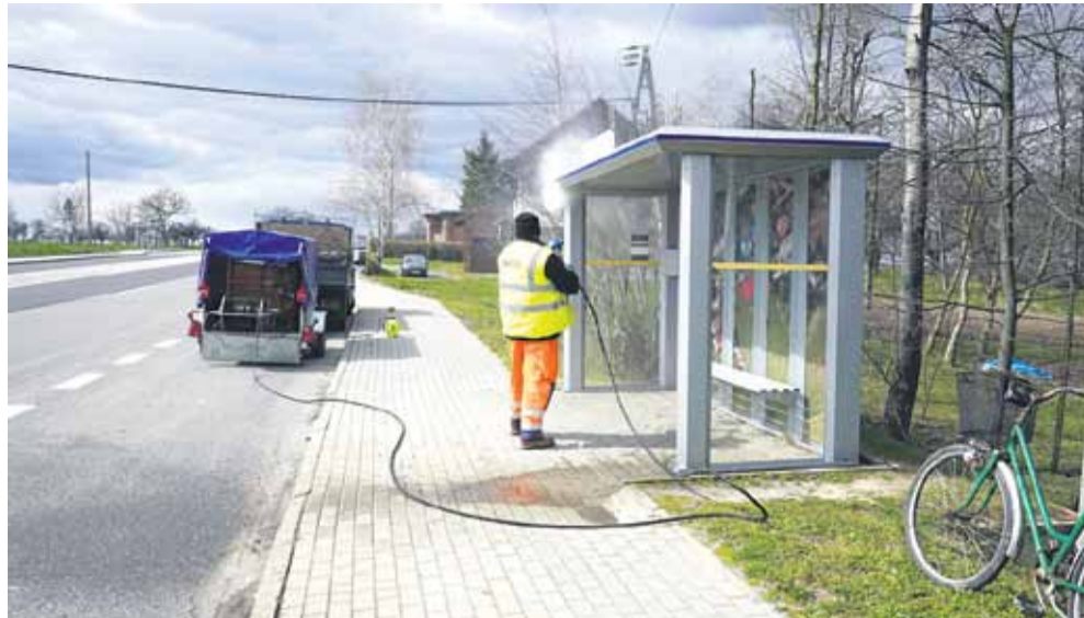
Wiosenne porządki. Mycie wiat przystankowych na terenie gminy Łańcut. Prace wykonuje Zakład Gospodarki Komunalnej