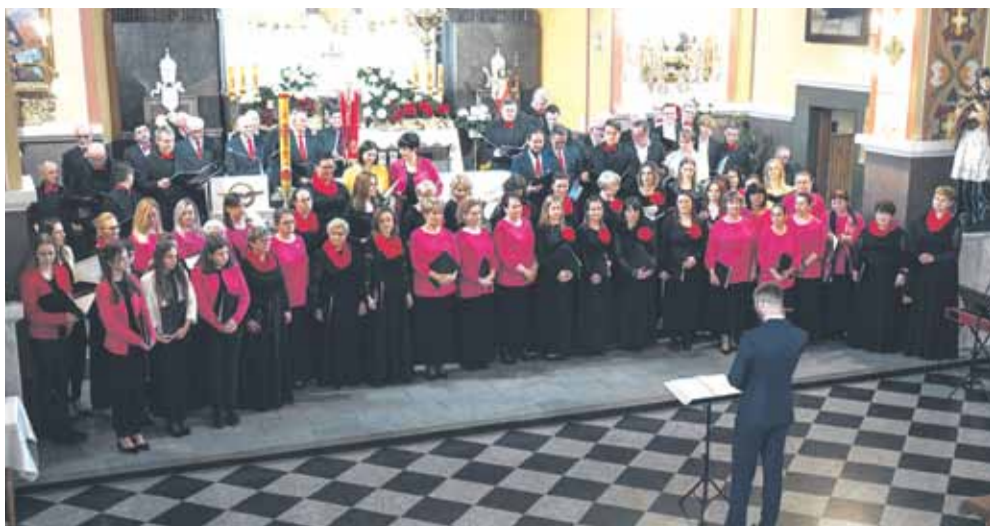
16 kwietnia w kościele parafialnym pw. św. Stanisława Biskupa w Kosinie odbył się XIX już Koncert Pieśni Wielkanocnej