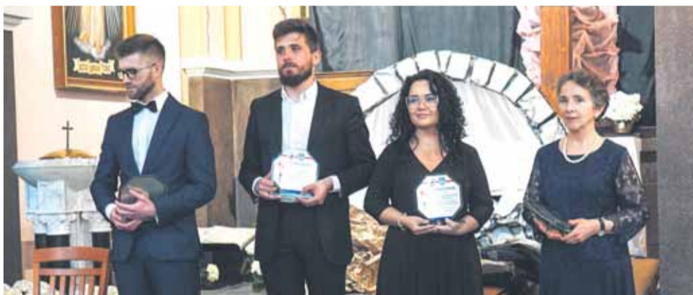
Podczas koncertu wystąpili: chór „Alba Cantans” z Rzeszowa, chór „Veritas” z Nowosielec, chór „Camerata” z Soniny oraz chór „Fraza” z Kosiny. Organizatorami wydarzenia byli: Wójt Gminy Łańcut, Stowarzyszenie Kulturalne Chór „Fraza”, Centrum Kultury Gminy Łańcut, Ośrodek Kultury w Kosinie. Patronat honorowy objął Polski Związek Chórów i Orkiestr Oddział Rzeszów