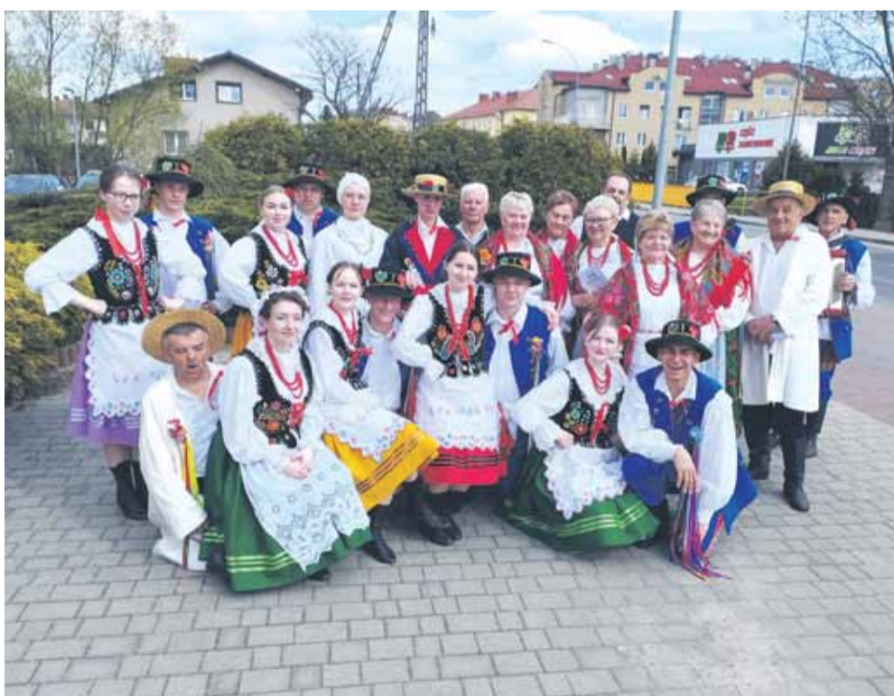
3 maja Zespół wystąpił także na Festiwalu Rzeszoffolk