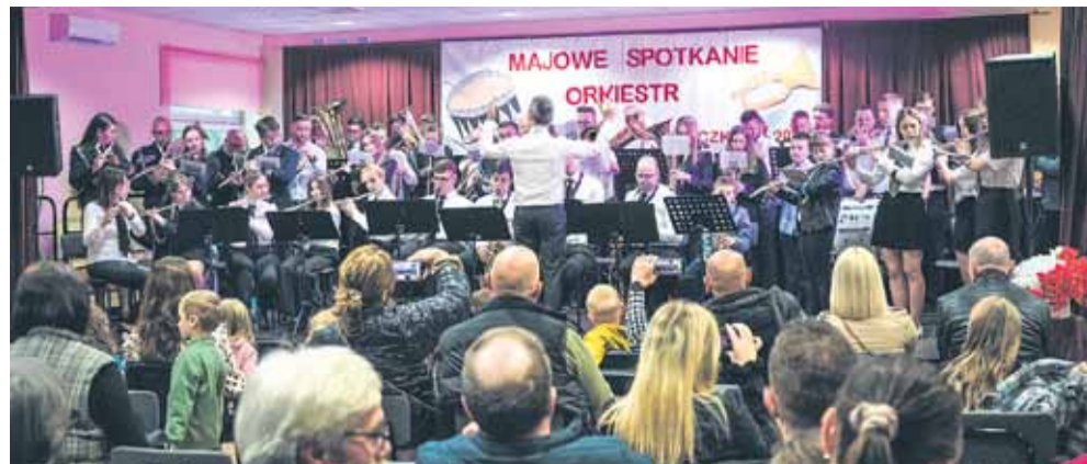
Majowe Spotkanie Orkiestr w Kraczkowej. Na scenie Ośrodka Kultury oprócz gospodarzy - Orkiestry Dętej z Kraczkowej wystąpili także muzycy z Kosiny, Handzłówki i Wysokiej.