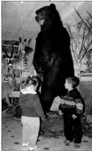
Na wystawie największym zainteresowaniem cieszył się niedźwiedź brunatny.