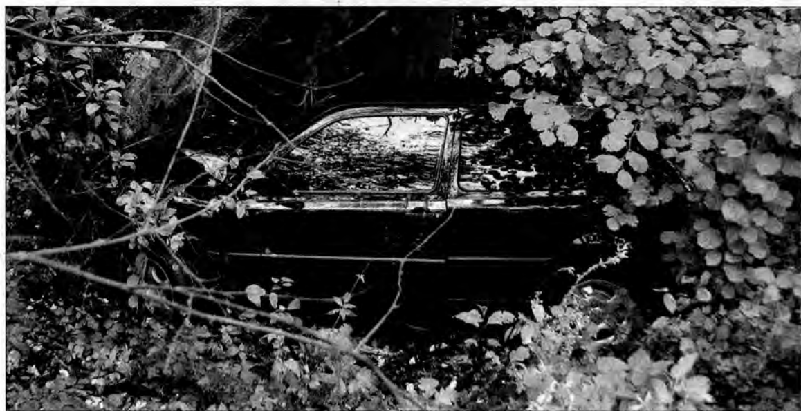
Lukasz MENDYCHOWSKI (3)