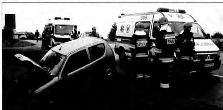
W Żurawicy kierowca busa prawdopodobnie chciał wymusić pierwszeństwo na jadącym fiatcie cinquecento. Kierująca fiatem próbowała wyhamować i wjechała do rowu.

Wśród (12.09) tuż przed skrzyżowaniem w Żurawicy doszło do kolizji drogowej z udziałem dwóch samochodów: busa marki Mercedes i fiata cinquecento. Oba jechały od strony Przemyśla w kierunku Jarosławia. Prawdopodobnie bus chciał wymusić pierwszeństwo na jadącym cinquecento. Kierująca fiatem próbowała wyhamować i wjechała do rowu. Oprócz niej w samochodzie były jeszcze dwie osoby, w tym dziecko. W wyniku kolizji pasażerowie cinquecento doznali ogólnych potłuczeń. Przyczynę kolizji ma wyjaśnić policyjne postępowanie, które prowadzi Posterunek Policji w Żurawicy.