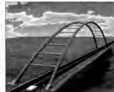
Wizualizacja mostu Rzezna – Sanocka. Szacunkowy koszt 50 mln zł. Termin realizacji: nie wiadomo kiedy.

– Powiem tak: liczę naprawdę, że w przyszłym roku rozpoczniemy procedury przetargowe, a to należy uznać za początek inwestycji, do wejścia w teren mijają 2, 3 miesiące. Ile ten most ma kosztować? – Sam most z dwoma zjazdami – na Buszowską i Kopernika – około 80 milionów, ale wraz z obwodnicą od Krakowskiej do Łwowskiej dwa razy tyle, czyli 180 do 200 milionów. Ten most powinien znacznie odciążyć ruch w mieście.