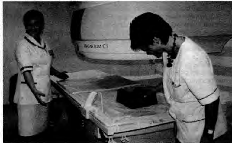
Po oficjalnym otwarciu każdy mógł obejrzeć nowe urządzenie.

Przypomnijmy, że Prokuratura Rejonowa w Jarosławiu prowadzi postępowanie w sprawie zakupu rezonansu przez poprzednie władze powiatu i poprzedniego dyrektora szpitala. Kontrowersje wokół jego zakupu pojawiły się po tym, jak prezes Urzędu