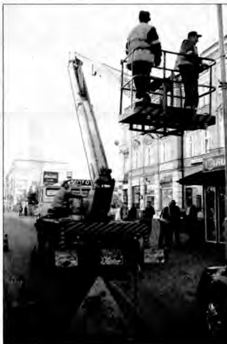
Pracownicy firmy „Elektro-Instal” w akcji.