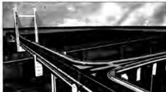
Wizualizacja mostu łączącego Buszowską i Kopernika. Koszt: 90 mln zł. Szacowany wkład miasta ok. 15 procent, 85 procent z programu Rozwój Polski Wschodniej, planowany termin realizacji: najwcześniejszy 2008 rok.