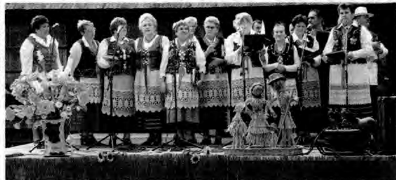
Zespół śpiewaczy Piganeczki z Pigan.

Różnego kształtu i smaku bocheny chleba, bułki, rogaliki i pieczywo innego rodzaju królowały na terenie zajazdu „Pastewnik” w Przeworsku, gdzie odbyło się I Powiatowe Święto Chleba.