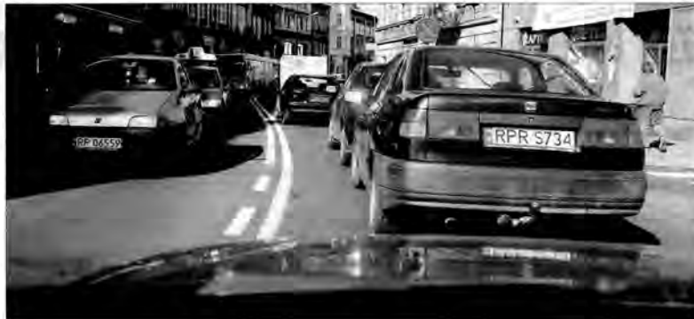
Przemysłowi nie grozi paraliż komunikacyjny. On już jest!

młodych – dodają gospodarze. – Tak się potrobiło, że czasu dzisiaj wszystkim brakuje, więc poznanie kogoś przez biuro, a nie na dyskotecy wydaje im się łatwiejsze. Poza tym nie każdy młody lubi lokale czy puby, bywają i mole książkowi-g. – prawda?