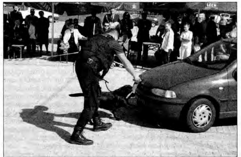
Podziw wzbudzały psy wyszkolone do wyszukiwania narkotyków i papierosów.

dużo zdrowia i większych zarobków, a także mniej uciążliwych, awanturujących się podróżnych oraz przebudowy tego przejścia i zwiększenia zatrudnienia, co ułatwiłoby życie zarówno celnikom, jak i podróżnym.