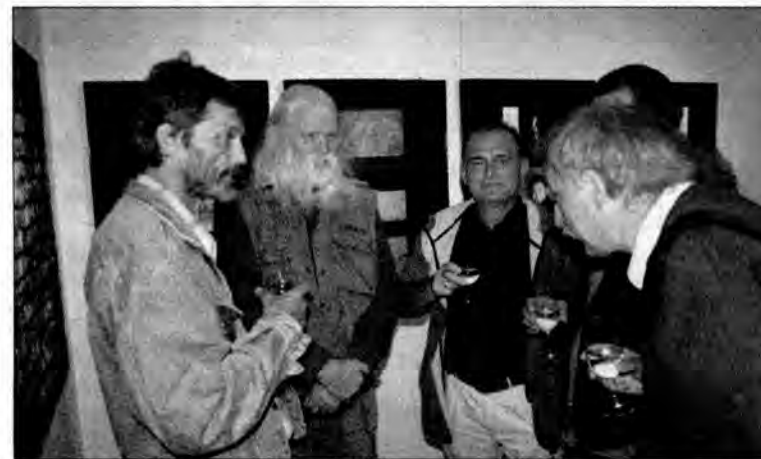
Galeria Sztuki Współczesnej w Przemyślu – wernisaż wystawy poplenerowej.