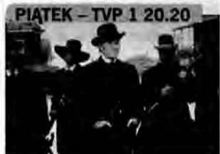
PIĄTKOWE KINO AKCJI: SZYBICY I MARTWI – western, USA 1995, reż. Sam Raimi.