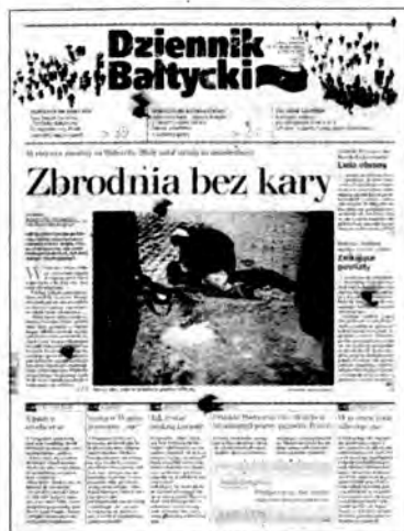
Dziennik Bałtycki nr 293 autor dyrektor artystyczny Krzysztof Ignatowicz