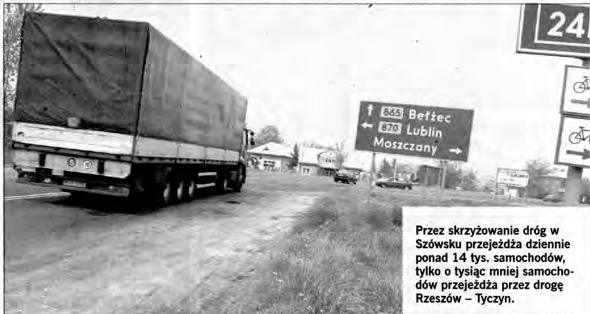
Przez skrzyżowanie dróg w Szówsku przejeżdża dziennie ponad 14 tys. samochodów, tylko o tysiąc mniej samochodów przejeżdża przez drogę Rzeszów – Tyczyn.