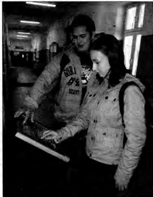
Jarosławscy studenci mogą korzystać z informacji, nie wchodząc do dziekanatu uczelni.

Jedenaście kiosków internetowych, tzw. infomatów, stanęło w budynkach jarosławskiej uczelni. Studenci wprowadzając swoją legitymację z czytnikiem sami mogą dotrzeć do potrzebnych informacji.