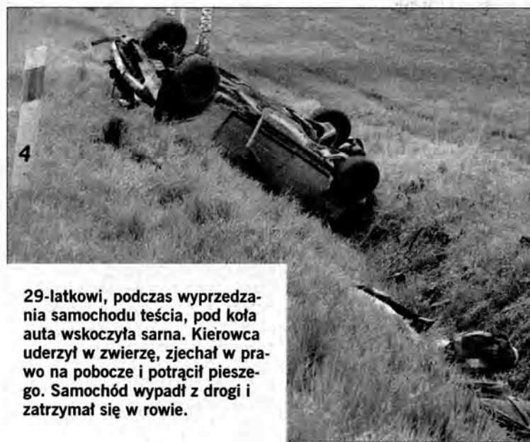
29-latkowi, podczas wyprzedzania samochodu teścia, pod koła auta wskoczyła sarna. Kierowca uderzył w zwierzę, zjechał w prawo na pobocze i potrącił pieszego. Samochód wypadł z drogi i zatrzymał się w rowie.

WYŻSZA SZKOŁA INFORMATYKI I ZARZĄDZANIA z siedzibą w Rzeszowie