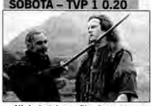
Nieśmiertelny – film fantastyczny, Wielka Brytania/USA 1986, reż. Russell Mulcahy.