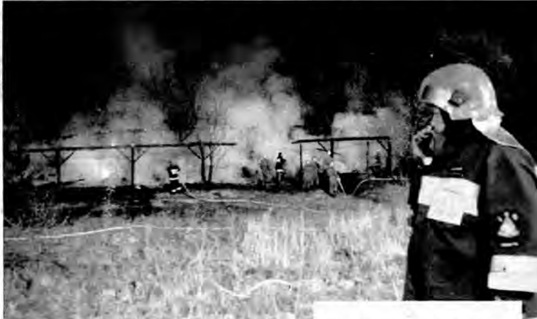
Komendy Miejskiej Państwowej Straży Pożarnej w Przemyślu.