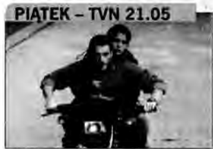
Superkino: Nieuchwytny cel – film sensacyjny, USA 1993, reż. John Woo.