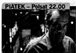
Wilki – horror, USA 1994, reż. Mike Nichols.