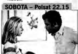
Sydney – thriller, USA 1996, reż. Paul Thomas Anderson.