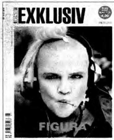
Exklusiv nr 40 autor Zuza Krajewska

WARSZAWA, PRZEMYŚL: W konkursie rywalizowało 371 jedynek