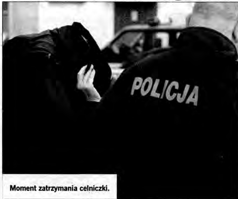
Moment zatrzymania celniczki.

W nocy z 18 na 19 kwietnia na przejściu granicznym w Medyce funkcjonariusze Centralnego Biura Śledczego zatrzymali trójkę celników podejrzewanych o korupcję.