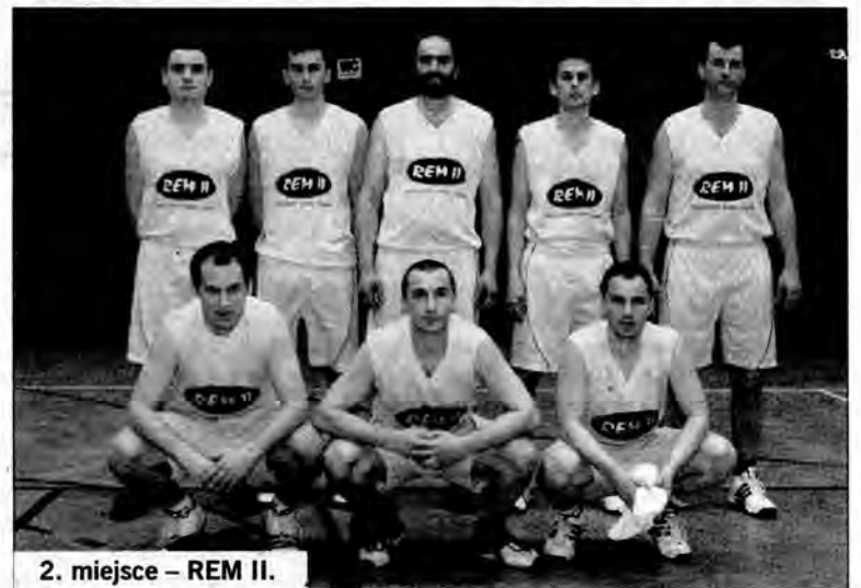
2. miejsce – REM II.