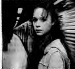
Ze slumsów na Harvard - dramat obyczajowy, USA 2003, reż. Peter Levin.

Liz, wychowywana w nędzy przez rodziców narkomanów, musiała wcześniej trzczyć się sama o siebie, samotnie walcząc o przetrwanie na ulicach. Któregoś dnia postanowiła odmienić swoje życie.