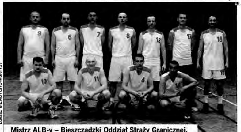
Mistrz ALB-y – Bieszczadzki Oddział Straży Granicznej.

Spotkaniu pod Wawelem niewiele da się powiedzieć, oprócz tego, że się w ogóle odbył. Obie ekipy zaprezentowały iście wakacyjną formę – fatalne pomysły w ataku połączone były z zupełnym brakiem ochoty do mocniejszej defensywy. Na parkiecie mogli się pojawić wszyscy wpisani do meczowego protokołu zawodnicy. Swoje trzy grosze wnieśli także fatalnie dysponowani sędziowie, ale to na II-ligowych parkietach jest już normą. „Pasy” zwyciężyły jak najbardziej zasłużenie. Na podsumowanie fatalnego w wykonaniu Niedźwiadków sezonu przyjdzie jeszcze czas. Sezonu przegranego z kretesem, za który ktoś powinien zapłacić głową. A jeśli jest