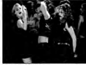
Gorąca łaska - komedia, USA 2002, reż. Tom Brady.

Jessica jest najładniejszą dziewczyną w szkole. Z upodobaniem prowadzi koleżankom złościwości. Wszystko się zmienia, gdy pewnego ranka budzi się jako niezbyt atrakcyjny 30-latek.