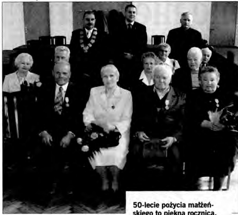
50-lecie pożycia małżeńskiego to piękna rocznica. 8 par z terenu gminy Żurawica obchodziło ten piękny jubileusz.

50 lat to długo, choć dla par małżeńskich, które w ubiegłym tygodniu w Żurawicy obchodziły jubileusz Złotych Godów, czas ten minął szybko. Pół wieku upłynęło im w radości, szczęściu, ale też czasem w smutku i bólu.