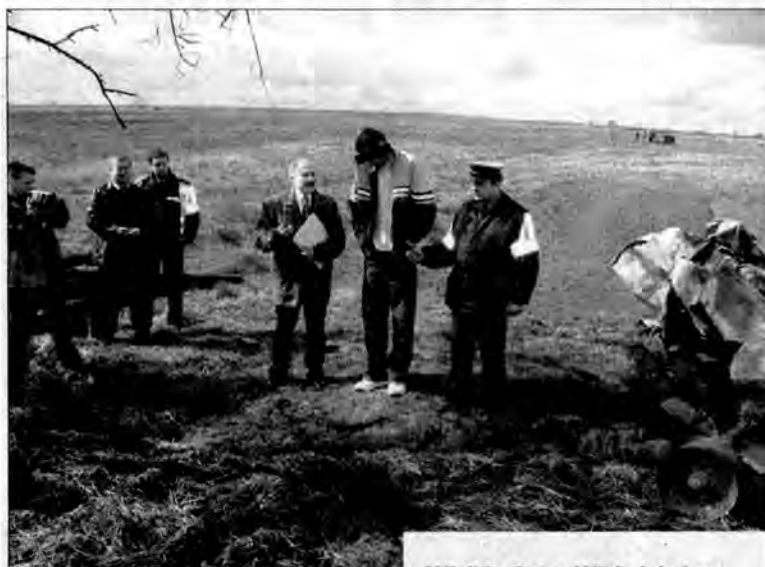
serwis KPP w Lubaczowie

Ludzie w Wielkich Oczach odetchnęli, bo wydawało się, że to już koniec z pożarami. Jednak nocą z 15 na 16 kwietnia w wiosce znów zawyły syreny. Prawie jednocześnie płonęły dwie stodoły usytuowane po obu stronach drogi w