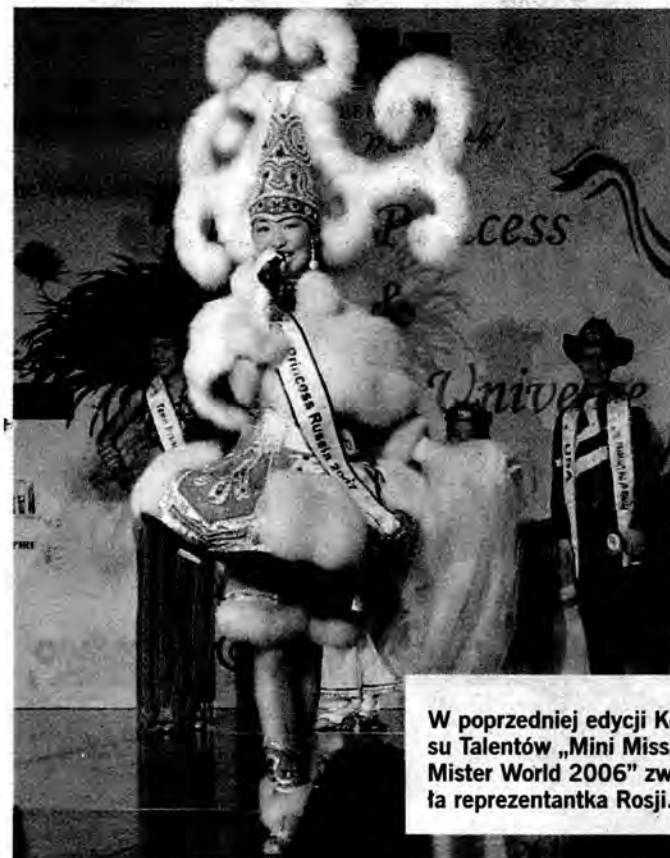
W poprzedniej edycji Konkursu Talentów „Mini Miss & Mini Mister World 2006” zwyciężyła reprezentantka Rosji.