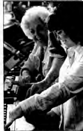
Prawdziwe historie: Hazardzistka - dramat obyczajowy, USA 2003, reż. Graeme Campbell.