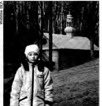
Kapliczka „na wodzie” w Nowinach Horynieckich.

zameczonemu za odmowę ujawnienia tajemnicy spowiedzi czeskiej królowej Zofii. Stąd rozciąga się malowniczy widok na roztoczańskie wzgórza i wąwozy. Potem trzeba się zagłębić w cieniastą dolinę, gdzie kilka strumieni łączy się w pobliżu małej drewnianej kapliczki „na wodzie”. W świątyni, tuż przed ołtarzem tryska źródółko krystalicznie czystej wody. Jak wierzą pielgrzymi – ma ona niezwykle właściwości zdrowotne. Szczególnie orzeźwiająco wpływa na zmęczone od ślęczenia przed komputerem oczy. Niedaleko znajduje się też cmentarz żołnierzy z okresu I wojny światowej. W lesie przy drodze do Niwek Horynieckich można zobaczyć głazy megalityczne, zwane „świętynią słońca”, których kultowego przeznaczenia dopatrują się badacze zamierz-