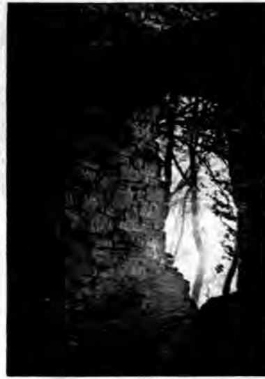
Ruiny zamku sfotografował Andrzej Dańko. Za tę fotografię otrzymał II nagrodę podczas konkursu fotograficznego Krasicyzn 2006.

Miejsce, które polecam, jest nietypowym celem wycieczki. Popierwsze dlatego, że nie leży na terenie powiatu przemyskiego, ale zupełnie niedaleko jego granic. Po drugie dlatego, że nie jest celem samym w sobie, ale fascynującym punktem w trakcie podróży samochodem w Bieszczady. Jadąc w stronę Sanoka, skręcamy w Załużu w prawo (na Lesko). W bardzo dobrze oznakowanym miejscu (po prawej stronie szosy) zatrzymujemy auto, by po chwili wędrowki w górę (krótkiej, łatwej, choć momentami stromej) znaleźć się w miejscu magicznym. Mowa oczywiście o ruinach zamku na górze Sobień. Zamku, który stawał tu sam król Władysław Jagiełło. Ruiny (rzeczywiście tajemniczo wyglądające) owiane są licznymi legendami. Ponoć można tu zobaczyć dwie straszące Damy – Białą i Czarną, choć mnie się nigdy to nie udało. Wyjątkowe, rzekomo, szczęście trzeba mieć, by ujrzeć dwie naraz, bo pory straszenia tylko na moment się zbiegają. Lesisty szczyt zwieńczony zamkowymi ruinami