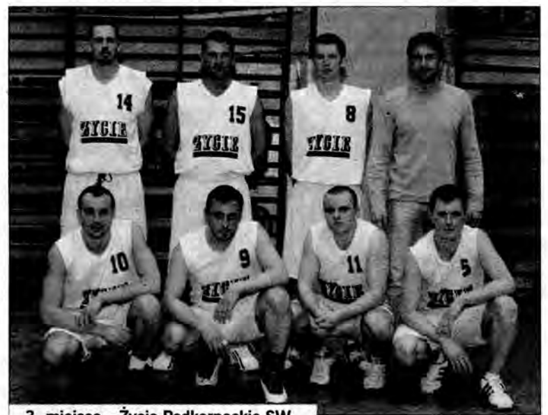
3. miejsce – Życie Podkarpackie SW.