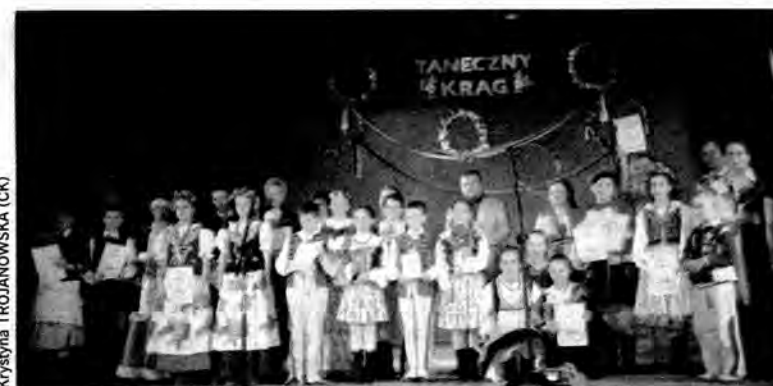
Grupowe zdjęcie nagrodzonych.