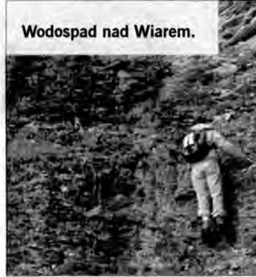
Wodospad nad Wiarem.

Wariant dla leniwych albo zmęczonych: kocyk, krem do opalania i nad Wiar.