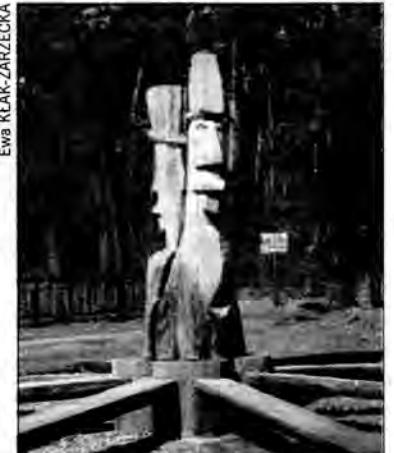
Rzeźby wykonane przez uczniów jarosławskiego liceum plastycznego zdobią Łapajówkę, stąd już tylko kilka kilometrów do Radawy.