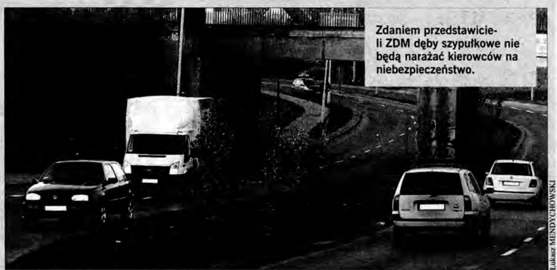
Zdaniem przedstawicieli ZDM dęby szypułkowe nie będą narażać kierowców na niebezpieczeństwo.