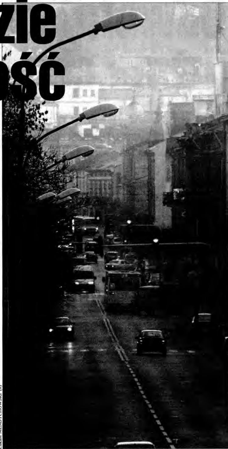
Lukasz MENDYCHOWSKI (8)

Nowe oprawy to lampy Phillipisa o mocy do 150 W z trzyletnią gwarancją. Wyliczone oszczęd-