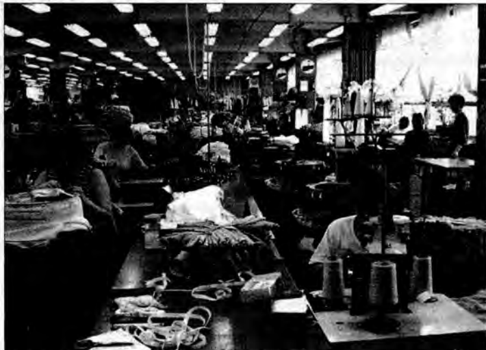
Niedługo jarlanowskie sweterki przejdą do historii. W ich miejsce wejdą poszycia fotelowe Leara.

Jeżeli Lear Corporation zrealizuje obecne zamierzenia, w dalszych planach jest budowa fabryki, w której produkowane byłyby siedzenia samochodowe. Oferta prac skierowana byłaby głównie do mężczyzn (do tej pory w Lear Corporation Poland zatrudniane były głównie kobiety). Inwestycja ta ma być zlokalizowana w Tucempach w gminie wiejskiej Jarosław. Ekz