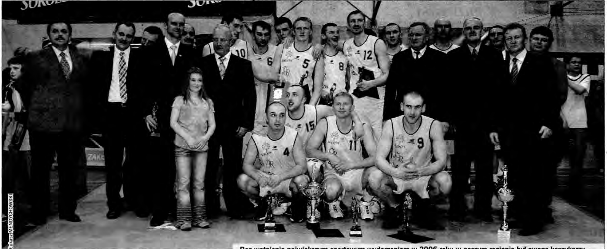
Bez wątpliwości największym sportowym wydarzeniem w 2006 roku w naszym regionie był awans koszykarzy Sokół-Znicza Jarosław do Dominet Bank Ekstraligi – najwyższej koszykarskiej klasy rozgrywkowej w Polsce.