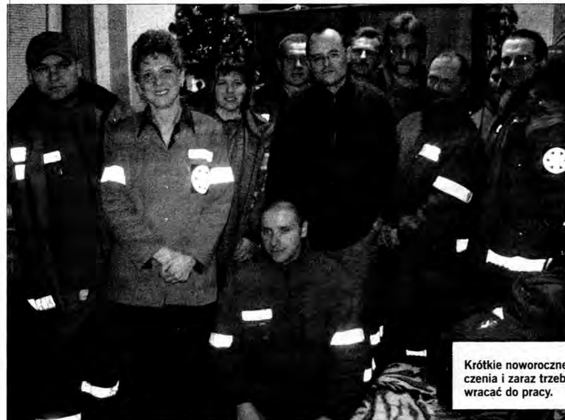
Krótkie noworoczne życzenia i zaraz trzeba wracać do pracy.