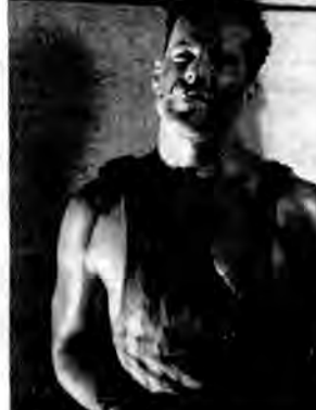
Szklana pułapka - film sensacyjny, USA 1988, reż. John McTiernan. Grupa terrorystów, która opanowała wieżowiec w Los Angeles, nie przewidziała jednego, że w labiryntach pięt i korytarzy ukrył się policjant John McClane. Rozpoczyna się bezwzględny pojedynek.