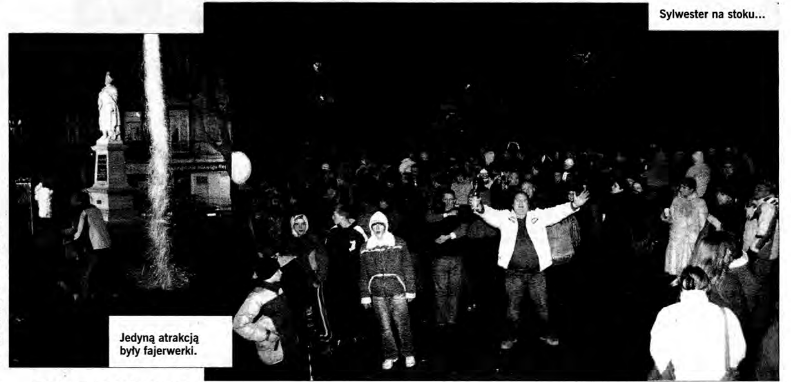
Sylwester na stoku...

Zawsze to jakieś „żywe” kolory na tle zbrudzonego błotem asfaltu. Ale czy to ładnie, by prezydent miasta w niecałe dwa miesiące od ponownego wybrania go na to stanowisko nie był na imprezie sylwestrowej, którą sam wymyślił na stoku, a nie Rynku i nie odezwał się do ludzi, życząc im „coś tam” oraz podziękował za ponowny swój wybór? To jest nieładnie! Bardzo nieładnie! To można różnie rozumieć... To jest „olanie” przemyslan i to w dużym stylu. JS