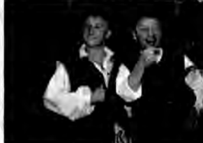
Pastoralka - spektakl teatralny - reż. Laco Adamik. Korowód koleśników dociera do drzwi góralskiej chaty należącej do sołtysa. W środku znajdują ciepło i schronienie. Koleśnicy zaczynają przedstawienie, opowiadając historię Narodzenia Pańskiego.