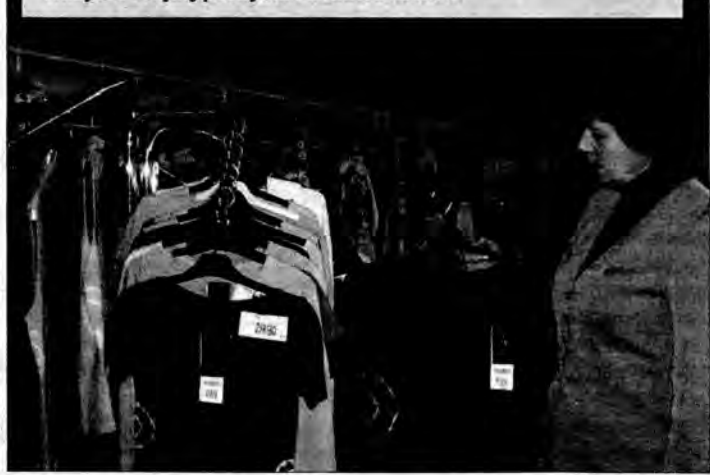
Ewa KLAK-ZARZECKA (2)