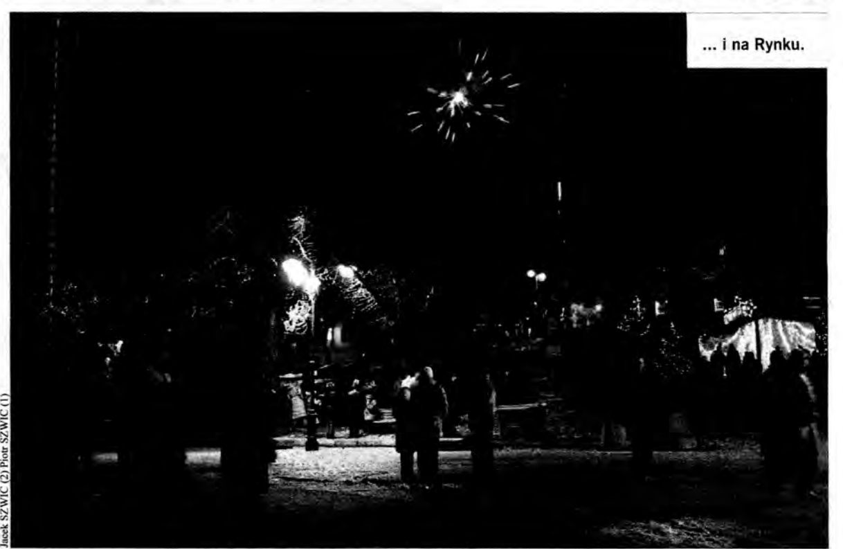
... i na Rynku.

Od szesnastu lat każdego sylwestra spędzałem na Rynku. Bywało różnie, ale zawsze tych kilka tysięcy mieszkańców przychodziło i z czasem stało się to tradycją. Prezydent z estrady składał życzenia mieszkańcom, ludzie padali sobie w objęcia, całowali się, a niektórzy nawet tańczyli, nie zważając, czy muzyka jest mechaniczna, czy na żywo. I komu to przeszkażało? Wydało mi się, że rewitalizacja Rynku, o której tyle się mówiło, polega nie tylko na zagospodarowaniu przestrzennym tej centralnej części miasta. Ożywienie to większa liczba lokali i imprez z roku na rok lepiej organizowane. A przecież wystarczyło podpatrzeć, jak to robią inne miasta. Rozumiem potrzebę promocji stoku, ale chyba zupełnie nic by się stało, gdyby były dwie imprezy, z tym że musiałyby być one zorganizowane. Przy dobrych pomysłach nie potrzeba na to wiele pieniędzy. Szkoda, że tak wyszło, oby takie wpadki już się nie zdarzały. Jacek SZWIC