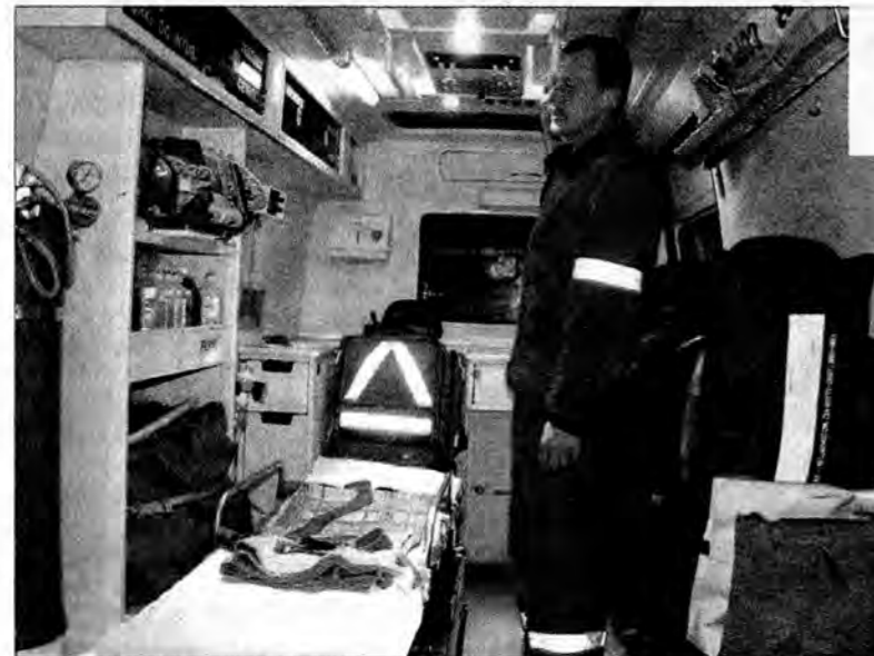
Karetką wypadkową jest przygotowana na wyjazd.

Pracownicy pogotowia opowiadają o warunkach swojej pracy, o tym jak są traktowani przez wzywających. Kiedyś na przykład zdarzyło im się odwiedzić uczestnika lębajki do szpitala, a koledzy tego pacjenta już zdążyli w tym czasie wezwać policję, bo w pijanym widzie wydawało im się, że zespół też coś wypił. I chcąc nie chcąc, pracownicy pogotowia musieli dmuchać w al-