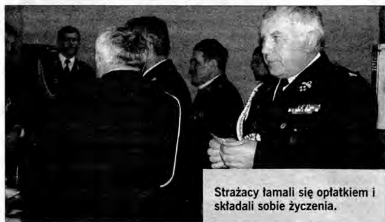
Strażacy lamali się opłatkiem i składali sobie życzenia.

22 grudnia w Domu Strażaka w Harcie odbyło się posiedzenie Zarządu Gminnego Związku Ochotniczych Straży Pożarnych RP w Dynowie.