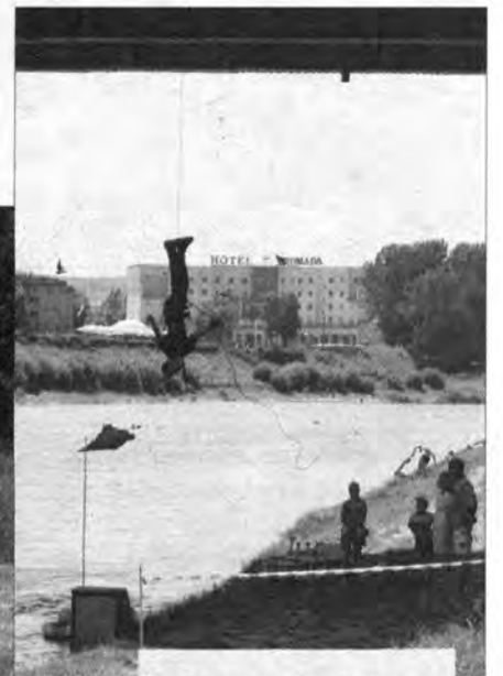
Przemyska Drużyna Harcerska zaprezentowała pokaz spuszczenia na linie.

W ubiegły weekend Twierdzę Przemyśl opanowali Szwejkowie. Odbyły się w niej 9. Wielkie Manewry Szwejkowskie.