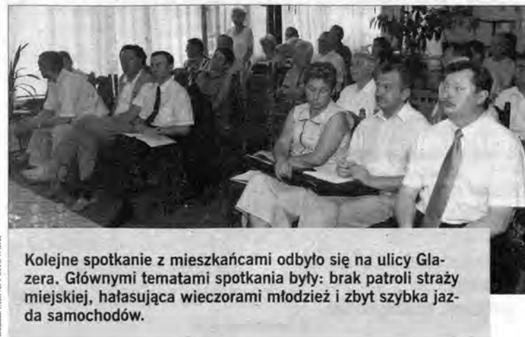
Kolejne spotkanie z mieszkańcami odbyło się na ulicy Glazera. Głównymi tematami spotkania były: brak patroli straży miejskiej, hałasująca wieczorami młodzież i zbyt szybka jazda samochodów.