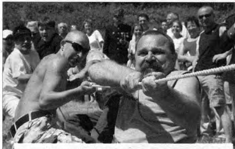
Manewry wodne rozpoczęły się przeciąganiem beczki piwa przez San. W tym roku, po raz pierwszy, wygrała drużyna z Zasania.