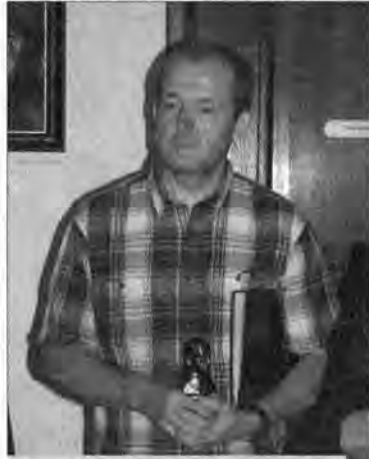
Laureat ze statuetką.