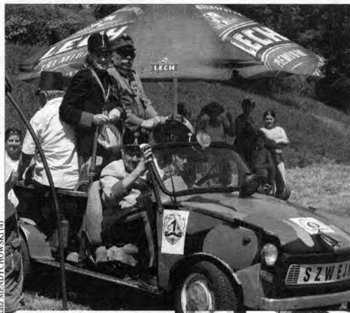
Efektowny wjazd regimentu szwejkowskiego.