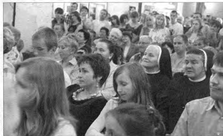
Mieszkańcy Dubiecka i Śliwnicy mogli nie tylko wysłuchać pasjonujących wspomnień misjonarzy, ale także obejrzeć afrykańskie wyroby rękodzielnicze.