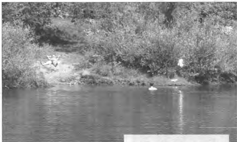
Jacek SZWIC (2)

Kolejne miejsce to park. W okolicy starych fortyfikacji ślady po ogniskach, puszkach po piwie, rozbite butelki i strzykawki świadczą,