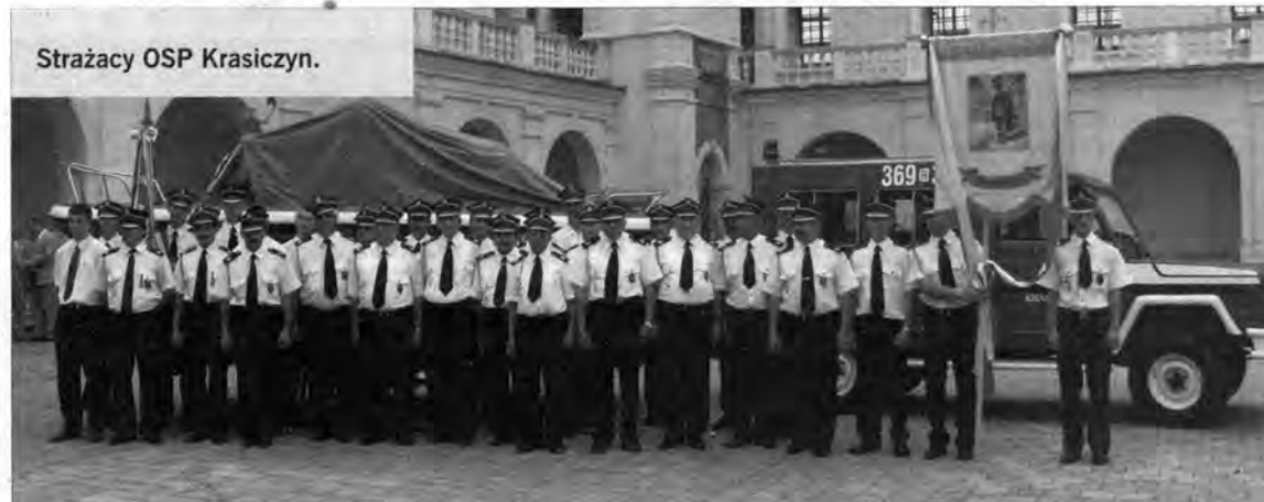
Strażacy OSP Krasiczyn.

Pożar, który wybuchł w Krasiczynie w 1852 r. oraz założenie browaru w latach 1854 – 1855 spowodowały potrzebę założenia straży ogniowej. Zadaniem jednostki, która znalazła swoją siedzibę przy browarze było zapewnienie bezpieczeństwa dobrom księcia Sapiehy.