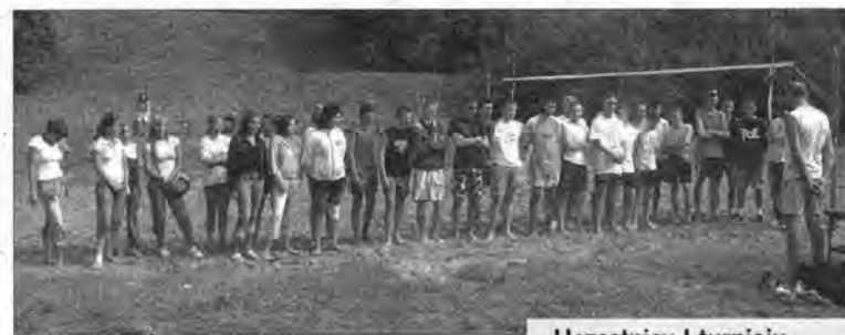
Uczestnicy I turnieju przemyskiej „plażówki”.