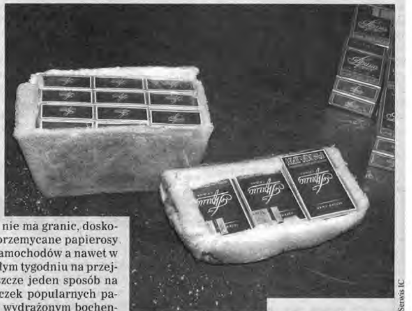
– Chleba naszego powszedniego...

O tym, że ludzka pomysłowość nie ma granic, doskonale wiedzą celnicy, którzy przemycane papierosy znajdują w oponach i bakach samochodów a nawet w majtkach podróżnych. W ubiegłym tygodniu na przejściu w Medyce odkryli oni jeszcze jeden sposób na szmuglowanie fajek. Kilka paczek popularnych papierosów prima ukryte było w wydrążonym bochenku chleba, a kilka następnych w sałatce. Jak tak dalej pójdzie, to przy Izbie Celnej będzie mogło powstać muzeum osobliwości.