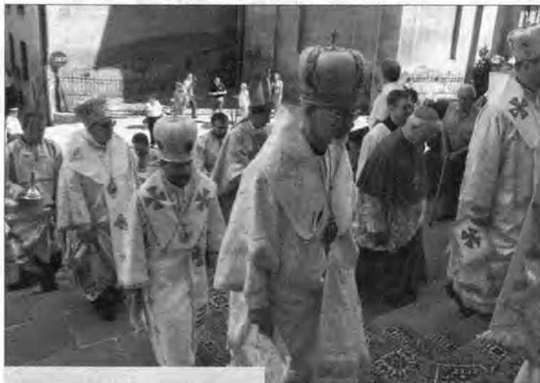
W uroczystości uczestniczyli hierarchowie kościelni z kilku krajów.