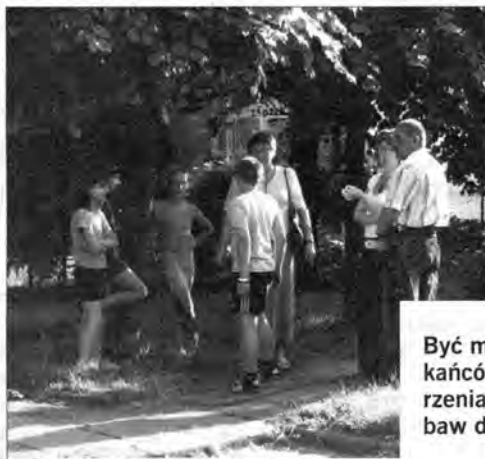
Być może determinacja mieszkańców doprowadzi do stworzenia jakiegoś miejsca do zabaw dla dzieci.