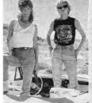
Thelma i Louise – dramat obyczajowy, USA/Australia 1991, reż. Ridley Scott.

Thelma i Louise są przyjaciółkami, które mają dosyć ról, jakie narzuca im świat. Decydują się uciec od dotychczasowego życia. Za krótkotrwałe poczucie wolności przyjdzie im jednak drogo zapłacić.