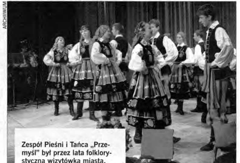
Zespół Pieśni i Tańca „Przemyśl” był przez lata folklorystyczną wizytówką miasta. I nią pozostanie.