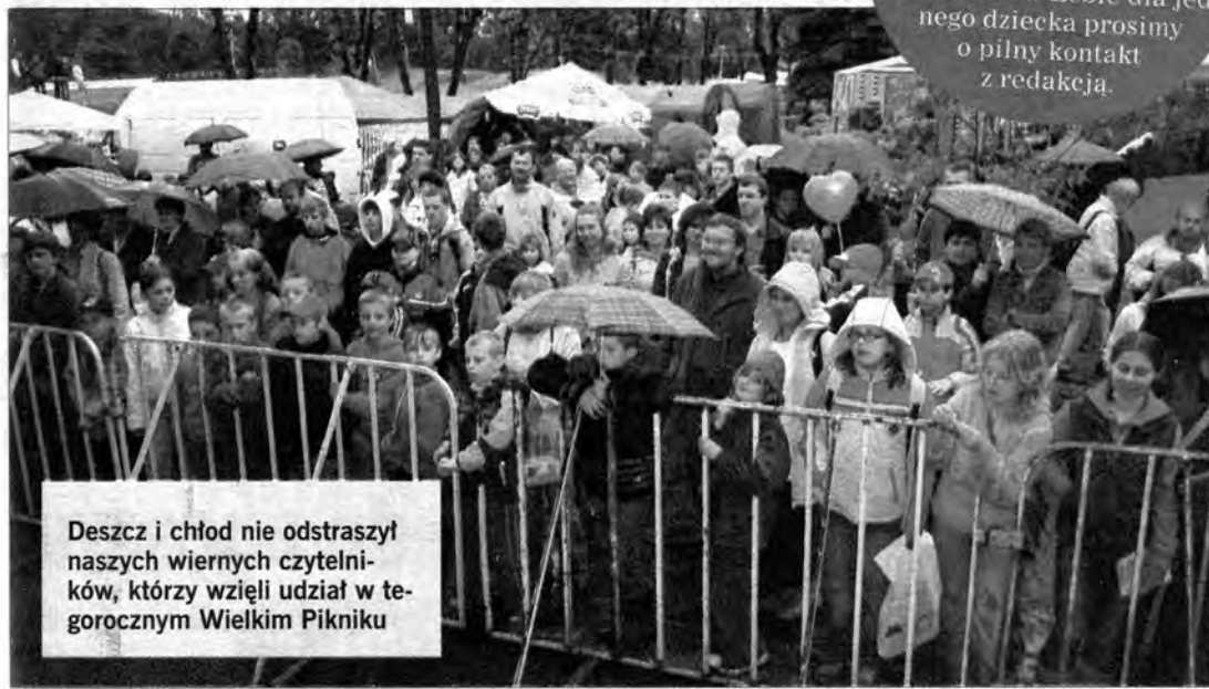
Deszcz i chłód nie odstraszył naszych wiernych czytelników, którzy wzięli udział w tegorocznym Wielkim Pikniku

Właściciela firmy, który podczas pikniku charytatywnego zadeklarował sfinansowanie kolonii w Lebie dla jednego dziecka prosimy o pilny kontakt z redakcją.