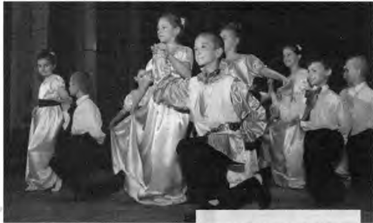
Grupa Teatralna uczniów z GOK w Horyńcu Zdroju przedstawiła Calineczkę .

Jako roku, w maju (24–25 bm.) do Gminnego Ośrodka Kultury, Sportu i Turystyki w Birczy zjechały teatryki dziecięce. W tegorocznym XXIX Przeglądzie Teatryków Dziecięcych wzięło udział 14 teatryków z powiatów: przemyskiego, jarosławskiego, przeworskiego, lubaczowskiego i z Medzilaborców na Słowacji.