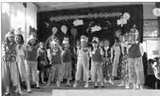
Jak zwykle przy tego rodzaju uroczystościach, nie obyło się bez popisów artystycznych.

Tego dnia w szkole odbyła się tradycyjna już „Familiada”, czyli Święto Rodziny. Na uroczystość oprócz uczniów i nauczycieli placówki, przybyli rodzice i dziadkowie, a także przyjaciele i absolwenci „ósemki”. Na początek zaplanowano część artystyczną w wykonaniu uczniów, a po niej dodatkowe atrakcje w postaci: gier, konkursów i zawodów sportowych. Na zwycięzców czekały dyplomy i nagrody rzeczowe.