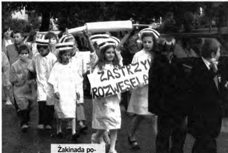
Żakinada pokazała, że wyobraźni lubaczowskim dzieciom nie brakuje.