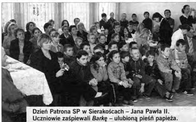
Dzień Patrona SP w Sierakoścach – Jana Pawła II. Uczniowie zaśpiewali Barkę – ulubioną pieśń papieża.