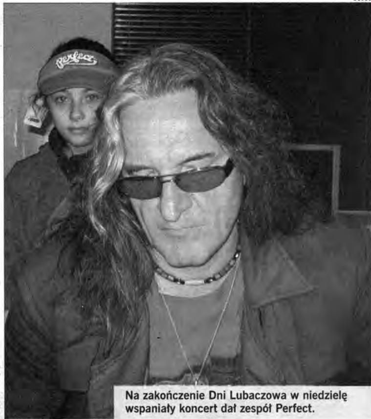
Na zakończenie Dni Lubaczowa w niedzielę wspinały koncert dał zespół Perfect.