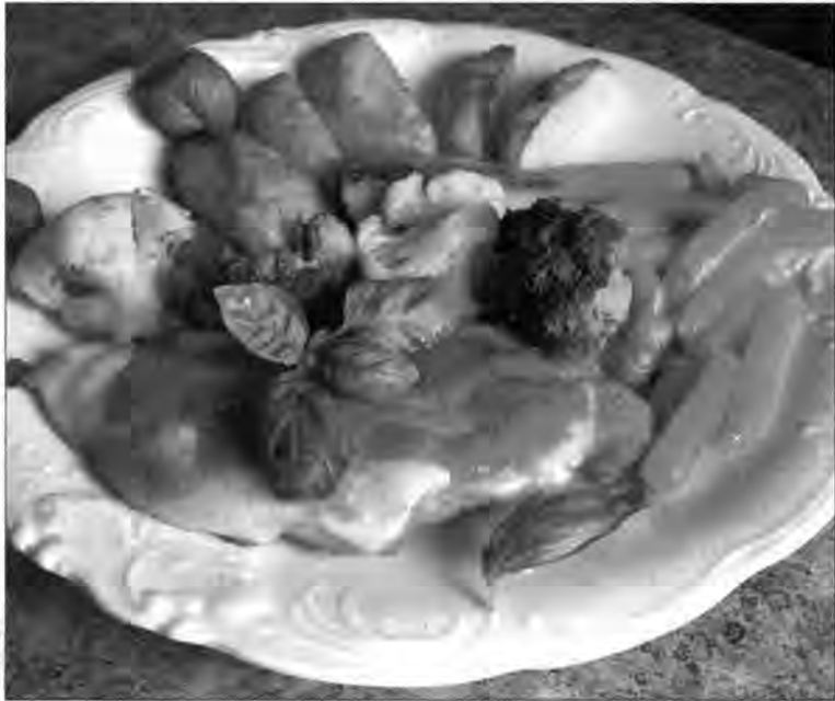
gałązka świeżej pietruszki parę listków świeżej bazylii

WYKONANIE: Filety dokładnie myjemy, usuwamy błonki i ścięgna. Lekko rozbijamy z obu stron, posypując solą i pieprzem. Układamy na brytfance wyłożonej folią aluminiową natłuszczoną oliwą z oliwek. Na filetach układamy plastry mozzarelli, całość polewamy sosem pomidorowym.