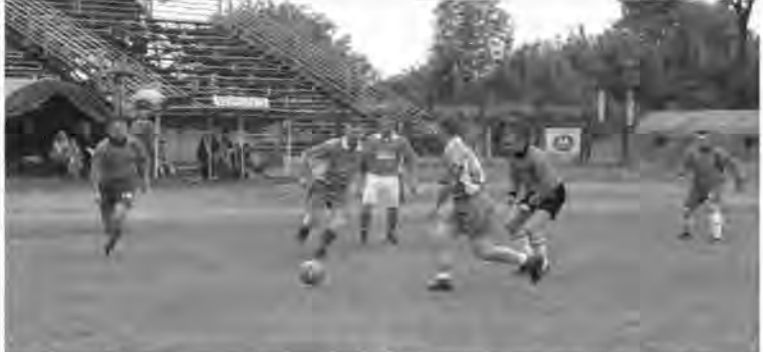
Warunki do gry w piłkę nożną były fatalne. Nie przeszkodziło to jednak zespołowi 1. Batalionu Czolgów strzelić 6 bramek reprezentacji ŻP (fragment tego spotkania na zdjęciu).