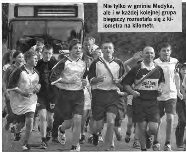
Nie tylko w gminie Medyka, ale i w każdej kolejnej grupa biegaczy rozrastała się z kilometra na kilometr.