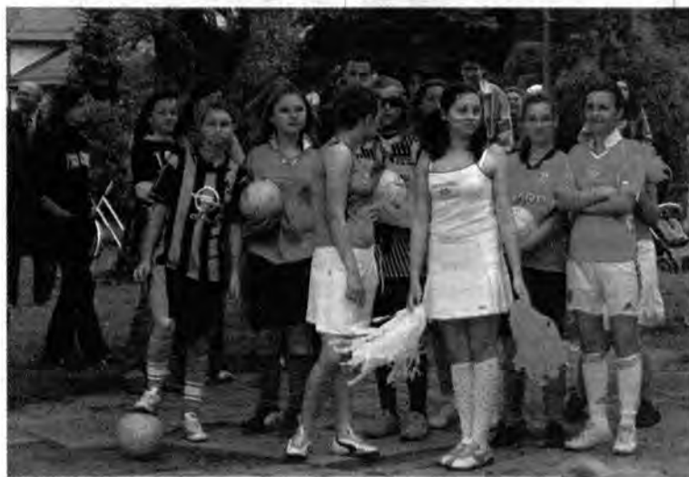
Podczas żakinady nie zabrakło motywów mundialowych.