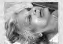
Na zdjęciu N.N. ofiara wypadku.

Komenda Miejska Policji w Przemysłu prosi o pomoc w ustaleniu tożsamości kobiety, która zmarła w wyniku obrażeń odniesionych w wypadku drogowym.