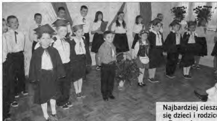
Najbardziej cieszą się dziećmi i rodzicami z Reczpolu.