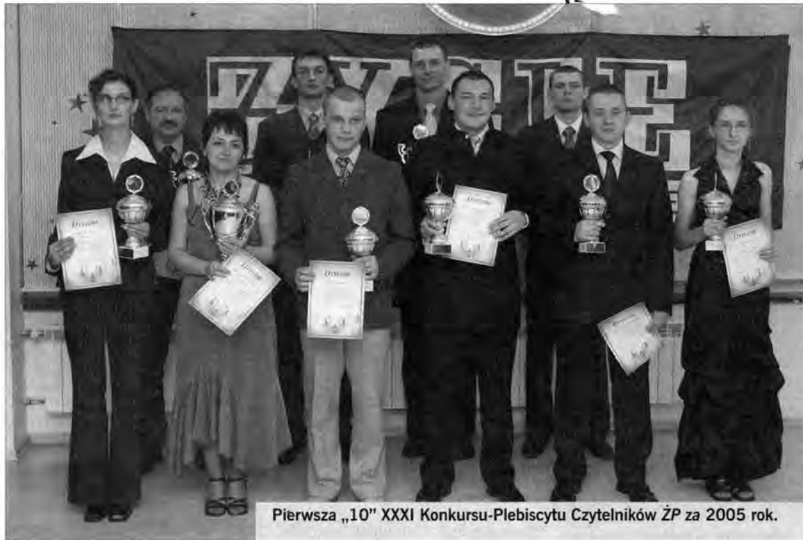
Pierwsza „10” XXXI Konkursu-Plebiscytu Czytelników ŻP za 2005 rok.