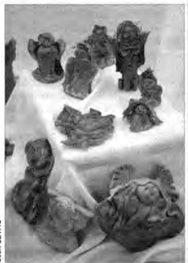
Fragment wystawy Anioły są wśród nas .

W Krasiczynie na trzecim piętrze baszty, w której mieści się Galeria ARP, czynna jest interesująca wystawa Anioły są wśród nas .