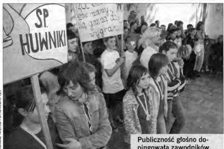
Publiczność głośno dopinguje zawodników.

Podczas Mikołajkowych Potyczek atrakcji nie brakowało. Jedną z nich był konkurs bicia piany.