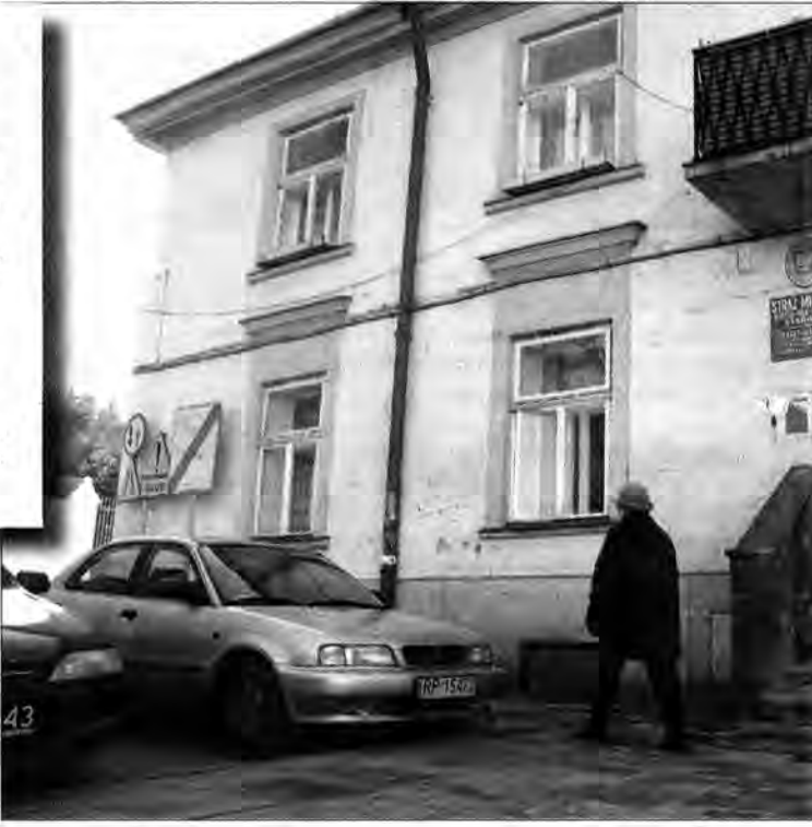
LIANNE MENCZKOWSKI (B)

nesmenem czy bardziej urzędnikiem” – dodał.