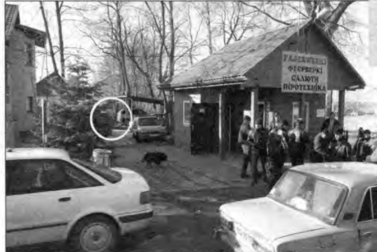
Bazar w Korczowej z zaznaczonym miejscem, w którym doszło do napadu.

16 lutego pracownica kantoru o g. 20 skończyła pracę i po zamknięciu interesu, pięć minut później, szła do zaparkowanego nieopodal auta. Kiedy była już dwadzieścia metrów od kantoru, została nagle zaatakowana. Nieznany mężczyzna uderzył ją ręką w tył głowy. Napadnięta upadła, ale nie straciła przytomności. Napastnik, licząc pewnie, że kobieta ma ze sobą utarg, próbował wyrwać jej torbę. Zaczęła się szarpanina. Kobieta krzyknęła głośno, wzywając pomocy. Wtedy przybiegł pracownik zatrudniony na parking. Próbował obezwładnić napastnika, ale ten wyrwał się i zaczął uciekać pomiędzy budy w głąb bazaru. Tymczasem przybiegli inni, którzy słyszeli krzyki i razem z pracownikiem parkingowym rzucili się w pościg za bandytą, który próbował