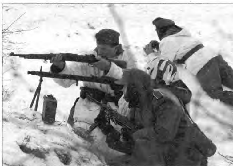
Pojedynczy punkt oporu.

Na pobojowisku leżeli obok siebie żołnierze niemieccy i radzieccy.