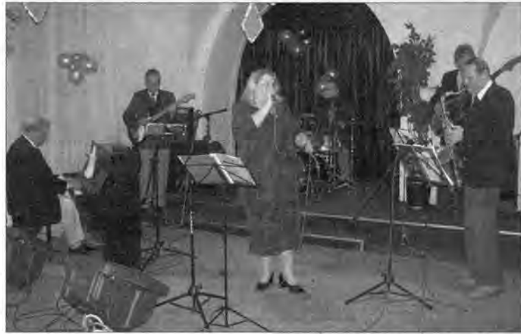
Przemyskie Niedźwiadki w akcji.

O tym, że gatunek prawdziwych bigbitowców żyje, ba zdaje się być w pełni sił twórczych, można było się przekonać w ostatnią niedzielę karnawału, 26 lutego w klubie Niedźwiadek.