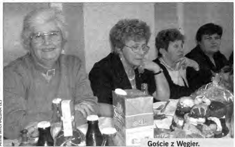
Goście z Węgier.

Wiem, że niedawno gościła u Państwa w Diósd delegacja kobiet z KGW w Nowym Siolu, która