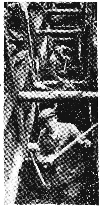
Mimo niezbyt sprzyjających warunków rzeszowskie „wykopki” trwają.

Nie możemy powstrzymać się, aby zaprosić przedstawicieli Stacji Sanitarnej-Epidemiologicznej na degustację bułeczek w barze przy ul. Grotgera. (abw)