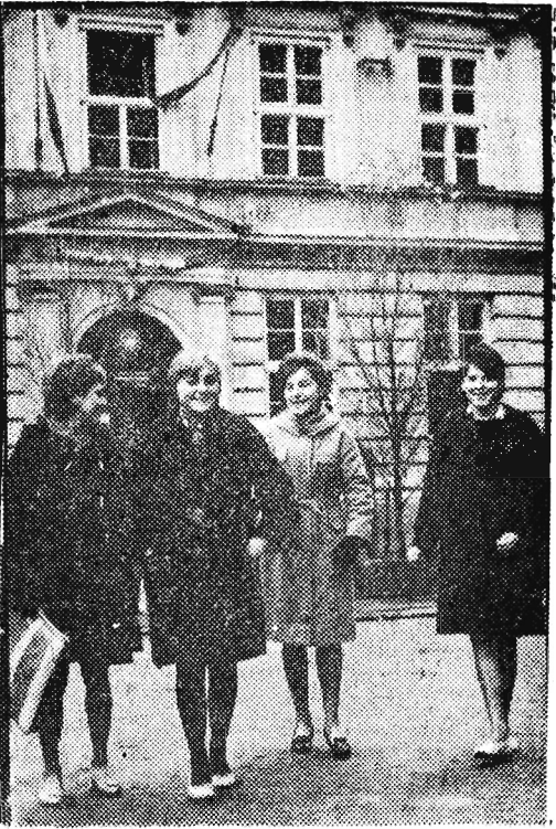
W naszej szkole, podobnie jak we wszystkich, wielkie święto - Dzień Nauki. Postępowanie w nauce i zachowaniem musimy udokumentować i przywiązać do wychowawców.

Nowoczesna placówka zdrowia, jaką ma być szpital w Dębicy, kosztować będzie 50 mln złotych. Opracowano już jego dokumentację lokalizującą obiekt za osiedlem „Stomilu”. Nowo wybudowany szpital wyposażony zostanie w nowoczesny sprzęt medyczny. Rozpoczęcie budowy przewiduje się w 1963 roku, największe zaś nasilenie prac nastąpi w latach 1964-1965.