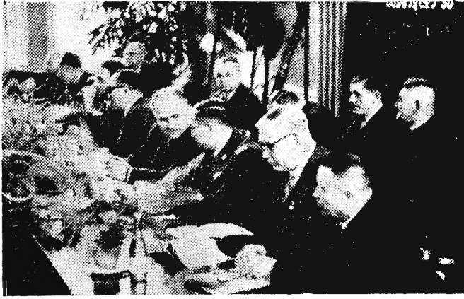
Prezydium Zjazdu ZBoWiD okręgu rzeszowskiego.