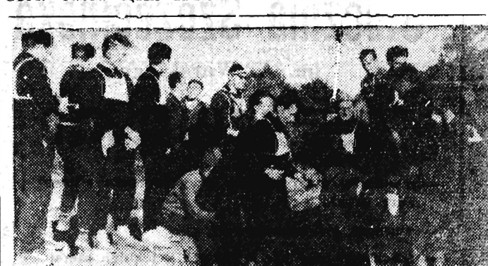
W ub. tygodniu odbyły się w Beskidzie Niskim bardzo interesujące zawody na tzw. orientację, w której uczestniczyło wielu turystów z całej prawie Polski.

Przywiązując do tych wypadków dużą wagę i poświęcając im w ostatnim okresie wiele miejsca na naszych łamach chcieliśmy tą drogą osiągnąć jeden jedyny cel — przestrzec po raz ostatni wszystkich tych, którzy być może sądzili jeszcze do niedawna, że można u nas liczyć na bezkarność za chuligańskie wybryki. Decyzje podjęte przez WGiD wyraźnie wskazują, że w żadnym wypadku nikt nie skorzysta z ulgowej taryfy — kary zawsze będą równie surowe jak wielka będzie odpowiedzialność sprawców jakiegokolwiek awantury na boisku sportowym.