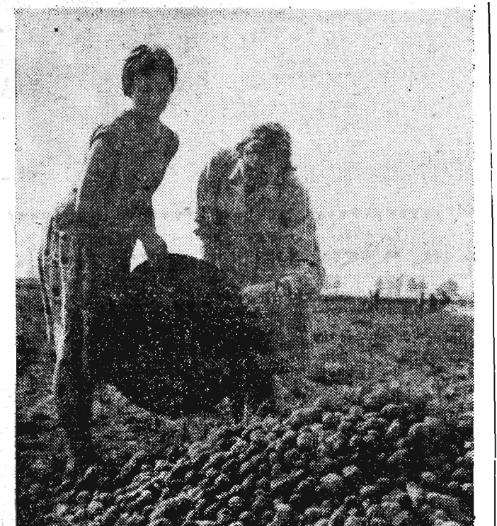
Uczennice Liceum Ogólnokształcącego z Jarosławia pomagają przy wykopkach na polach PGR Makowiska.