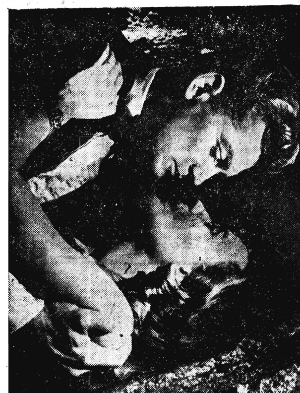
Kadr z filmu „Szkłany zamek"

Festival Filmów Polskich już za nami i na ekranach znowu uchoją dalsze filmy zaplanowane. Jednym z nich będzie "Szkłany zamek", zrealizowany 11 lat temu, film Rene Clementa („Bib- tona o szarym", Muru Mala- jagi", "Gertrude" i inne). Jest to dramat, kobiety z wielkiego świata, która po latach niedużego małżeń- stwa zakochuje się w mło- dum czowieku. Niesieły, nie zchła ona na silie po- łaguje się z nikim innym. Przecież ten kłobiel krewie Michele Merzian. Jej me- tra gra Jan Serwis, nikochme- go — Jean Marais.