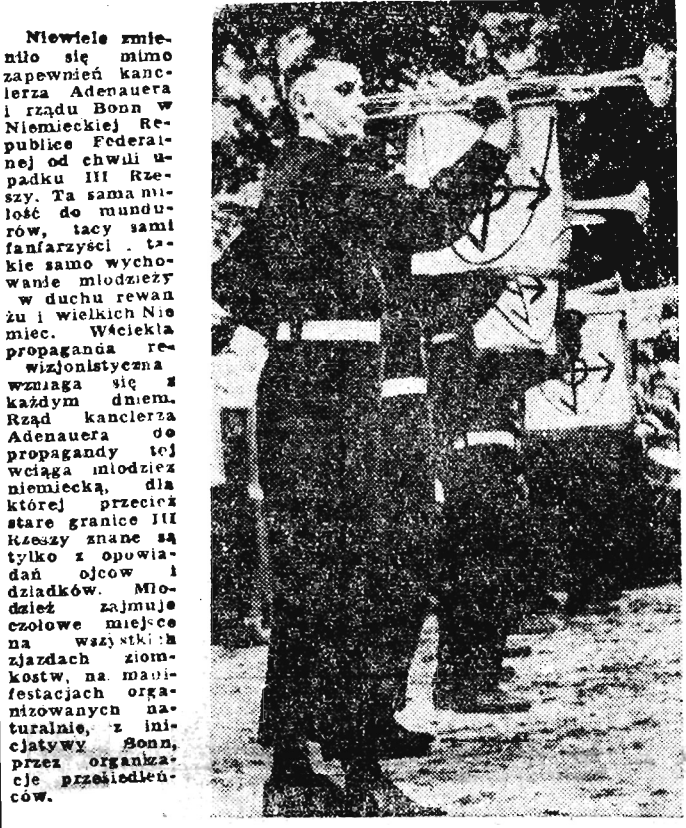
Na zdjęciu: Fanfarzyści rewizjonistycznej organizacji młodzieżowej DJO (Niemiecka Młodzież Wschodu) podczas spotkania przesiadki w miejscowości Preetz w Szlezwioku — Holsztynie. Zdjęcie niczym nie różni się od oglądanych w O-kresie III Rzeszy — zajęć Hitlerjugend.

Kongres brazylijski wyznaczył poniedziałek 4 bm. jako datę ewentualnego wprowadzenia Goularta na stanowisko prezydenta.