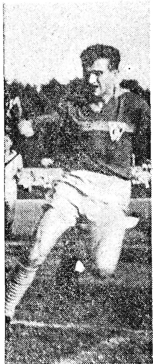
Wobec napastników Górnika defenzywa Stali była bezradna.

WYNIKI TECHNICZNE: KLASA 125 CM 3 : 1) Zbigniew Cibala, 2) Henryk Markowski — obaj LPZ Nowa Dęba, 3) Stanisław Sobkiewicz LPZ Przenyśl. KLASA 250 CM 3 : 1) Zbigniew Ryznar (na motocyklu Jawa Cross), 2) Ryszard Bieńkowski obaj LPZ Łańcut, 3) Mieczysław Krupa LPZ Rzeszów.