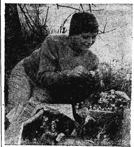
Grzyby obrodziły...

WKRÓTCE POZNACIE NASTĘPNEGO KOSMONAUTĘ — słowa te wypowiedział 2 września przebywający w Berlinie kosmonauta radziecki major Herman Titow na spotkaniu w ambasadzie radzieckiej z pracownikami tej placówki. Titow przekazał swoim rodakom pozdrowienia od majora Gagarina oraz kosmonautów nr 3 i nr 4, jak również dalszych, przygotowujących się obecnie w ZSRR do lotów kosmicznych.