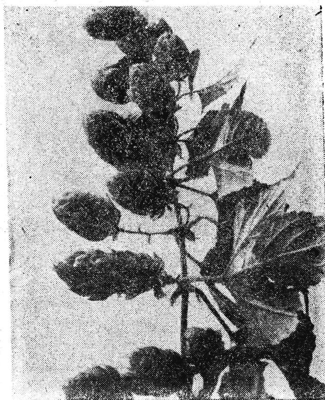
Chmielarstwo, jedna z gałęzi produkcji rolnej, która w województwie rzeszowskim znajduje możliwość stałego rozwoju. Tak właśnie wygląda gałąź dojrzałego chmielu...