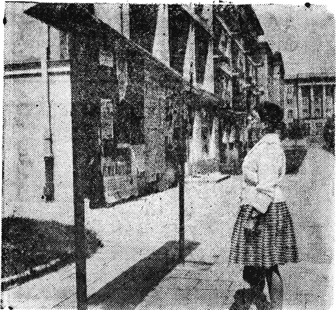
— Co nowego...?