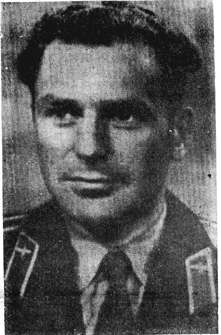
Na zdjęciu: major HERMAN STEPANOWICZ TITOW.

Na stronie 2 zamieszczamy rozmowę Chruszczowa z kosmonautą Titowem przeprowadzoną przez telefon