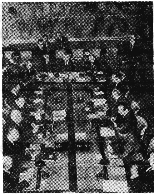
Z obrad konferencji genewskiej w sprawie zakazu doświadczeń z bronią atomową. Na pierwszym planie po lewej — delegacja USA z Arthurem Dean'em, na wprost niej — delegacja Anglii z Ormsby-Gore'm.