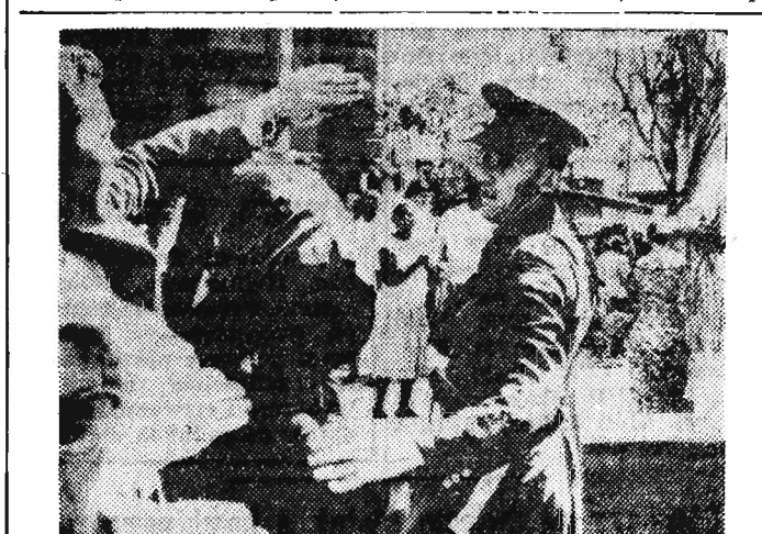
ZAMIESZKI W JOHANNESBURGU

Komunikat na ten temat brzmi: „W poniedziałek o godz. 12 w południe prezydent spotka się w Białym Domu z radzieckim ministrem spraw zagranicznych Gromyką. O spotkaniu prosił radziecki minister spraw zagranicznych który ma do przekazania prezydentowi pismo od swego rządu”.