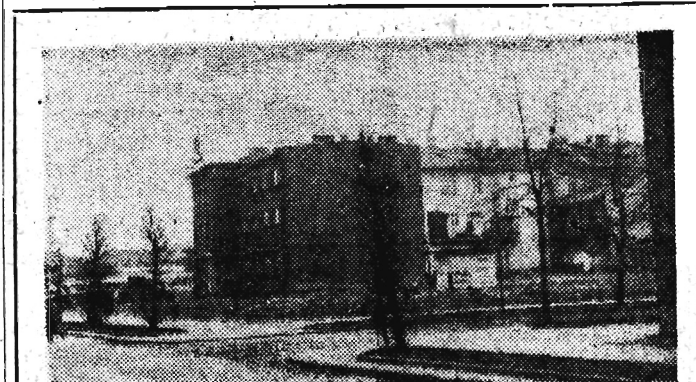
Puste dziś place budowlane, w najbliższym pięcioletciu staną się terenem rozwiniętego budownictwa.

Zwiększenie częstotliwości kursów ułatwi poważnie dojazd kilkuset ludziom do zakładów pracy i szkół. List w tej sprawie przysłany do naszej redakcji podpisał 70 osób. Jest to zatem dość pokaźne grono, szliśmy więc, że MPK podobnie - jak inne - uwzględni również i tę propozycję.