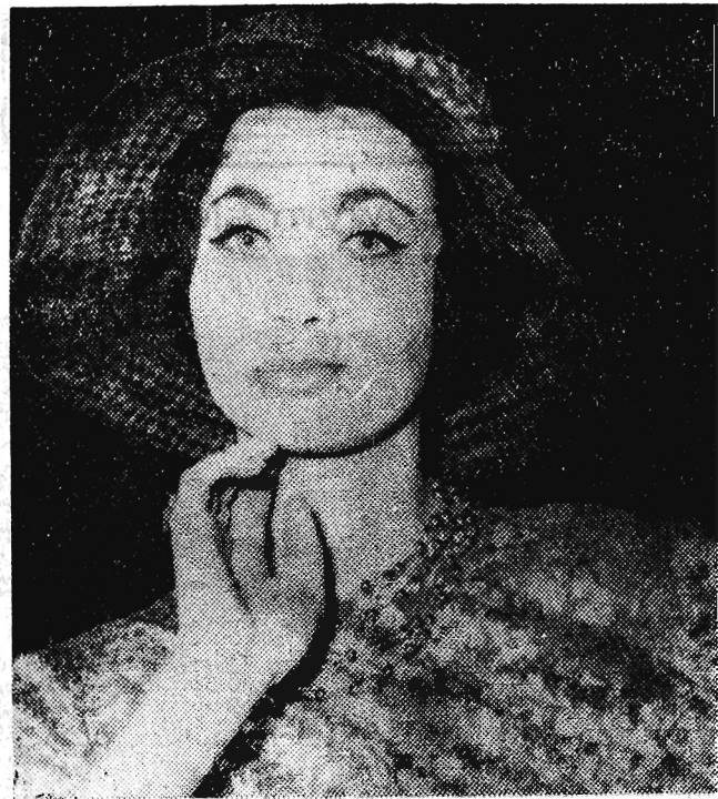
Oto jeden z kapeluszy proponowanych przez „ MO-DE POLSKA ” na sezon wiosenno-letni.