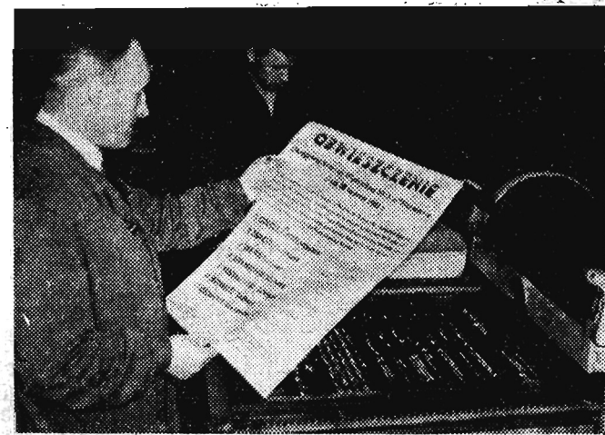
W drukarni „Domu Słowa Polskiego” w Warszawie — atmosfera iście przedwyborcza. Z maszyn drukarskich schodzą plakaty wyborcze, obwieszczenia, listy kandydatów na posłów i radnych. Na zdjęciu: A oto odbitka korekta listy kandydatów na posłów z okręgu wyborczego nr 3 (Warszawa) — w okręgu tym kandyduje Władysław Gomułka.

oraz krótkie relacje z pozostałych meczów II ligi. Relacje z Indywidualnych Mistrzostw Bokserskich Okręgu Rzeszowskiego Terminarz klasy A Grupy Południowej oraz aktualne informacje z kraju i ze świata.