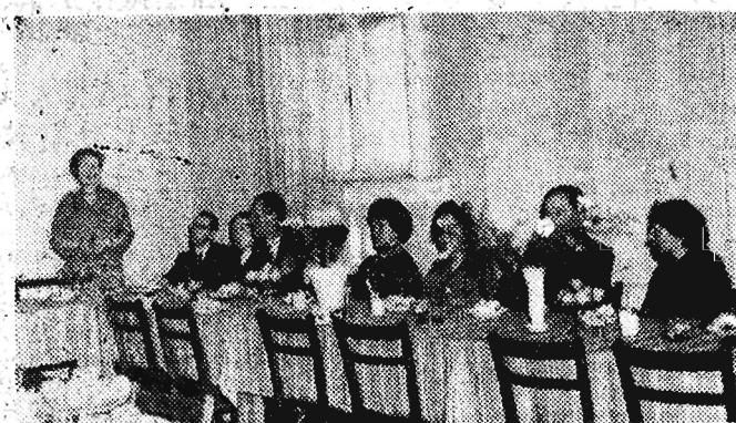
Kobiety z SD obradują.