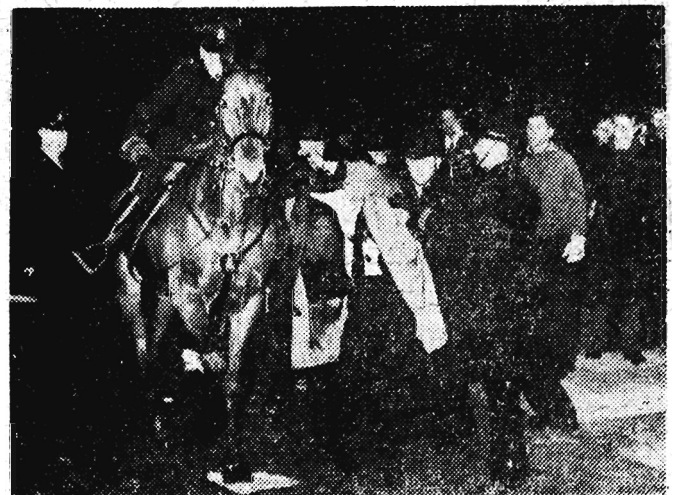
Policja aresztuje demonstrantów przed ambasadą belgijską w Londynie, podczas wiecu protestacyjnego przeciwko zamordowaniu premiera Lumumby.