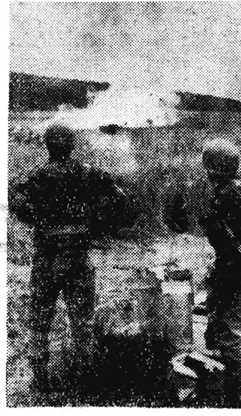
Podczas gdy państwa zachodnie nadal paraliżują wszelką skuteczną akcję na rzecz przywrócenia pokoju w Kongu...