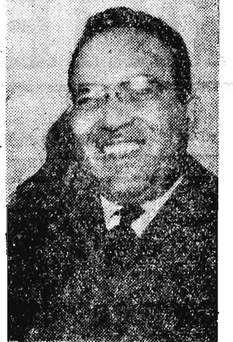
Tunezyjski minister informacji Masumoudi...

USA dostarczają broni bandom czangkaiszkowskim działającym w Birmie Birma przestała skargę do ONZ