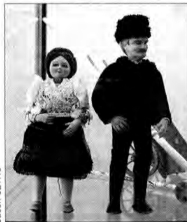
Fragment ekspozycji – lalki w strojach ludowych.

Ekspozycje pochodzące z Komitatu Heves (kraina Węgier) to zwykle przedmioty, służące ludziom przez całe życie: dziecienna lalka, łyżka, pasterski czerpak, skrzynia z wianem panny młodej, weselny strój lub drewniany bukłak na wino. Każda z tych rzeczy jest bogato zdobiona, co nie umniejsza wcale jej funkcjonalności. Dostrzegamy zatem ogromny kontrast z teraźniejszością, w której coraz częściej posługujemy się nijakimi przedmiotami jednorazowego użytku.