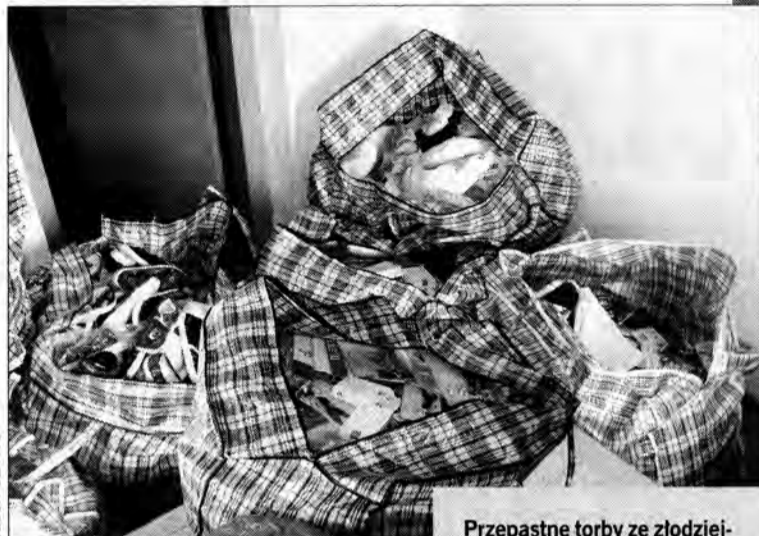
Przepastne torby ze złodziejskimi łupami.