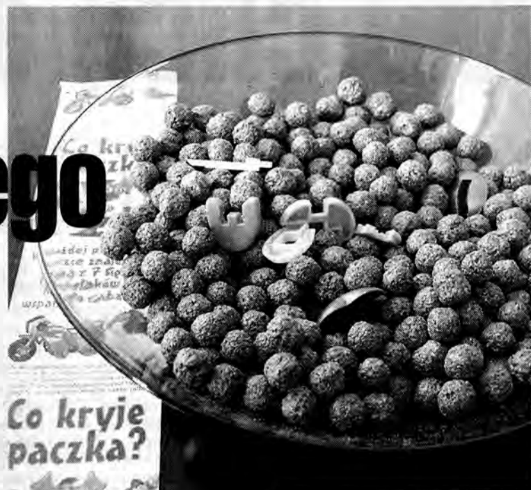
Co kryje paczka?

Informacje z opisem wydarzenia i wynikami ekspertyzy przeprowadzonych we wspomnianym mieście zostały przekazane Generalnemu Inspektorowi Sanitarnemu w Warszawie. Dwa dni później inspektor wydał decyzję nakazującą producentowi wycofanie z handlu w całej Polsce Mlekołaków z zabawkami. Nadzór nad akcją powierzył jednostkom podrzędnym. Według lubelskiego zakładu wycofanie i wy-