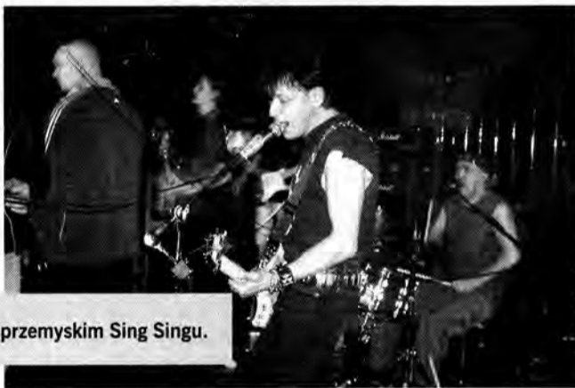
KSU w przemyskim Sing Singu.

Na koncert z okazji 25-lecia działalności zespołu KSU przyszło kilkuset fanów punkowej muzyki. Popularny klub Sing Sing drżał w posadach.