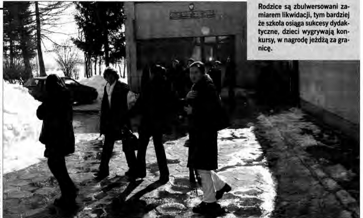
Rodzice są zbulwersowani zamiarem likwidacji, tym bardziej że szkoła osiąga sukcesy dydaktyczne, dzieci wygrywają konkursy, w nagrodę jeżdżą za granicę.