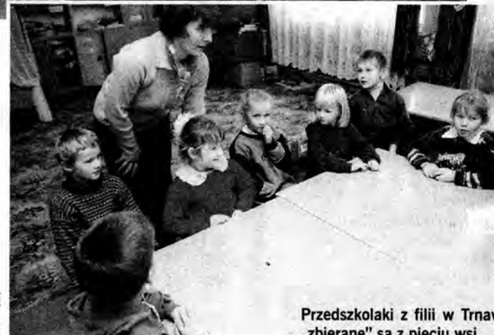
Przedszkolaki z filii w Tarnawce „zbierane” są z pięciu wsi.

Żeby zdążyć na szkolny autobus, wstają nie później niż o szóstej. Podobnie nauczycielki, które do-