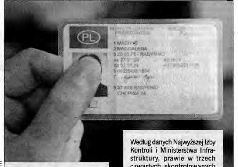
Za kilkanaście miesięcy, aby otrzymać prawo jazdy, trzeba się będzie nieźle napocić.

Najwięcej zmian ministerstwo zapowiada w szkoleniu i nadawaniu uprawnień, zwłaszcza młodym kierowcom, którzy powodują najwięcej wypadków i najczęściej są ich ofiarami. Mają być wprowadzone nowe formy szkolenia, z powodzeniem stosowane w krajach skandynawskich, jak np.: jazda z osobą towarzyszącą lub jazda w warunkach specjalnych (śliska nawierzchnia, przeszkody na drodze itp.).