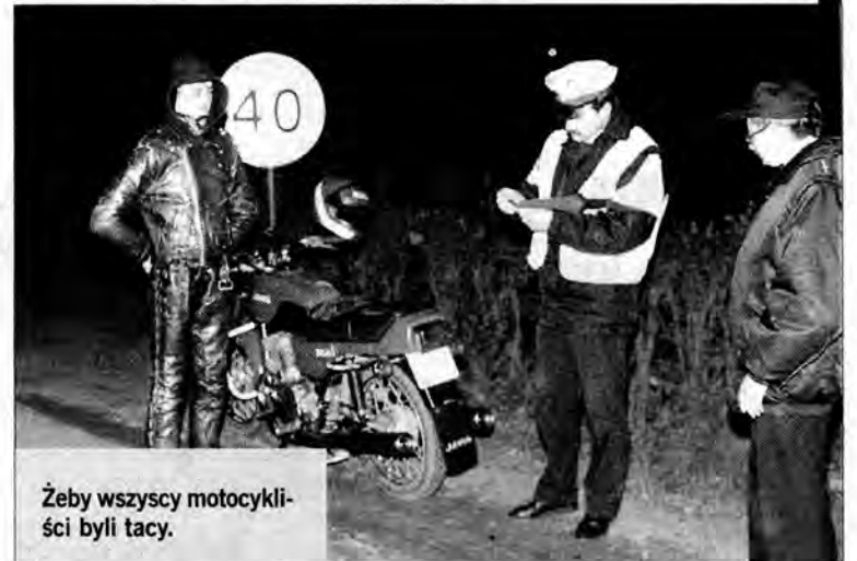
Żeby wszyscy motocykliści byli tacy.

Znowu robimy rundę po mieście. W okolicach poczty rowerzysta na widok radiowozu gwałtownie zjeżdża z drogi i kryje się w cieniu. Okazuje się, że nie ma świateł. Chwilę później zatrzymujemy kolejnego, który jedzie nieoświetlonym rowerem. – Panie władzo, nie nadażam z kupowaniem świateł – tłumaczy się mężczyzna. Wystarczy na chwilę zostawić rower pod sklepem, to zaraz odkręca lampkę. Dochodzi północ i miasto pustoszeje, przejeżdżają jedynie ciężarowe auta przewożące buraki. Zatrzymujemy się w bocznej uliczce. Gdzieś za płotem przeciągle miauczy kot, któremu listopad pomylił się z mar-