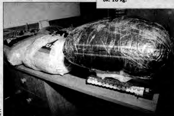
Najcięższy z pakunków ważył ok. 18 kg!

Od około dwóch lat jarosławska Straż Miejska wspólnie z Urzędem Kontroli Skarbowej prowadzi akcje, mające na celu eliminowanie nielegalnych handlarzy alkoholem i papierosami. 14 listopada kolejna kontrola, przeprowadzona tym razem w okolicach dworca PKP, zakończyła się sukcesem. Funkcjonariusze SM zatrzymali dwie obywatelki Ukrainy, które miały przy sobie 110 litrów spirytusu, przelanego do... specjalnych foliowych worków. Nowością jest ich wielkość, gdyż do tej pory najczęściej używane do przemytu czy handlu al-