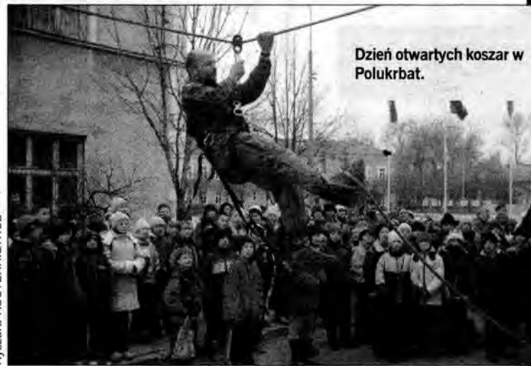
Dzień otwartych koszar w Polukrbat.

Jak wygląda transporter opancerzony, mógł zobaczyć każdy, kto w „dniu otwartych koszar” odwiedził Polsko-Ukraiński Batalion Sił Pokojowych w Przemyślu.