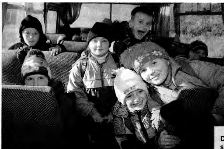
Dzieciaki z oddzielnych filii spotykają się tylko w gimbusie.

Podkarpacka RKCh wspomocze dzieci niepełnosprawne ze szkół integracyjnych