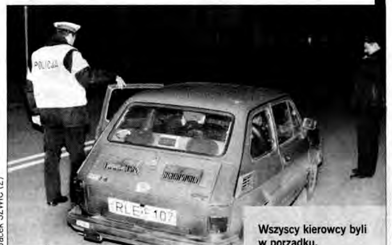
Wszyscy kierowcy byli w porządku.

cem. Iście wiosenna pogoda działa nie tylko na koty. Jeżdżąc różnymi zaułkami, co chwilę spotykamy obejmujące się w cieniu pary. W końcu policjanci zatrzymują do kontroli motocyklistę, który z fasonem zwraca jawę i podjeżdża do radiowozu. Lśniący motor, elegancki kombinezon, zero alkoholu. Żeby wszyscy motocykliści byli tacy – wzdycha policjant.