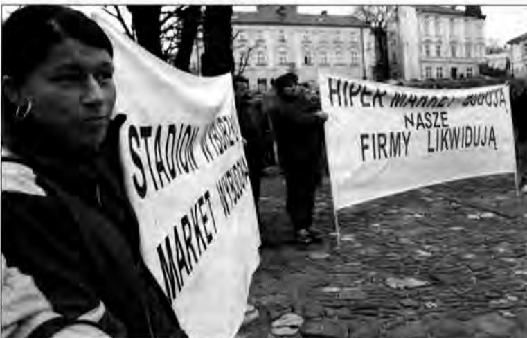
Pikieta pod UM w Przemyślu zgromadziła kilkadziesiąt osób przeciwnych budowie hipermarketu.

Istotą sporu i protestu nie są wyżej wymienione decyzje, lecz opinia