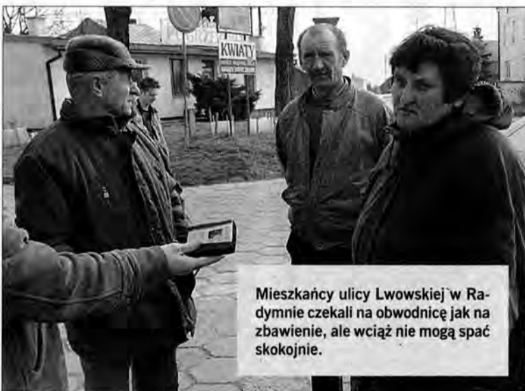
Mieszkańcy ulicy Lwowskiej w Radymnie czekali na obwodnicę jak na zbawienie, ale wciąż nie mogą spać spokojnie.

Mieszkańcy Radymna daremnie liczyli, że oddana do użytku obwodnica przywróci im spokojny sen.