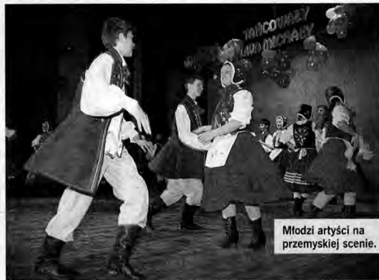
Młodzi artyści na przemyskiej scenie.

Drugi dzień Konfrontacji przyniósł rekordową liczbę prezentacji (40) i również rekordową liczbę widzów. Nic dziwnego, bo co roku zwiększa się różnorodność prezen-