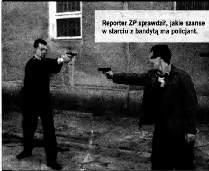
Reporter ŻP sprawdził, jakie szanse w starciu z bandytą ma policjant.