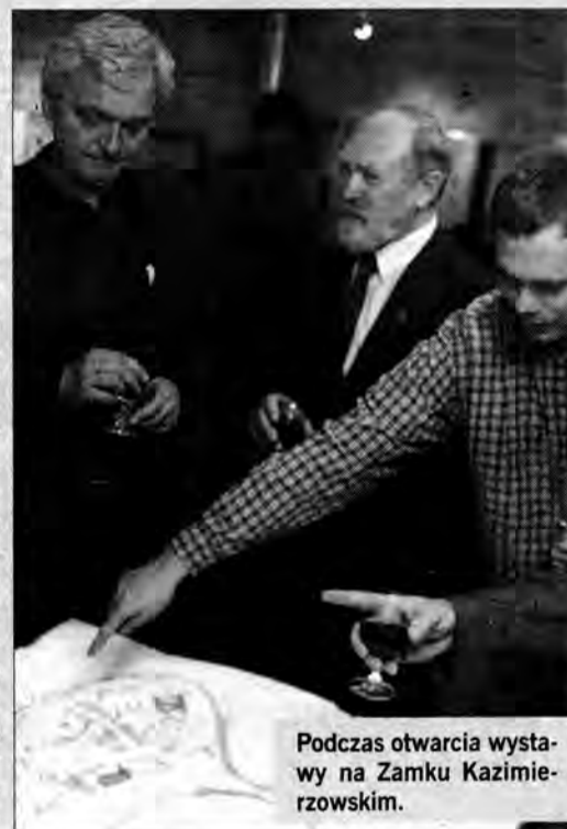
Podczas otwarcia wystawy na Zamku Kazimierzowskim.

Wystawa zorganizowana została dzięki współpracy władz miasta Przemyśla z Politechniką Krakowską, a dodatkowym pretekstem do niej jest umowa partnerska podpisana pomiędzy Kamieńcem Podolskim a Przemyślem. Wystawa czynna będzie do 15 maja. (R)