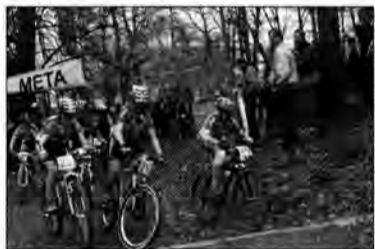
Na trasie wyścigu.

W niedzielę, 14 kwietnia, w Parku Miejskim w Przemyślu odbyły się wyścigi w kolarstwie górskim MTB o Puchar Prezydenta Prze-