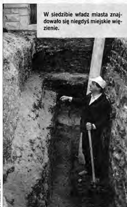
W siedzibie władz miasta znajdowało się niegdyś miejskie więzienie.

Istniało duże prawdopodobieństwo, że wykopane szczątki należą do jakiegoś nieszczęśnika, który był więziony przed laty w ratuszowych lochach. W siedzibie władz miasta znajdowało się niegdyś miejskie więzienie, w czasie wojny ratusz był siedzibą niemieckiej żandarmerii i policji. Po wojnie mieściła się tu komenda powiatowa milicji. Znalezione