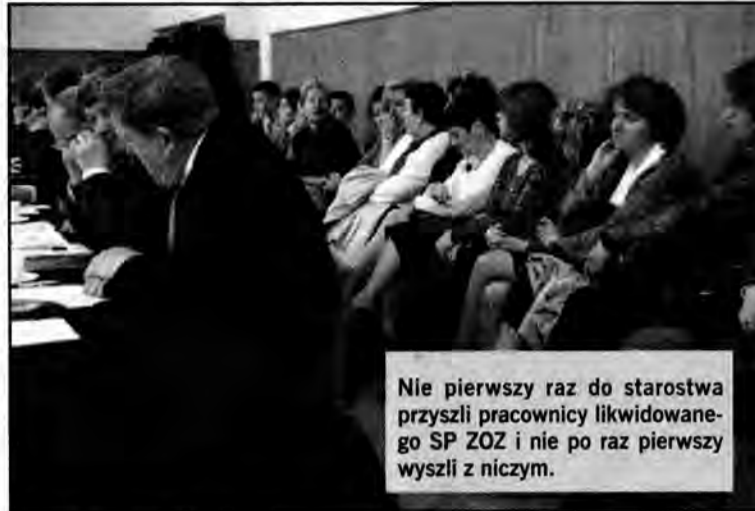
Nie pierwszy raz do starostwa przyszli pracownicy likwidowanego SP ZOZ i nie po raz pierwszy wyszli z niczym.