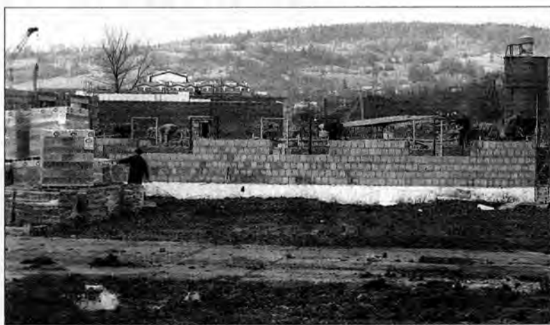
Według planu koniec budowy przewidziano na wiosnę przyszłego roku.

Bieszczadzki Oddział Straży Granicznej chroni 370 km granicy, w tym 230 z Ukrainą i 133 ze Słowacją. Standard europejski to nie więcej niż 20 km przypadających na jedną placówkę. Tyle wypadnie na strażnicę budowaną w Hwnnikach.