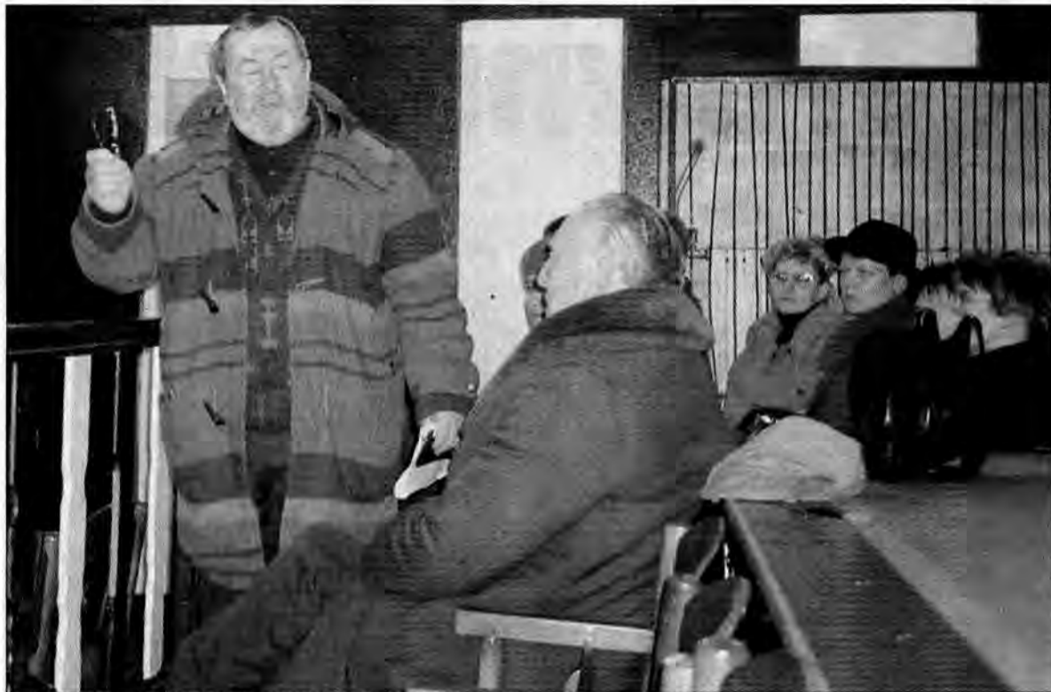
Rodzice dzieci z likwidowanych szkół protestują przeciwko oszczędnościowym planom Zarządu Gminy Oleszyc.