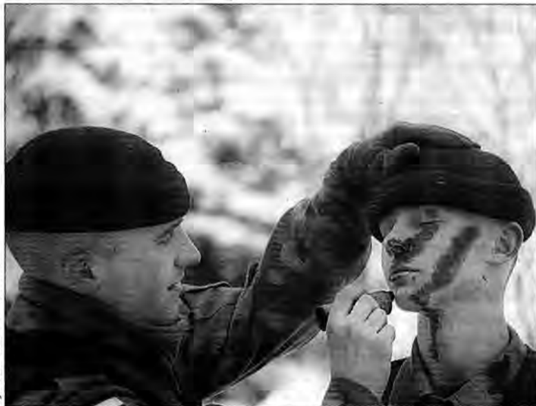
Maskujący make-up harcerzy z „Gromu”.

Drużyna powstała 1 stycznia 1996 roku. Wcześniej była to dru-