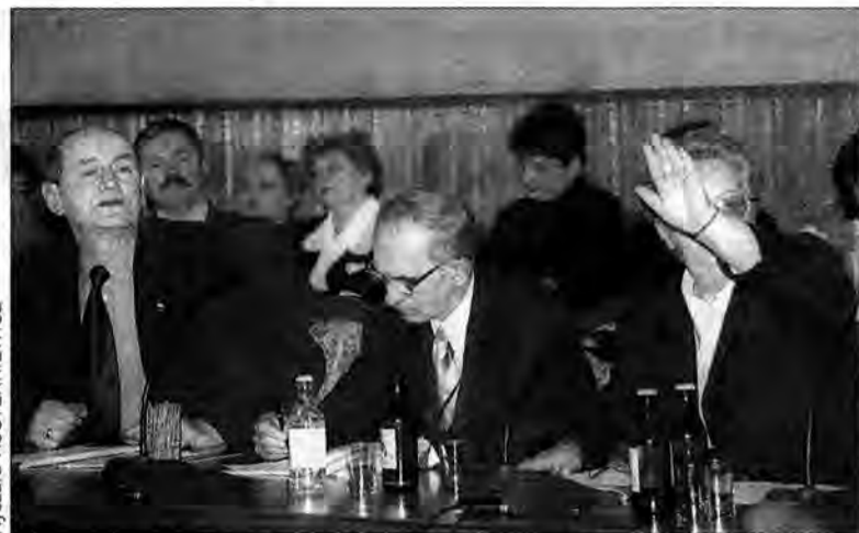
Od kilku miesięcy każde głosowanie w przemyskim samorządzie to wielka niewiadoma.

Na spłatę długu radni zaplanowali 800 tys. zł.