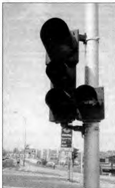
Warunkowy skręt przy czerwonym świetle możliwy jest tylko przy podświetlonej na zielono strzałce.

Przypomnę, że od miesiąca obowiązuje również zakaz zjazdu ze skrzyżowania i ronda przy czerwonym świetle oraz zakaz zatrzymywania się także na chodniku za ustawionym znakiem „zakaz zatrzymywania się”, chyba, że pod