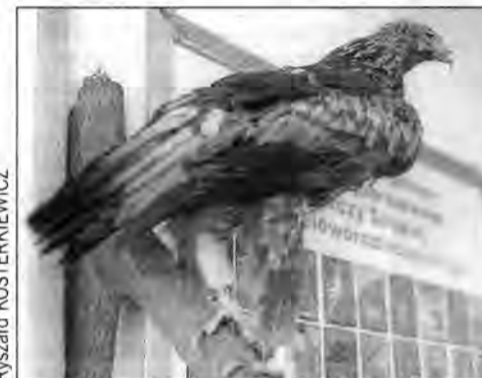
Ten młody orzeł przedni został znaleziony martwy pod linią wysokiego napięcia na terenie Nadleśnictwa Narol. Na nodze ma obrączkę, założoną przez ornitologów fińskich.