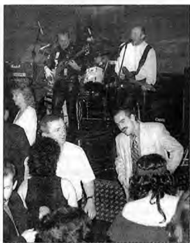
Żuki najczęściej swoje koncerty zaczynają od Beatlesów.

Rozmowa z liderami zespołu Żuki, grającego muzykę lat 60. i 70.