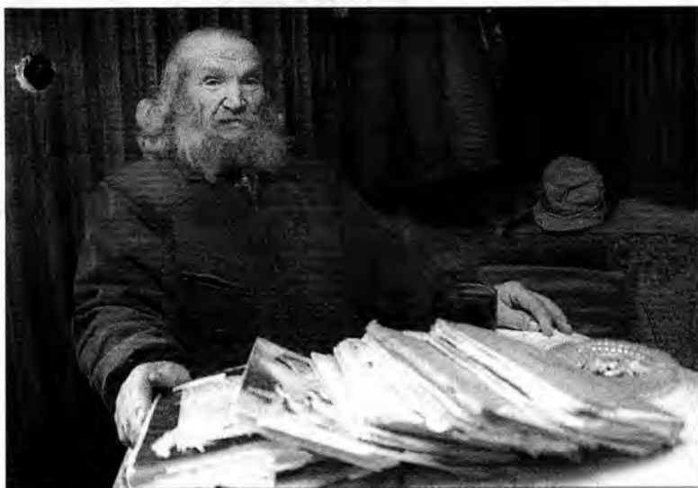
Zaczął w 1967 roku i tak dzień po dniu dokonuje nowego wpisu.