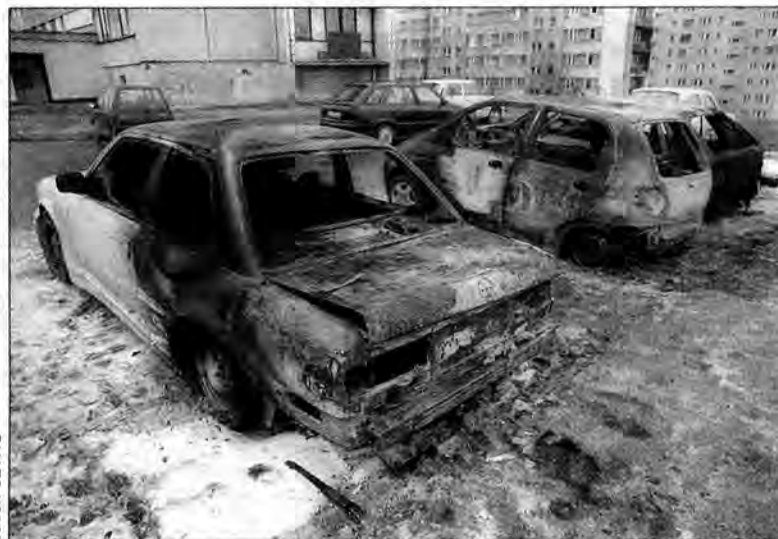
Wraki wypalonych aut na parkingu osiedla Monte Casino.

Przed północą mieszkańców bloku obudził ciągły sygnał samochodowego klaksonu. Mieszkający od strony parkingu zauważyli przez okna płomienie na tylnej masce BMW. Zrobił się ruch, bieganie, szukanie właściciela. Tymczasem ogień błyskawicznie narastał i płomienie ogarnęły prawie całe auto. Tej nocy od zachodu wiał bardzo mocny wiatr, który przeniósł ogień na matyza, zaparkowanego niecałe dwa metry od BMW, a w następnej kolejności zapaliła się skoda felicia.