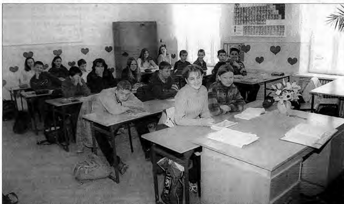
Od pierwszego września 2002 r. również absolwenci Gimnazjum nr 5 trafią do przekształconych szkół.

Taką szansę mają stworzyć m.in. trzyletnie licea profilowane. Władze samorządowe każdego powiatu, które są odpowiedzialne za przeprowadzenie zmian, wspólnie z dyrektorami szkół będą wybierać wśród pięciu, określonych przez Ministerstwo Edukacji Narodowej, profili: proakademicki (obejmujący kształcenie w zakresie ogólnym), techniczno-technolo-