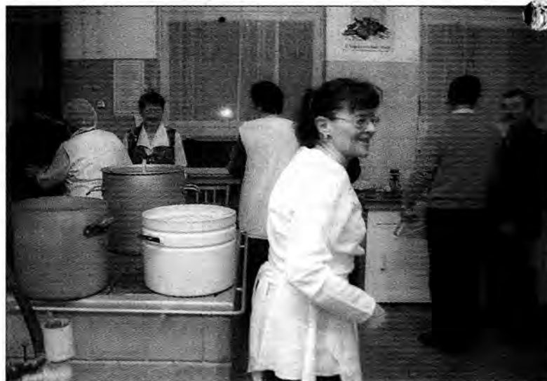
Poszło 30 kilogramów szynki, 27 – schabu, kilkaset jaj, 5 wiader śledzi.

WSPANIAŁA ZABAWA DO BIAŁEGO RANA W II LO W PRZEMYŚLU