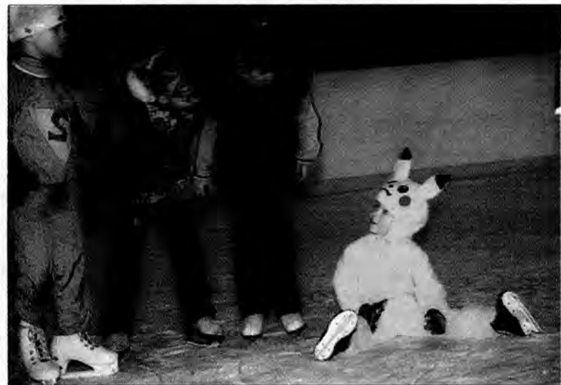
Karnawał na lodzie? Ależ tak!

Stowarzyszenie podstawy finansowania buduje na działalności gospodarczej. Nie jest ona szeroka, uzyskane środki przeznacza się na dopłaty do organizowanych przez stowarzyszenie kolonii dla dzieci i wycieczek zagranicznych. 2001 r. zainaugurowano kolejną rundą piłkarskich „piątek”. Z-ak