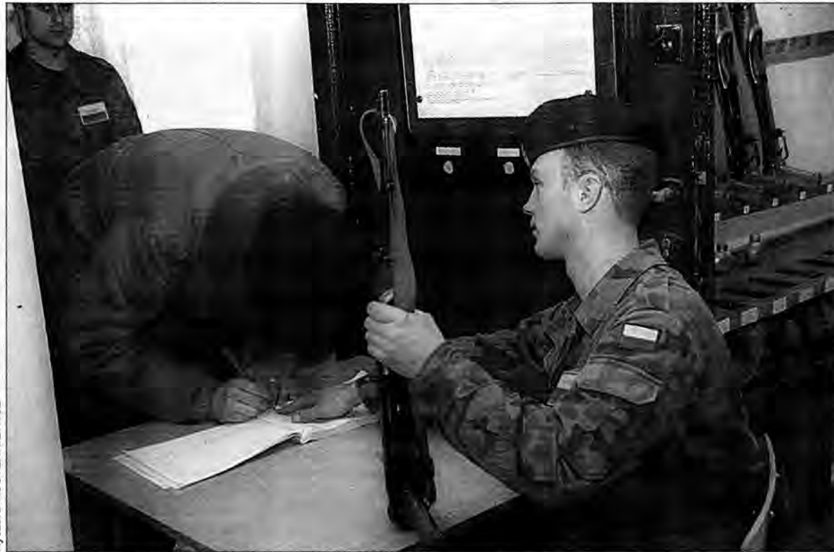
W wojsku dostać broń do ręki jest łatwiej niż w cywilu.

Do przemyskiej jednostki trafił kiedyś żołnierz z wypadku samochodowym, z zaleceniem lekarskim, że ma... leżeć. Biedak leżał więc, gdy