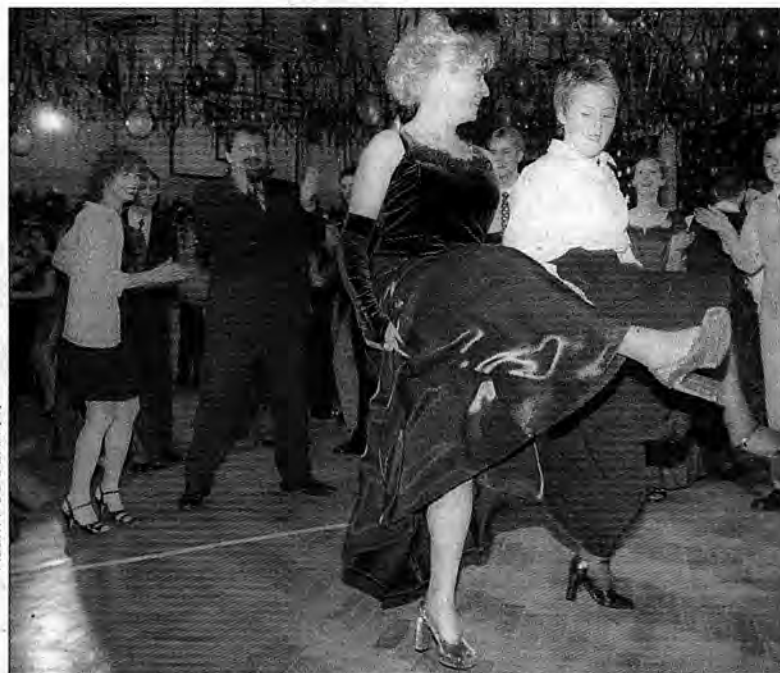
„Prawy do lewego” – pani profesor do uczennicy.

Młodzi dynowianie mają ambicję, chodzą do dobrej szkoły, notują wiele ponadprzeciętnych osiągnięć. Trochę szaleni i zarazem odpowiedzialni. Wśród tych emocji