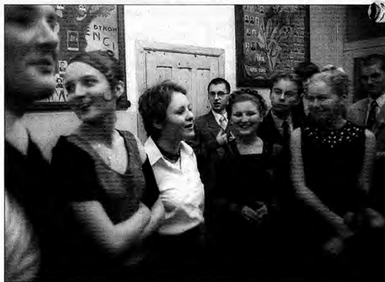
I co dalej maturzysto?