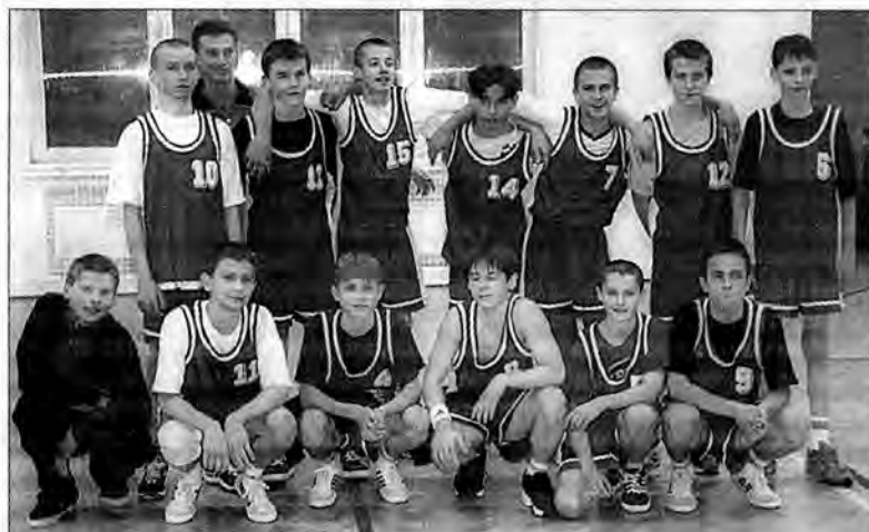
Gimnazjali koszykarscy zwycięzcy z Radymna.

Przez trzy dni, od 22 do 25 stycznia, w radymniańskiej hali odbywały się powiatowe zawody w koszykówce, których organizatorem był Powiatowy Szkolny Związek Sportowy w Jarosławiu.