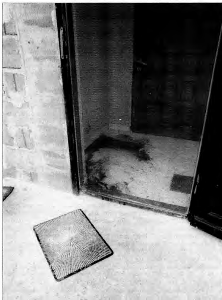
Drzwi wejściowe, przy których umierała matka.