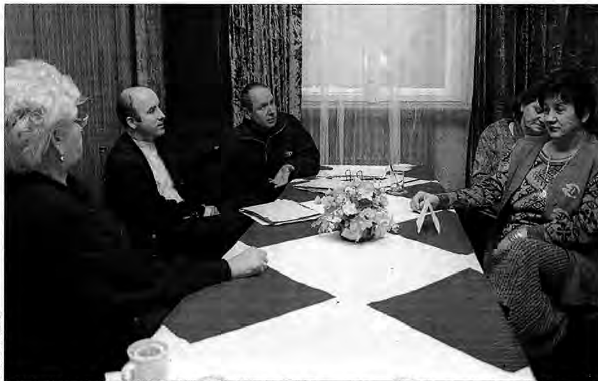
Członkowie Stowarzyszenia Gastronomów i Handlowców Ziemi Przemyskiej naradzają się nad uchwałą o prohibicji.

Członkowie przemyskiego stowarzyszenia gastronomów i handlowców zwrócili też radnym uwagę, iż – uchwalając prohibicję – zwiększają obroty melin: „Dni 14, 15, 16 kwietnia będą dla tych ludzi prawdziwym eldorado, a ucierpią tylko pracownicy legalnie działających placówek, którzy będą zmuszeni pójść na trzydniowe urlopy bezpłatne, co jeszcze bar-