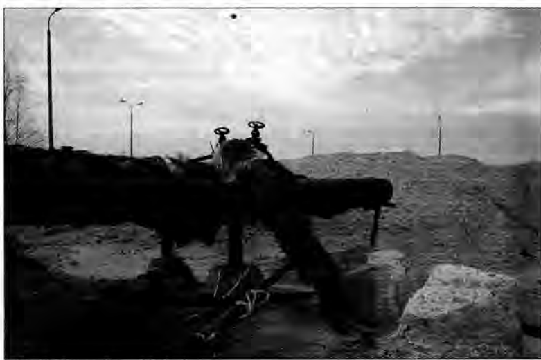
„Złote” góry w Baszni koło Lubaczowa.