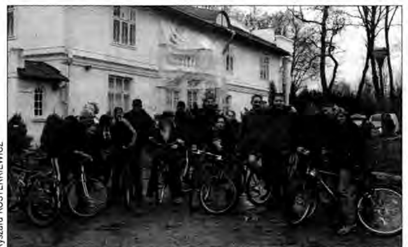
Podczas rowerowej wycieczki do Arboretum w Bolestraszczyce.

W piątek, 7 kwietnia, w ZST odbyło się podsumowanie wspólnej