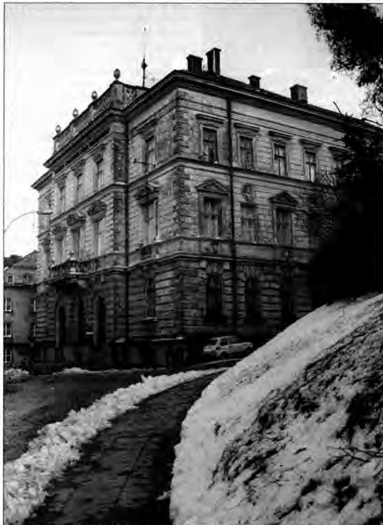
Pałac biskupów greckokatolickich, w którym mieści się Muzeum Narodowe Ziemi Przemyskiej.

Pałac biskupów greckokatolickich, zajmowany obecnie przez Muzeum Narodowe Ziemi Przemyskiej, wybudowany został w latach 1898-1900 za pieniądze pochodzące z Galicyjskiego Funduszu Religijnego. Był to fundusz kościelny, na który składały się dobra trzech obrządków: rzymskiego, greckokatolickiego i ormiańskiego. Z niego finansowano budowę dla całego Kościoła bez względu na obrządek. Budynek na pl. Czackiego 3, zaprojektowany przez R. Halickiego, został zbudowany na wniosek kurii greckokatolickiej. Na mocy art. XXIV Konkordatu pomiędzy Stolicą Apostolską a Rzeczpospolitą Polską, podpisanego w roku 1925, Polska uznała prawo osób prawnych kościelnych i zakonnych do wszystkich majątków ruchomych i nieruchomości, kapitałów, dochodów oraz innych praw, które te osoby prawne posiadały wtedy na obszarze państwa polskiego. Budynek