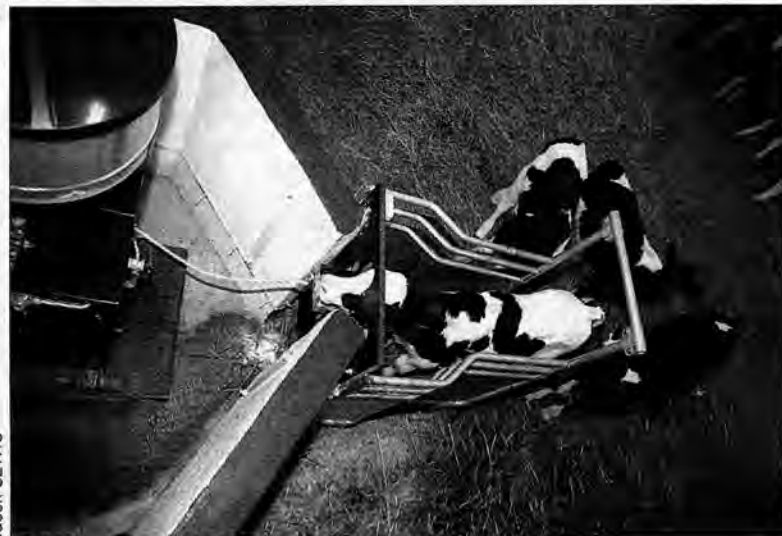
Elektroniczna „upajalnia” cieląt.

Urządzenia wykonała, dostarczyła i zamontowała szwedzka firma o stuletniej tradycji Alfa Laval Agri, działająca w Polsce od 50 lat. Obora przystosowana jest na przebywanie 150 krow. Na razie jest ich