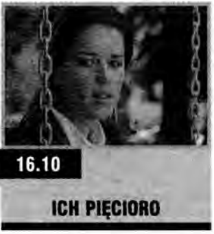
16.10 ICH PIĘCIORKO