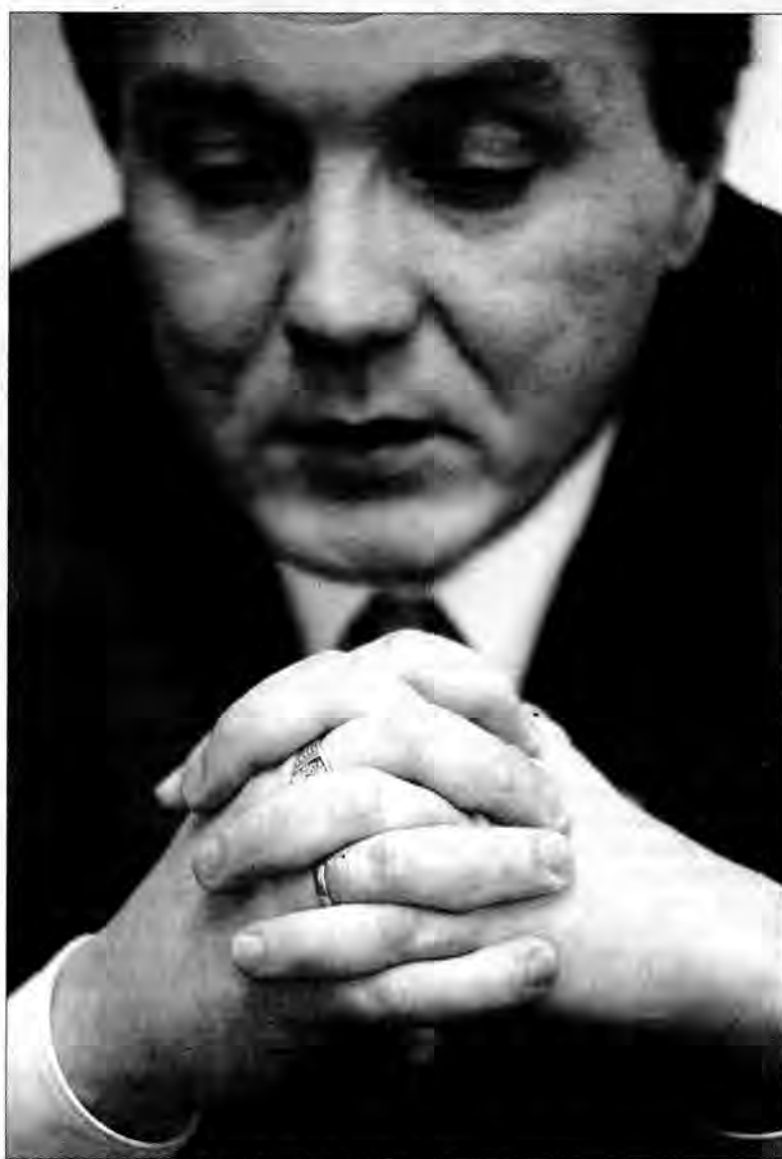
– Na swój temat słyszałem już wiele dziwnych rzeczy.

– To znaczy, ja nie wiem skąd osoby te mają takie pomysły. Natomiast stwierdzam jednoznacznie i to już raz powiedziałem i więcej powtarzać nie będę: czegoś takiego nie ma, nie było i nie będzie. Więc jeżeli zamierza pan ten temat dalej ciągnąć, to szkoda mojego i pańskiego czasu. Natomiast z koncesjami jest tak, że ktoś musi je dostać, a ktoś inny nie. To wynika z określonych zapisów. Problem jest chociażby w tym układzie limitowanym. W tej chwili jest tak, że o dwa zezwolenia stara się kilkanaście osób. Jasne jest, że wśród tych, którzy nie dostaną, będzie niezadowolone i być może, co niektórzy będą sądzić, że inni dostali, bo coś tam. Na swój temat słyszałem już wiele dziwnych rzeczy i jak do tej pory ja się z tego śmieję. Ile to nieruchomości posiadają, w ilu mia-