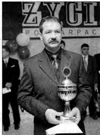
Zwycięzca naszego Konkursu-Plebiscytu długo nie mógł dojść do siebie.