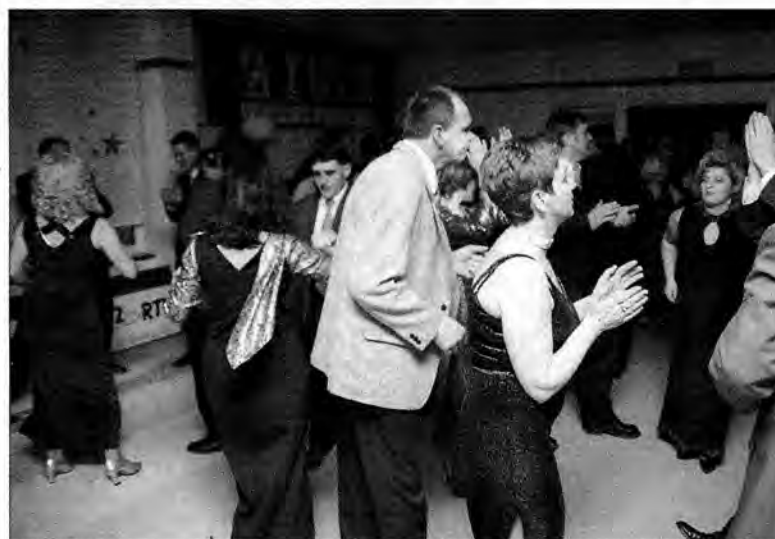
... wywijali i starsi, i młodszy.