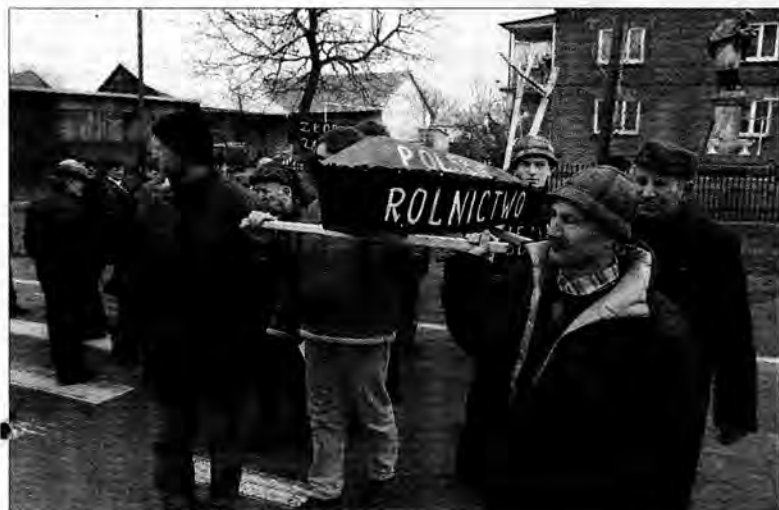
Samoobrona w Świlczy.

We wtorek, 8 lutego, przy dźwiękach Roty , w rytmie disco polo, około 80 rolników Samoobrony weszło na trasę międzynarodową E-4 w Świlczy pod Rzeszowem.