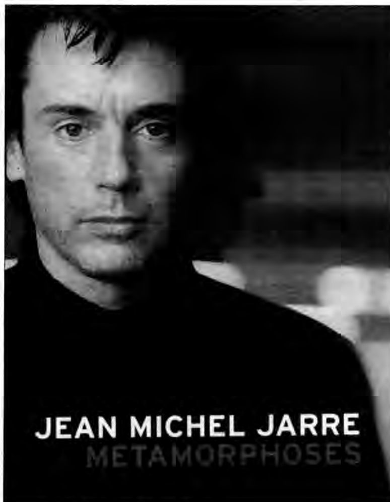
JEAN MICHEL JARRE METAMORPHOSES