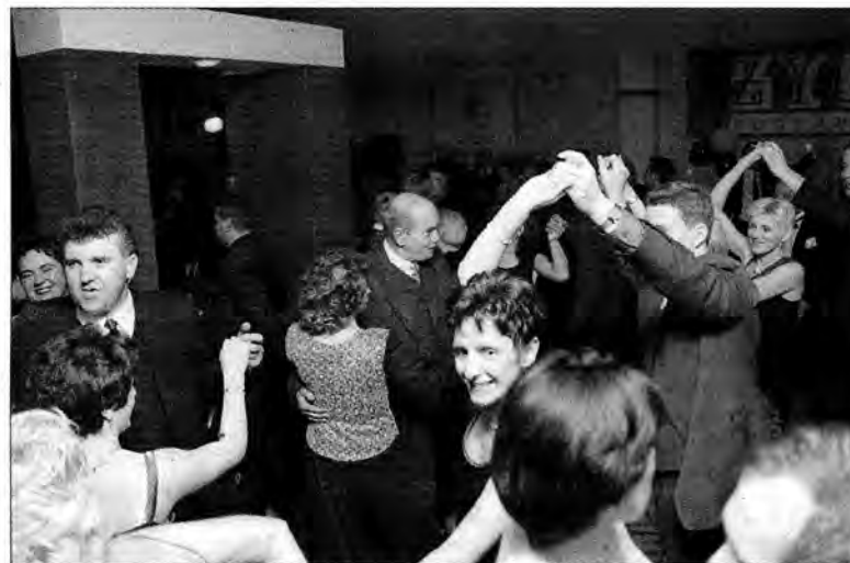
Trudno było się wcisnąć w rozentuzjzmowany taneczny tłum.

dzięki znakomitej grupie „Stellaris” z Leżajska, która zmiennością muzycznych klimatów potrafiła rozruszać każdego.