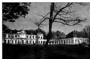
Niszczący pałac w Narolu.

Pałac w Narolu należy do najświetniejszych osiemnastowiecznych magnackich rezydencji w Małopolsce Wschodniej. Zbudował go Feliks Antoni Łoś herbu Dąbrowa, generał wojsk koronnych, wojewoda pomorski w drugiej połowie XVIII w.