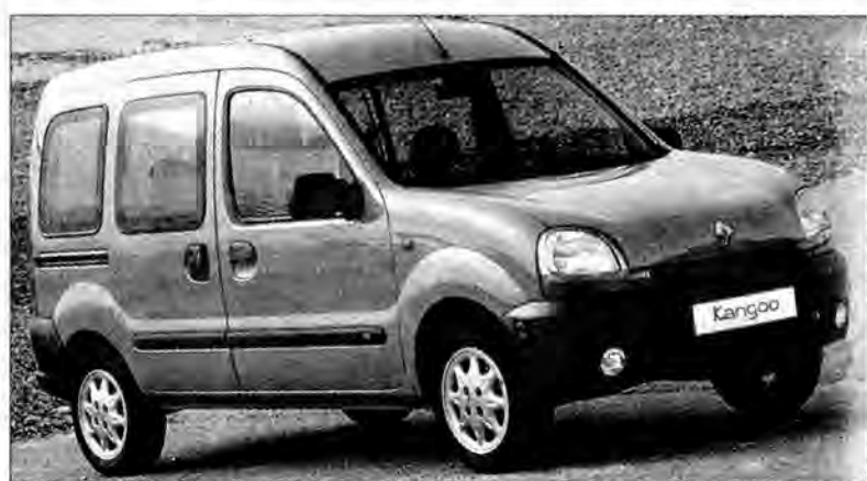
Lider w segmencie aut użytkowych.