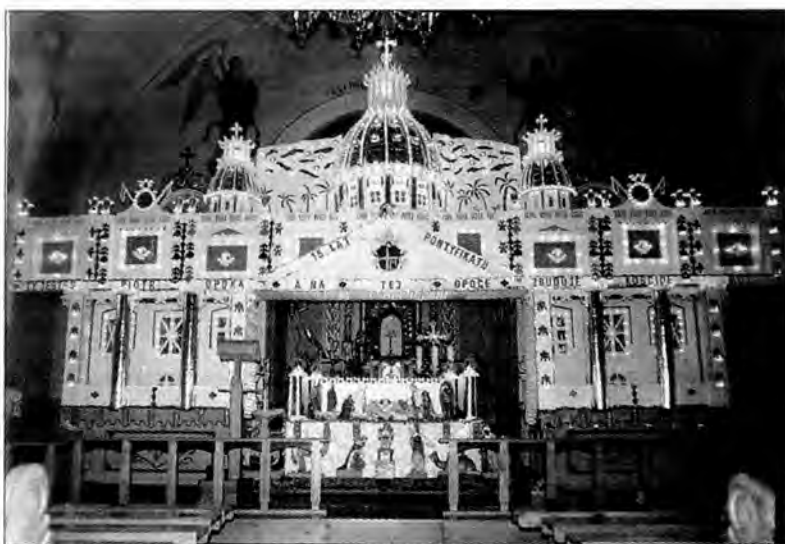
Słynna bruśniańska szopka.

Mieszkańców Brusna zbulwersował niedawno artykuł w lokalnym piśmie, w którym znalazło się określenie, że „w Bruśnie wrony zawracają”.