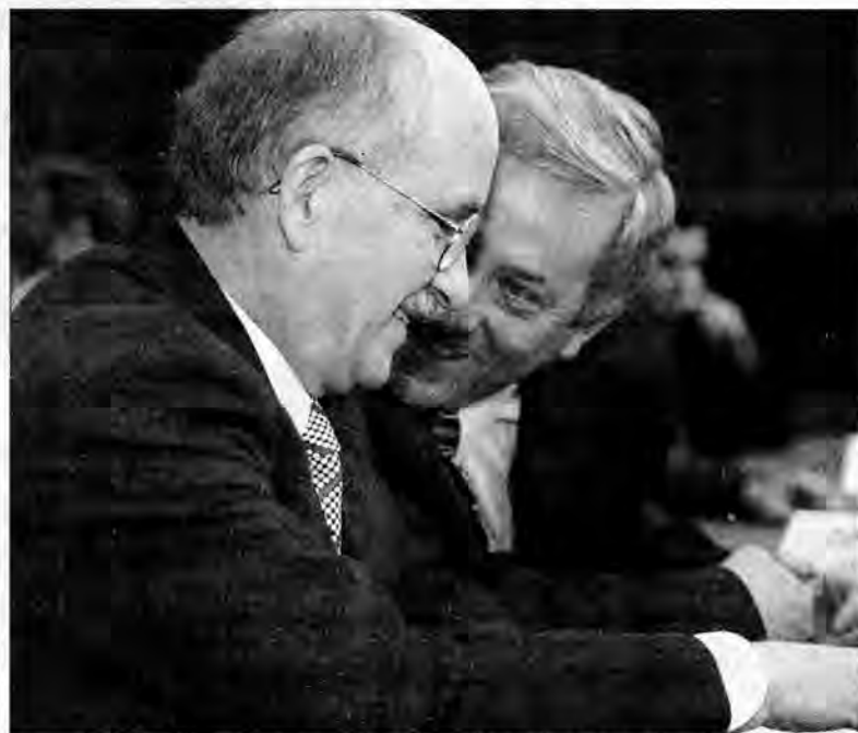
Minister Emil Wąsacz i wojewoda Zbigniew Sieczkoś.

Sejmik województwa podkarpackiego wciąż nie określił swojej polityki zagranicznej, chociaż nad uchwałą w tej sprawie głosował cztery razy. Samorząd wojewódzki stał się za to właścicielem gruntów wokół lotniska w Jasionce.