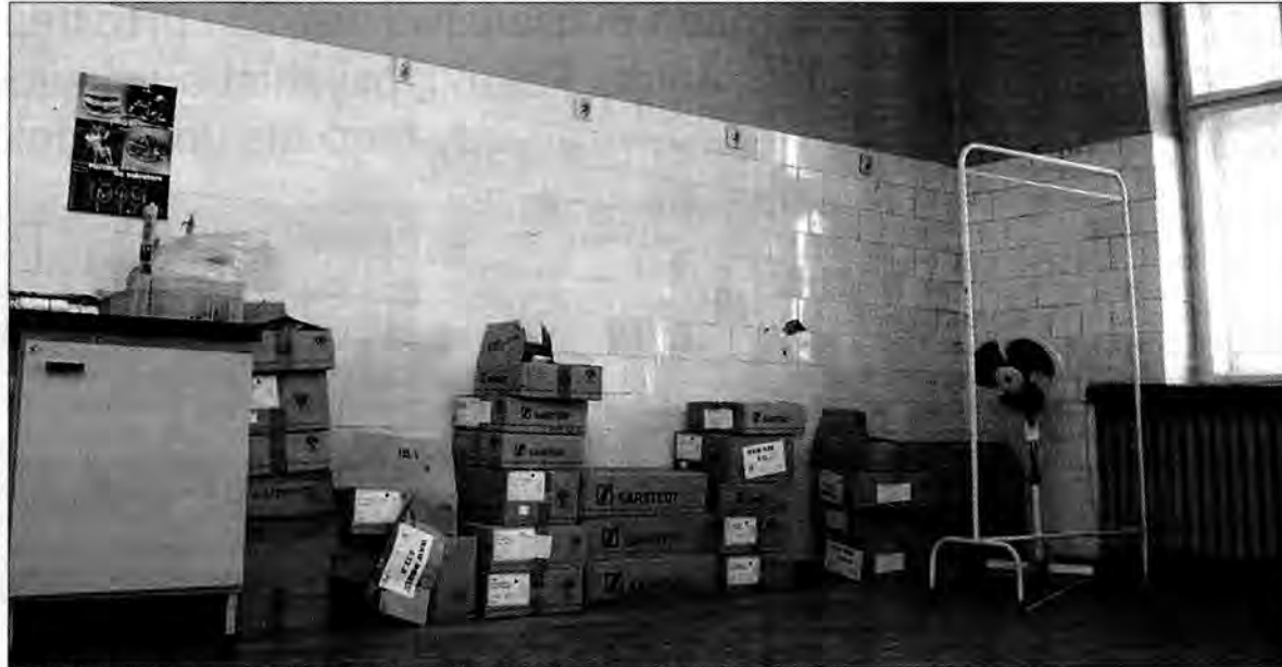
Byłe laboratorium – podobny los czeka laboratoria w gminach.