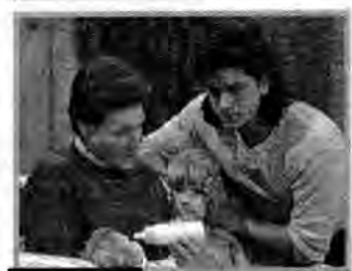
16.15 PEŁNA CHATA