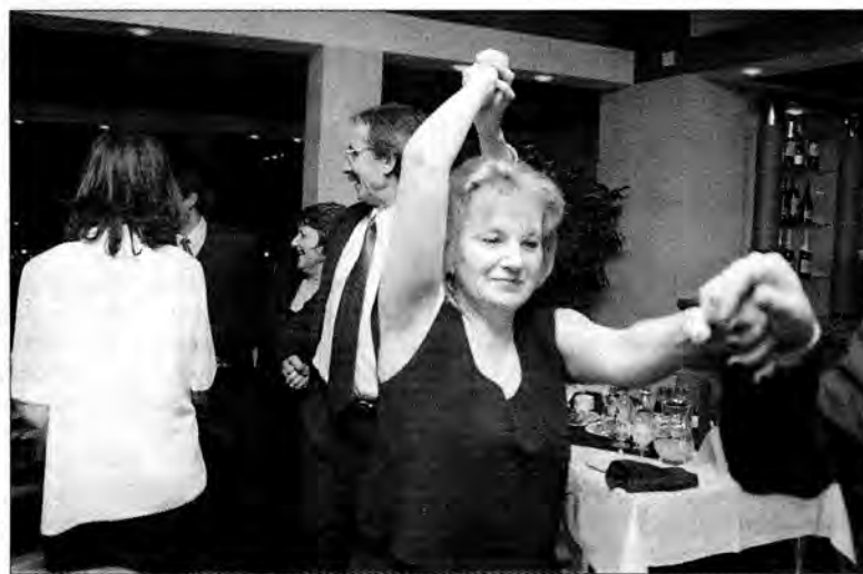
Na parkiecie nie było różnic...

Nic już nie stało na przeszkodzie, aby bal zaczął się na całego. Gdy tylko poczęły rozbrzmiewać pierwsze taktę muzyki, miejsca przy stolikach wyludniały się. Zabawa była wspaniała. A to przede wszystkim