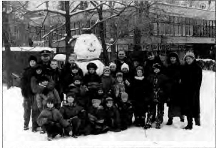
Dzięki inicjatywie Klubu „Salezjańskie” dzieci z osiedla nie nudziły się na feriach.