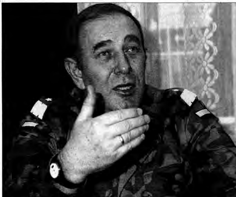
Gen. bryg. Józef Rzemień.

Proces zmierzający do rozformowania 14. Brygady Pancerniej Ziemi Przemyskiej i połączenia części jej jednostek z 21. Brygadą Strzelców Podhalańskich już się rozpoczął. W Przemysłu, Żurawicy i Jarosławiu wyznaczone zostały oddziały, które przejdą pod nowe dowództwo. Na bazie tego co zostanie, utworzona będzie 14. Brygada Obrony Terytorialnej.