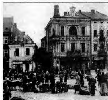
Rynek przemyski, 1930.

Pod koniec grudnia 1999 r. ukazała się książka Macieja Daleckiego Przemyśl w latach 1918-1939. Przestrzeń, ludność, gospodarka wydana nakładem przemyskiego Archiwum Państwowego.