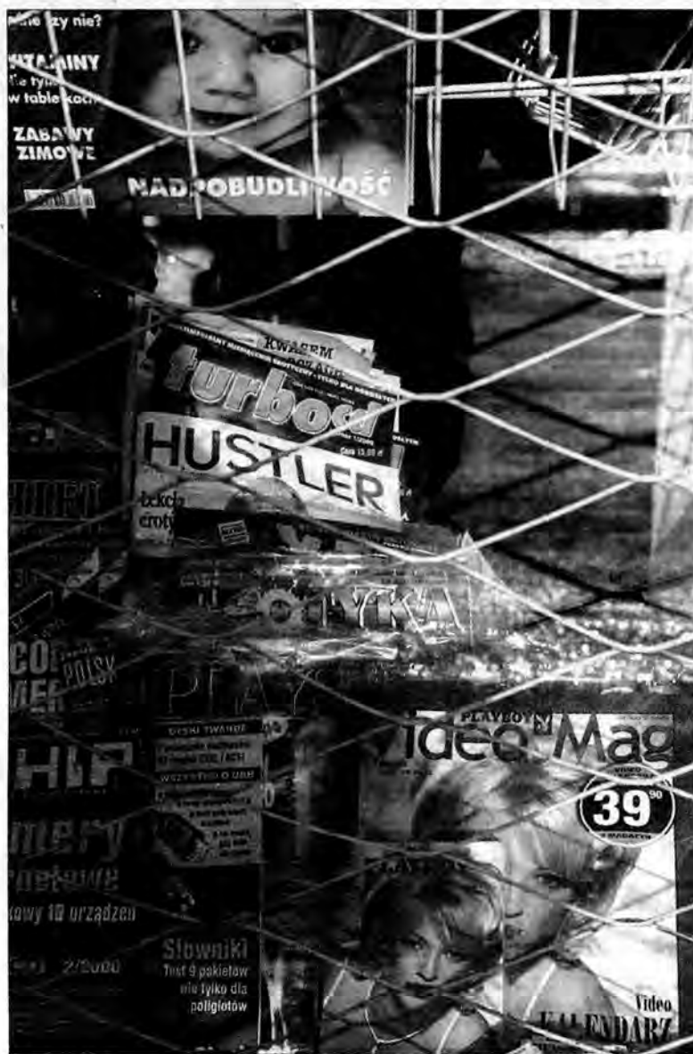
„Te rzeczy” można kupić prawie w każdym kiosku.