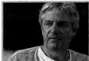
00.05 PORTRET A. ŻUŁAWSKIEGO