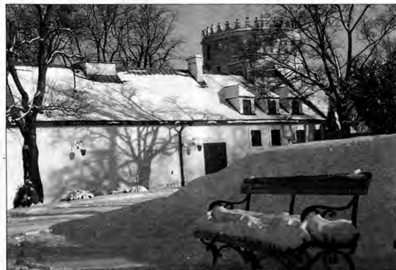
Czy austriaccy turyści zaczną tłumnie odwiedzać Przemysł?

Od 20 do 23 stycznia odbyły się we Wiedniu Międzynarodowe Targi Turystyczne. Na polskim stoisku, przygotowanym przez Polską Agencję Promocji Turystyki, swoją ofertę przedstawił także Przemysł, reprezentowany nad Dunajem przez pracowników Wydziału Kultury, Sportu i Turystyki UM oraz Ośrodka Informacji Turystycznej.