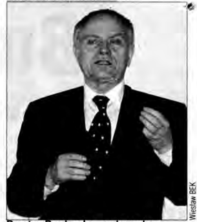
Dmytro Pawlyczko, ambasador Ukrainy w Polsce.