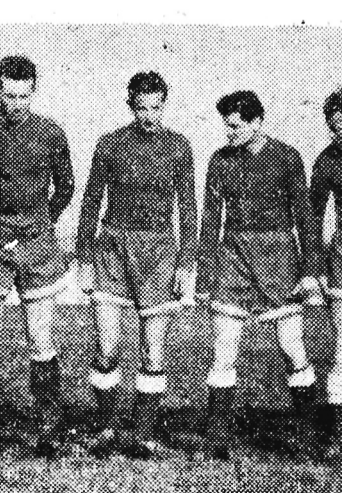
Na zdjęciu: Piłkarze Stali Mielec