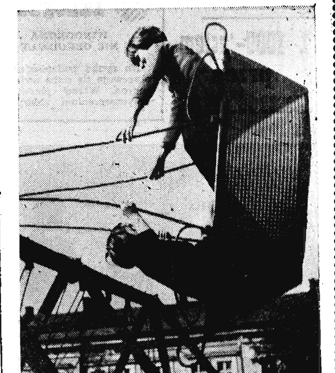
Znowu do Rzeszowa zawitało „wesole miasteczko” w małym wydaniu. Huśtawki cieszą się jak zwykle największym powodzeniem...