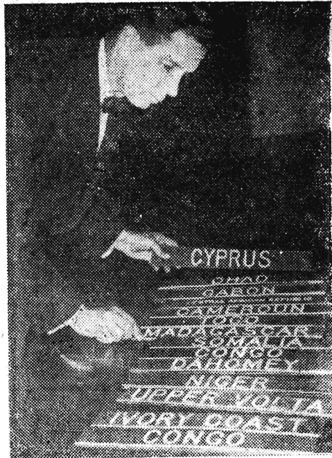
XV SESJA ZGROMADZENIA OGÓLNEGO NZ

Do srody włącznie trwają uroczystości 15-lecia istnienia Teatru im. Wandji Siemaszkowej w Rzeszowie. Jak już informowaliśmy, w czasie sobotniego przedstawienia „Wojny i pokoju” zespół teatralny został obdarowany wiązkami kwiatów, od przyjaciół miłośników sztuki, dyrekcji rzeszowskich zakładów pracy i organizacji społecznych.