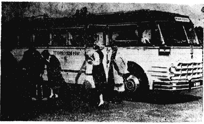
Wiedeń przygotowuje się do wizyty premiera Chruszczowa. M. in. przygotowano specjalny autobus. Nowocześnie wyposażony wóz posiada połączenia telefoniczne, aparat telewizyjny oraz wbudowany bar. Na zdjęciu: Autobus, którym premier Chruszczow i towarzyszące mu osoby będą zwiedzać Austrię.