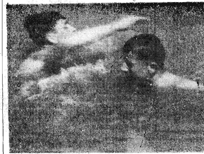
Na zdjęciu: Zwolennicy zimnej kąpeli przystępują już do „treningów“.

Sezon letni w pełni. Z każdą niedzielą w Olsztykach nad Wisłokiem pełno amatorów świeżego powietrza, słońca i beztrudnego wypoczynku.