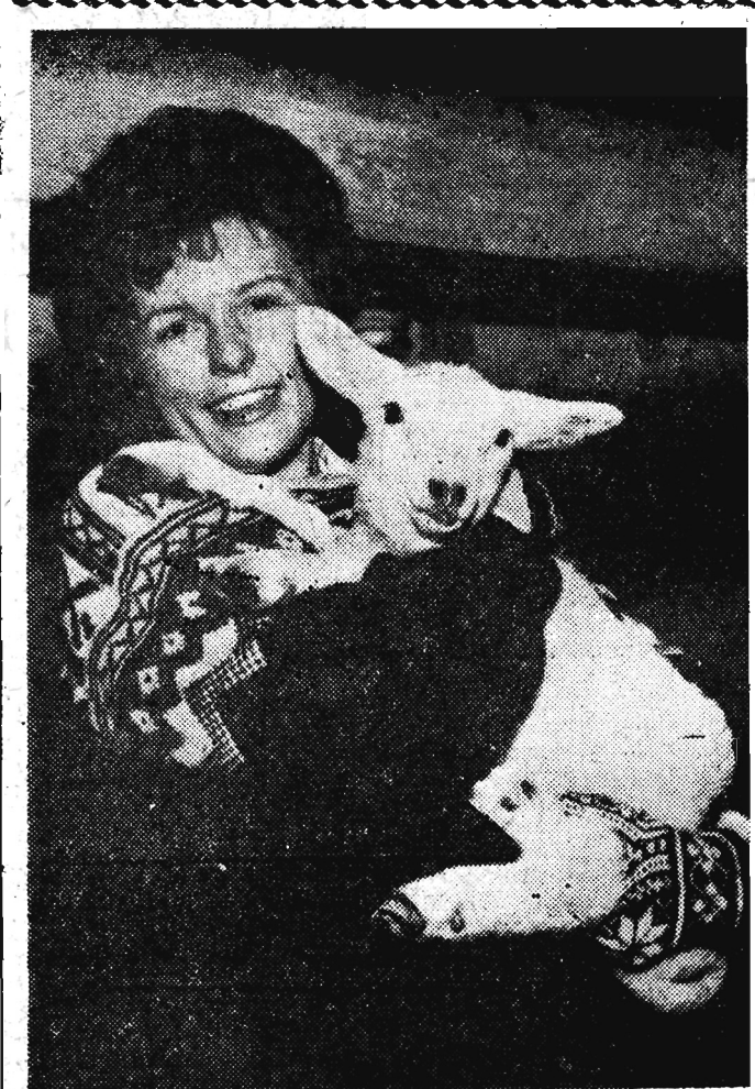
Małe jaguśki i ta miła, młoda Norweżka tworzą razem ładną parę. Dziewczyzna jest z miasta ale tak jak wiele innych dzie wcząt stara się zawsze urlop spędzać na wsi.

Jest to umowa ramowa zapowiadająca wzrost wymiany w dziedzinie oświaty, sztuki i nauki. Szczegóły zostaną opracowane przez dwustronną komisję. Po podpisaniu umowy odbyły się rozmowy polityczne, które trwały dwie godziny. W południe minister Rapacki przyjęty został na audyencji przez króla Danii Fryderyka IX. Na audyencji obecny był również minister Krag. Następnie goście polscy byli (Ciąg dalszy na str. 2)