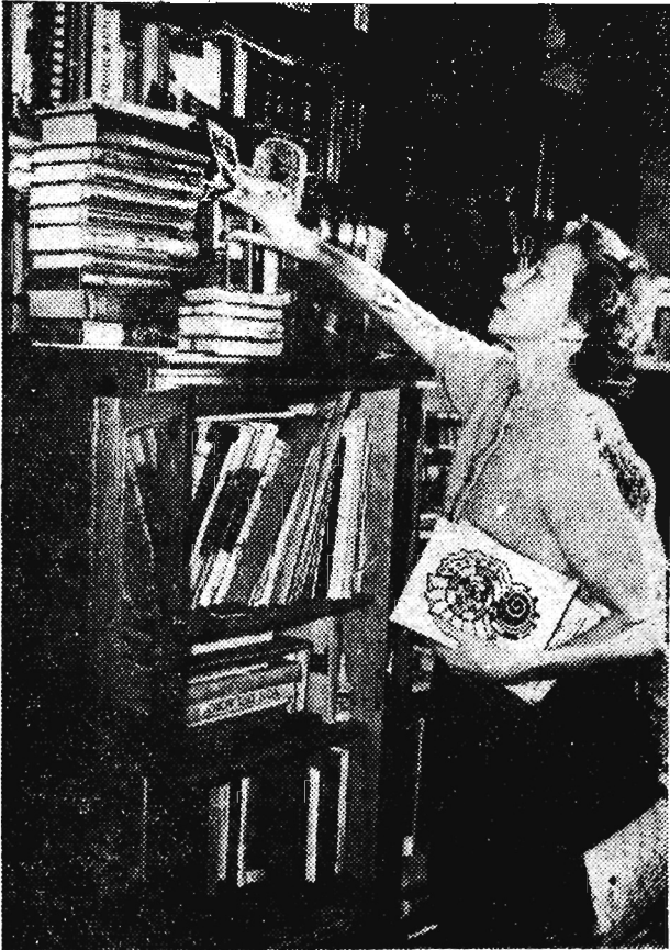
Primaballerina światowej sławy Galina Ułanova w zaciszu domowym