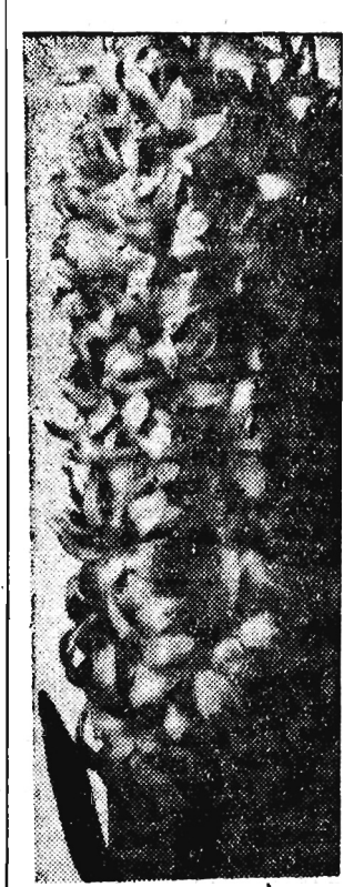
W cieplarniach zakwitły hiacyncy, które jak wiadomo styną z cudownej woni.

Organizacje partyjne podległe KG w Jedliczu, do niedawna słabe, nie tylko usprawniły swą pracę, podniosły na wyższy poziom życie wewnątrzpartyjne, ale zainteresowały się także zagadnieniami gospodarczymi. Nie do radości należą przykłady, że właśnie organizacje partyjne stały się inspiratorami kazyfikacji wsi, rozbudowy szkół, itp. przedsięwzięć na wsi.