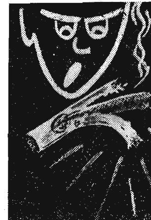
obywatel, który to pierwszy uczynił do dziś dnia nie może pozbyć się czkawki. jes.

Jeden z obywateli naszego grodu zakupił w kiosku „Ruchu” paczkę papierosów „SPORT” z Krakowskiej Wytwórni Papierosów, Nr. 26015. Zapałił pierwszego i jak się zaciągnął to... „paznokcie u nóg stanęły mu dęba”, bo wiodocnie dla wzmocnienia aromatu dodano do tytoniu 10 cm taśmy gurtowej. Cenę eksponat można oglądać codziennie w godzinach 10—12 w Redakcji „Nowin”. Radzimy jednak nie zaciągać się mocno, gdyż