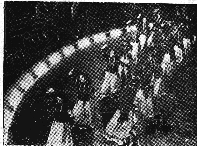
W sali koncertowej im. P. Czajkowskiego odb. l się występ zespołu tańca ludowego „Bachor“.