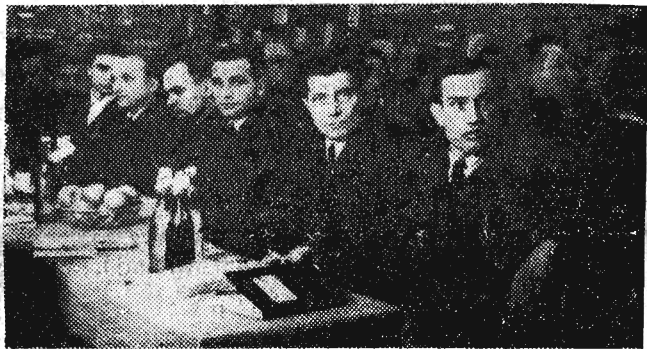
Ogólny widok sali obrad