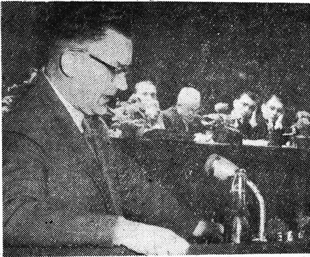
Przemawia wicepremier Piotr Jaroszewicz