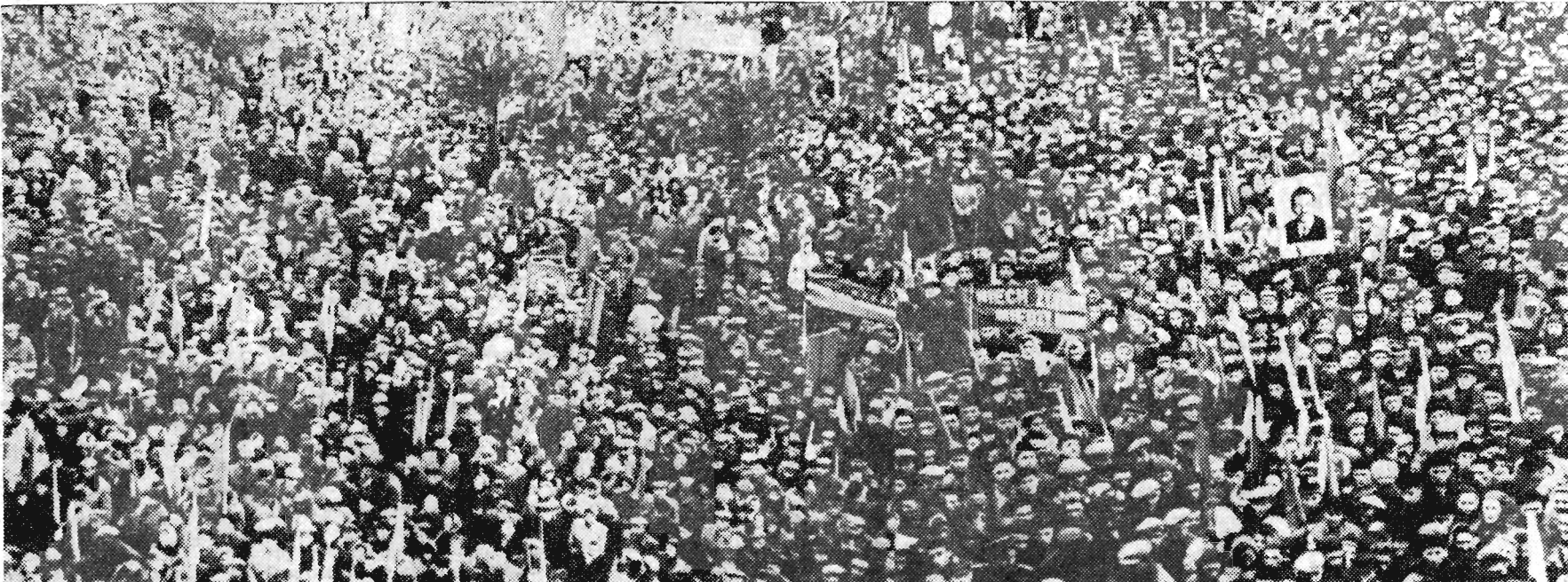
Na placu Zwycięstwa w Rzeszowie w dniu 5 bm

Wierzymy, że realizując wskazania XII Plenum KC PZPR, spełniamy podstawowy obowiązek wobec własnej ojczyzny i pomagamy w walce proletariatu całego świata o szczęśliwą przyszłość ludzkości i pokój między narodami.