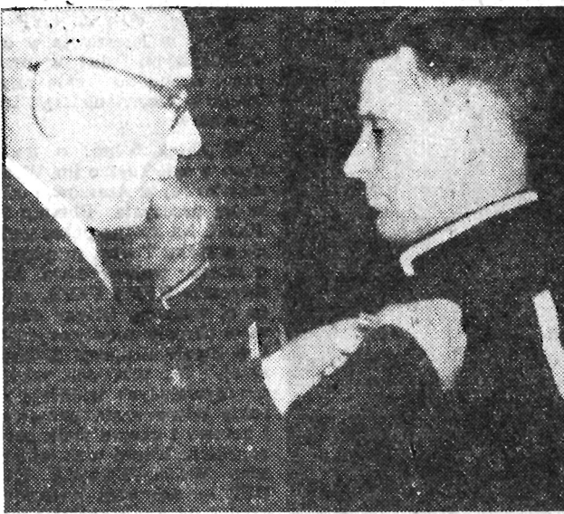
Powitanie I sekretarza KC PZPR Władysława Gomułki na Dworcu Głównym w Katowicach.

MOSKWA (PAP). Narody Związku Radzieckiego obchodzą 5 grudnia jako Dzień Konstytucji. „PRAWDA” w artykule wstępnym poświęconym Świętu Konstytucji stwierdza m. in. że w roku bieżącym dzień ten jest obchodzony w warunkach powszechnego entuzjazmu politycznego i entuzjazmu pracy, który wywołał przygotowania do XXI Zjazdu Partii Komunistycznej. Miliony ludzi radzieckich omawia obecnie wszechstronnie tezy referatu N. S. Chruszczowa na XXI Zjazd Partii o wskaźnikach rozwoju gospodarki narodowej ZSRR na lata 1959—1965. Na podstawie szybkiego rozwoju sił produkcyjnych w mającym nastąpić siedmiolciu — pisze następnie „Prawda” — rozwiązanie zadania znacznego podniesienia stopy życiowej ludności i stworzenia w kraju warunków obfitości dóbr materialnych, potrzebnych — jak wskazywał Lenin — do zapewnienia dobrobytu i wszechstronnego rozwoju wszystkich członków społeczeństwa.