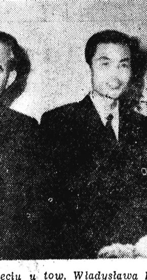
Przyjęcie w Brukseli

KIELCE (PAP). Codziennie rano, w południe i wieczorem rozlega się w Lasach Smardzawskich charakterystyczny dźwięk gongu. To strażnicy dają znać przebywającym w rezerwacie żubrom, że zbliża się pora posiłków. Żubry tak się przyzwyczyły do tej formy wołania, że na każdy gong zjawiają się przy ogrodzeniu.