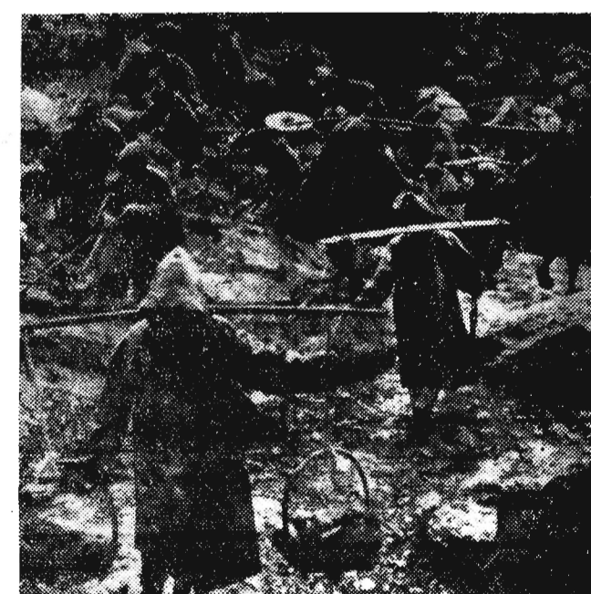
To zdjęcie chińskie zatytułowane: „Na ulewny deszczu praca jest cięższa” odznaczoną została pierwszą nagrodą na Międzynarodowej Wystawie Zdjęć Prasowych w Budapeszcie we wrześniu br. Autorem fotografii jest Chen Po. Zdjęcie obrazuje pracę ludu chińskiego przy budowie zbiornika wodnego około grobowców dynastii Ming w pobliżu Pekinu.

„Będziemy mieli tyle fabryk i zakładów — ile gwiazd na niebie” — powiada Chińczycy, lubując się w metaforach. Na apel KPCh rozwija się w całym kraju masowy ruch organizacji naukowych i technicznych, które powstają w wsiach, w osiedlach i miastach. Kraj ten przeżywa niesłychanie burzliwą rewolucję techniczną.