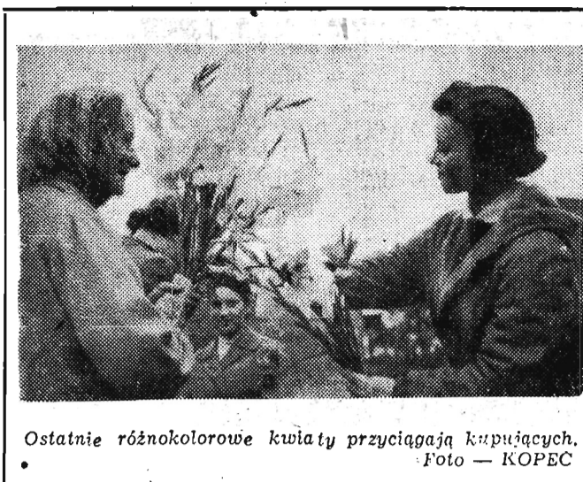
Ostatnie różnokolorowe kwiaty przyciągają kupujących.

ROZGŁOSNIA RZESZOWSKA 8.35 „Nauczycielskie ścieżki” - pół wieków wspomnień J. Kolanika 8.50 Nowości naszej taśmoteki muzycznej.