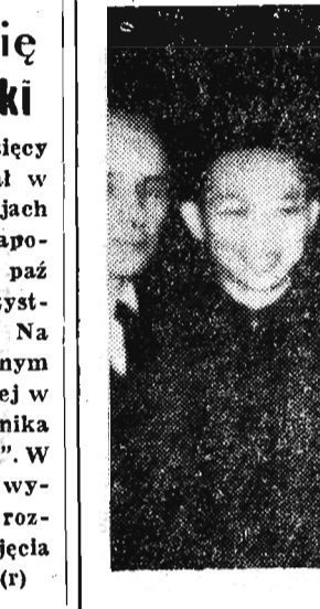
Przed budynkiem KW PZPR