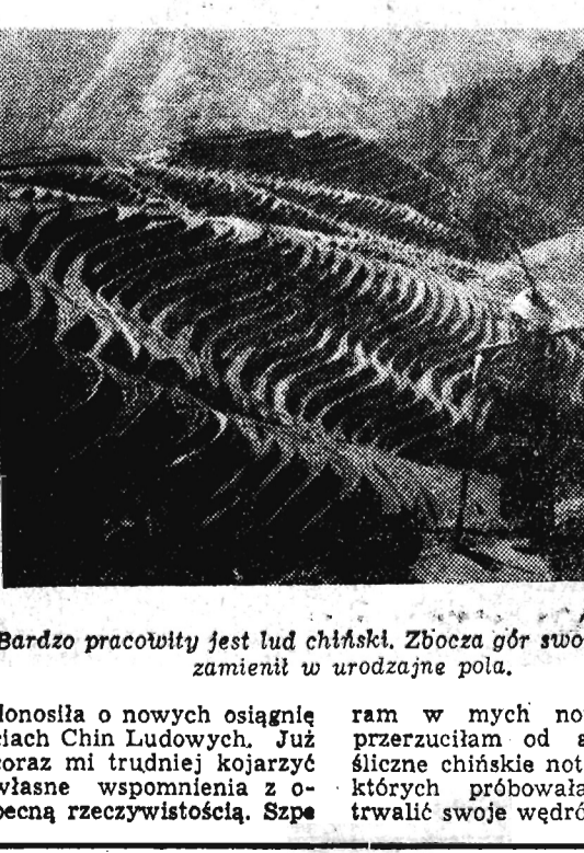
Bardzo pracowity jest lud chiński. Złocza gór swoimi rękami zamienił w urodzajne pola.

2 lata temu, 1 października, stałam przed Tiań An-meń (Bramą Niebiańskiego Spokoju), na największym placu w Pekinie, przyglądając się wielkiemu pochodowi w 7 rocznicę powstania Chińskiej Republiki Ludowej. Deszcz lał jak z cebra, a mimo to nie ruszyłam się na krok. W tradycyjnej manifestacji miałam okazję zobaczyć przegląd 7-letnich osiągnięć młodej republiki. Potem zaczęła się moja 2-miesięczna podróż w głąb Chin. I wtedy przychodziło mi — obok ustawicznego zdumienia nad niesłychanie szybkim, wszechstronnym rozwojem tego kraju — otwierać szeroko oczy wobec tego, co ten naród zrobił w dziedzinie przemysłu i techniki. W ciągu zaledwie 7 lat — i to prawie wszystko budując od podstaw. Minęły dwa lata. W ciągu tego czasu nie było prawie dnia, aby prasa nie donosiła o nowych osiągnięciach Chin Ludowych. Już coraz mi trudniej kojarzyć własne wspomnienia z obecną rzeczywistością. Szpe-