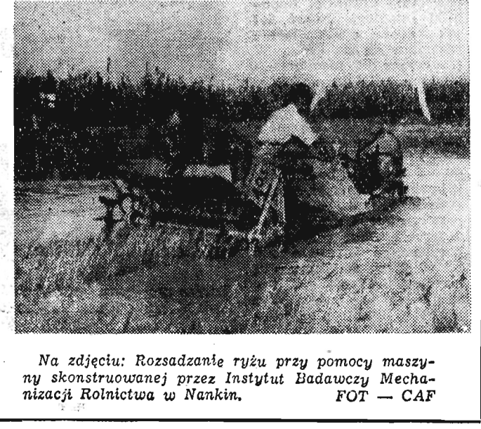
Na zdjęciu: Rozsadzanie ryżu przy pomocy maszyny skonstruowanej przez Instytut Badawczy Mechanizacji Rolnictwa w Nankin.