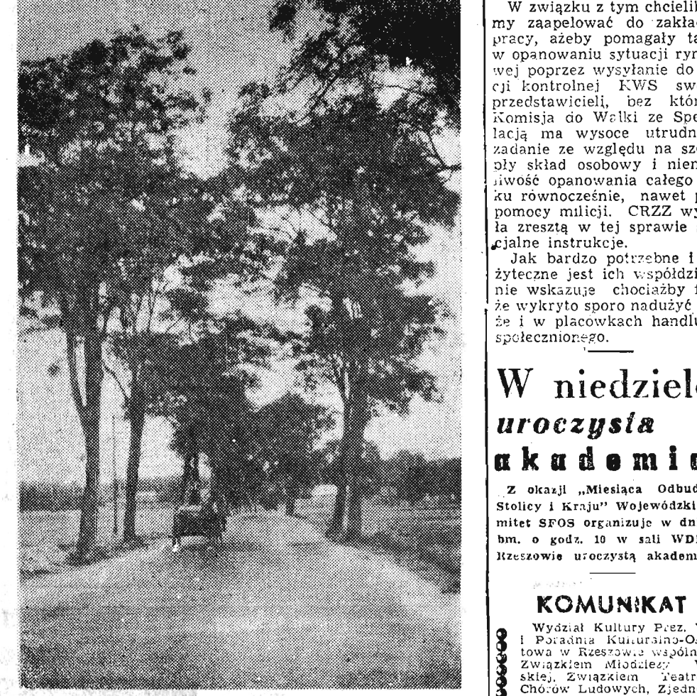
Na zdjęciu: fragment drogi prowadzącej z Dęby do Kolbuszowej.