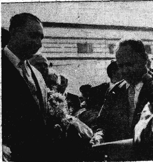
Na zdjęciu: Powitanie na lotnisku. Z lewej — Petro Tanczew.

6. IX. 1958 r. przybyła do Warszawy delegacja parlamentarzystów bułgarskich. Na jej czele stoi wiceprzewodniczący Biura Zgromadzenia Narodowego Bułgarskiej Republiki Ludowej — Petro Tanczew.