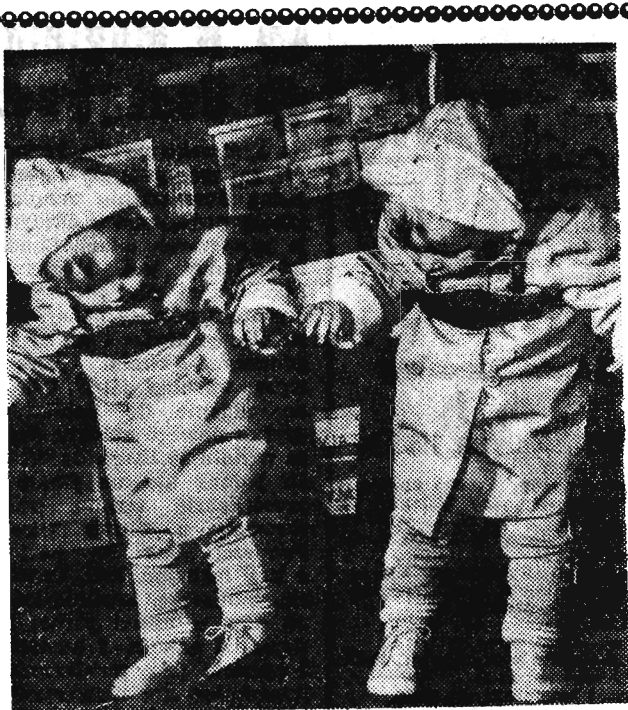
Kupujemy nowe buciki...

Tylko mniej słów. Chodzi o czyni. ELZBIETA JAKUBOWSKA