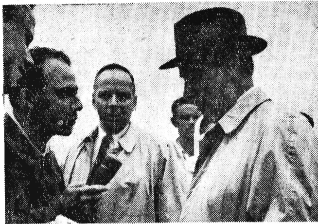
Na zdjęciu: Adlai Stevenson, przywódca Demokratycznej Partii USA na lotnisku Okęcie.

LONDYN (PAP). Sąd w Nigel (Transvaal) skazał 22-letniego Murzyna, Corneliusa Motosopa na karę trzech miesięcy więzienia za napisanie listu miłosnego do przedstawicielki rasy białej. Jak wiadomo, na terenie Unii Południowo-Afrykańskiej zabronione są wszelkie intymne stosunki między białymi, a pozostałymi rasami.