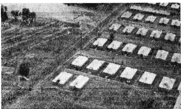
W tych namiotach obozują członkowie Ochotniczych Hufców Pracy budujący kolejkę w Bieszczadach. (Zdjęcie wykonane z samolotu.)