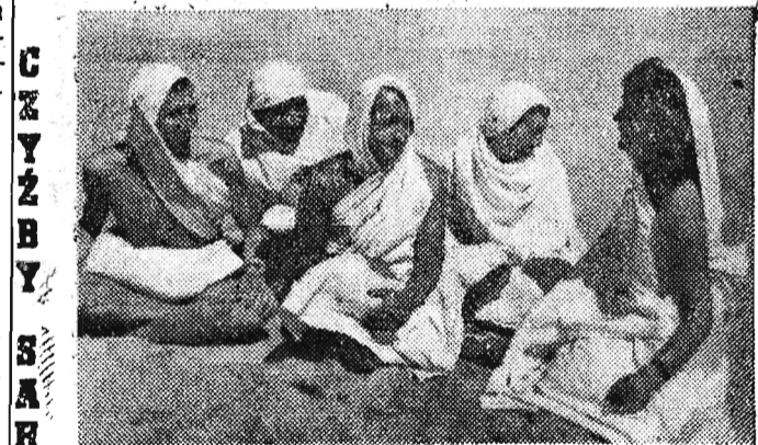
Autentyczne zdjęcie z polskiej „Sahary” — czyli z wycieczki piaszczystych kolo Leby...