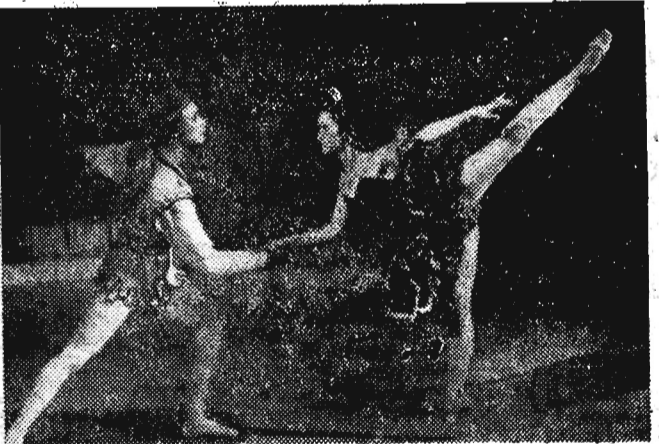
Na zdjęciu: Duet Księża i Czarnego Łabędzie.