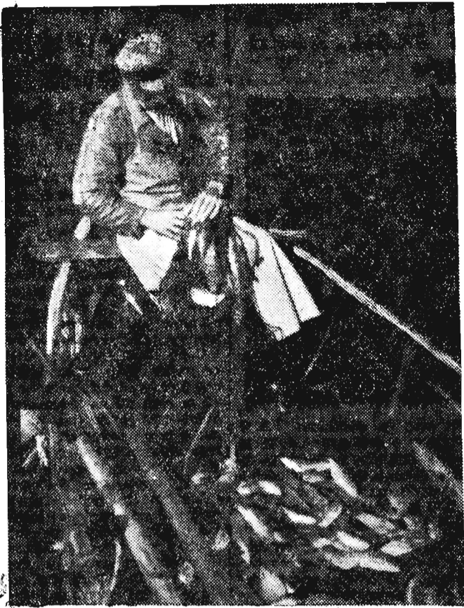
Na zdjęciu: Na jeziorze Śniardwy gospodarują rybacy Państwowego Gospodarstwa Rolnego z Mikołajek.