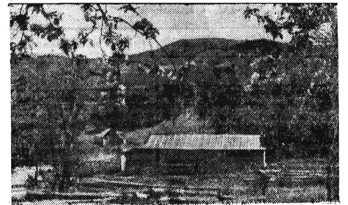
Widok na Skrzyżno