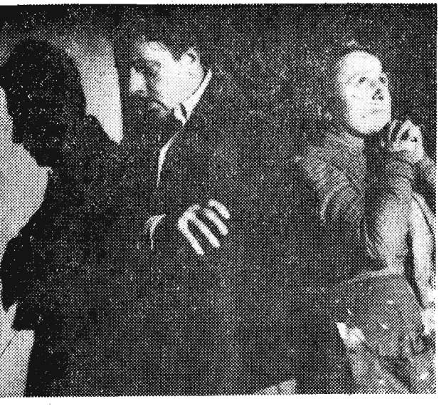
Wczoraj na ekran kina „Zorzy“ wszedł nowy film produkcji włoskiej reżyserii E. De Filippo „Neapol miasto milionerów“...