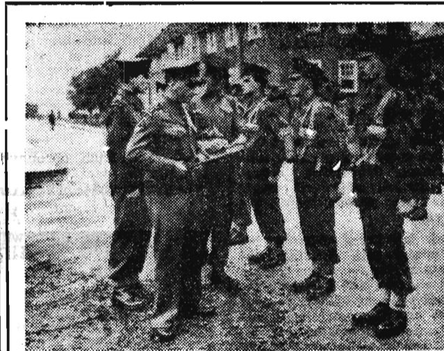
Na zdjęciu: Żołnierze brytyjscy przygotowują się do wyjazdu na Cypr.

27 czerwca br. o godz. 11 Fabryka Firanek w Skopaniu wykonała plan produkcji i półrocza. Dodatkowa wartość produkcji, jaką zakład wykona do końca czerwca, wynosi ponad pół miliona zł. (r)