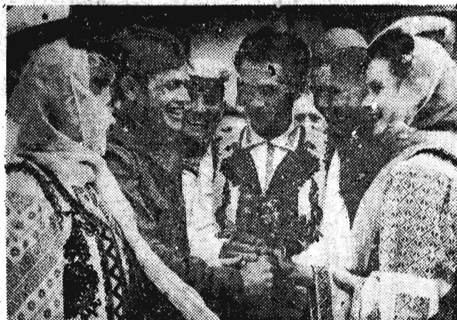
Na zdjęciu: Powracających do ojczyzny żołnierzy radzieckich zęgnia ludność rumuńska na dworcu w Jasach.