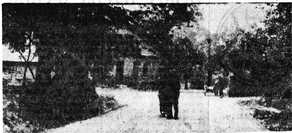
W czerwcu 1933 r. kurz na odcinku drogi widocznym na zdjęciu zrudział od przelanej chłopskiej krwi.

Urządzuje w pokoiku przy ległym do warsztatu szewskiego, zawalonym skórą, butami już naprawionymi i czekającymi na naprawę, narzędziami i innymi niezbędnymi w szewskim rzemieśle akcesoriami. Nim spytasz Stopyrę o sprawy