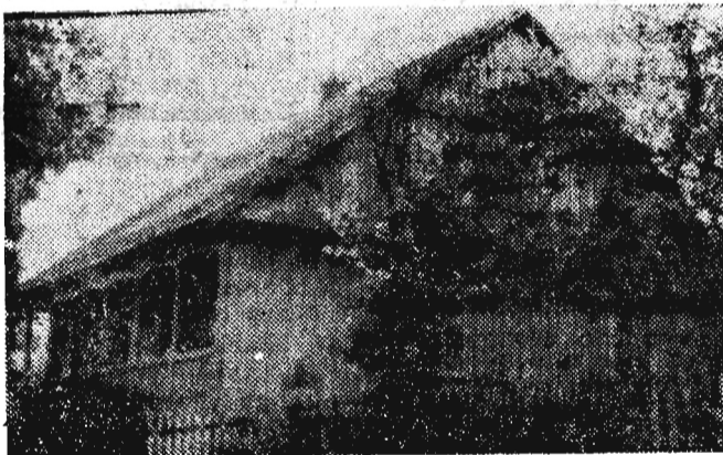
Z okien tego budynku otwarta policja ogień do manifestujących w Grodzisku chłopów.

Łotwy. 60 gr za dniówkę harówki na polu płaćci dzierżawca miejscowego majątku i robotników mimo wszystko mu nie brakło. Czy zgadniesz co można było wtedy kupić za zarobione w ciągu tego dnia pieniądze? 60 dkg cukru, albo 1 kg chleba. Musisz przyznać, że wynagrodzenie nie było wcale sowsite.