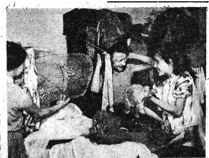
Zespół artystyczny przy świetlicy dziecięcej WSM (Warszawska Spółdzielnia Mieszaniowa) — Zespół przygotowuje się do niecodziennego występu. 1 czerwca — w dniu święta wszystkich dzieci — zespół wystąpi w Teatrze Komedi bajkę pt. „Kwiat paproci”. Dochód uzyskany z przedstawień członkinie zespołu postawił ofiarować na pomoc dla dzieci z terenów nawiędzonych powodzią i huraganem. Na zdjęciu: Przygotowywanie strojów i dekoracji.