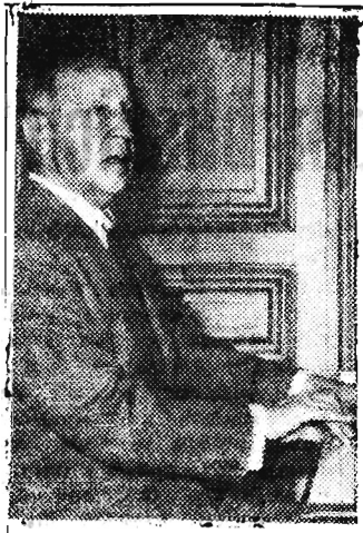
Światowej sławy pianista Artur Rubinstein, który wrócić będzie w stepował w Polsce.

Miłośnicy filmu zapoznają się ze zdjęciami z III serii „Cichego Donu”, a miłośnicy techniki znajdują wiele bardzo ciekawego materiału o telewizji, teleskopach i innych nowościach techniki radzieckiej.