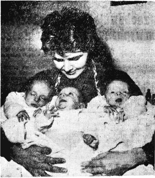
Francuskiemu lekarzowi - ginekologowi nazwiskiem Soymie, którego żona jest położną, urodziły się trojaczki.