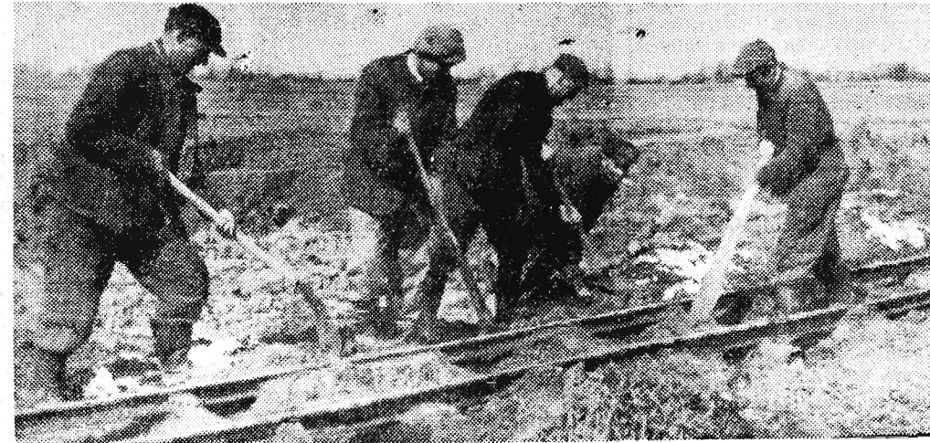
Grupa robotników przy konserwacji torów roboczych kolejki wąskotorowej.

Przez całą zimę (bez względu na pogodę) robotnicy krajowego Przedsiębiorstwa Robót Kolejowych nr 9 pracowali przy budowie nowej linii kolejowej Rzeszów — Kolbuszowa — Dęba. W tej chwili dysponujemy konkretnymi danymi, co już zrobiono i jakie są plany prac na rok bieżący.